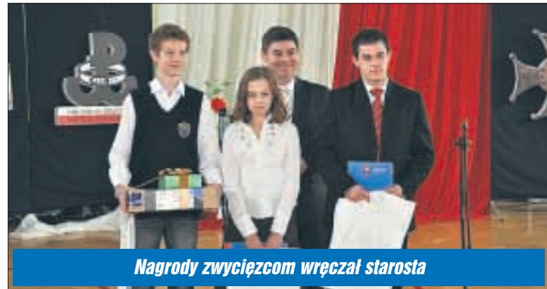
Nagrody zwycięzcom wręczał starosta

W bieżącym roku miała miejsce 65. rocznica Powstania Warszawskiego. Aby to uczcić Muzeum Historyczne w Legionowie wzięło udział w organizacji Konkursu Wiedzy o Polskim Państwie Podziemnym, Armii Krajowej i Szarych Szeregach. W sobotę starosta legionowski wręczył nagrody zwycięzcom konkursu.