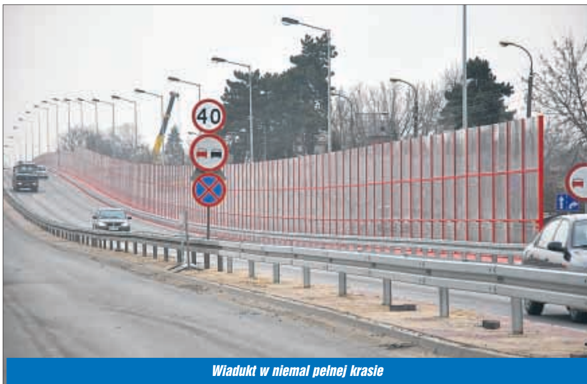
Wiadukt w niemal pełnej krasie

Oczywiście przydałaby się jeszcze przebudowa odcina drogi 61 od Jabłonną na Piaski. Z ostatnich informacji wynika, że odcinek do Jabłonną do wiaduktu będzie budowany w przyszłym roku. Dalsza część trasy powinna być gotowa najpóźniej do 2012 r. ■