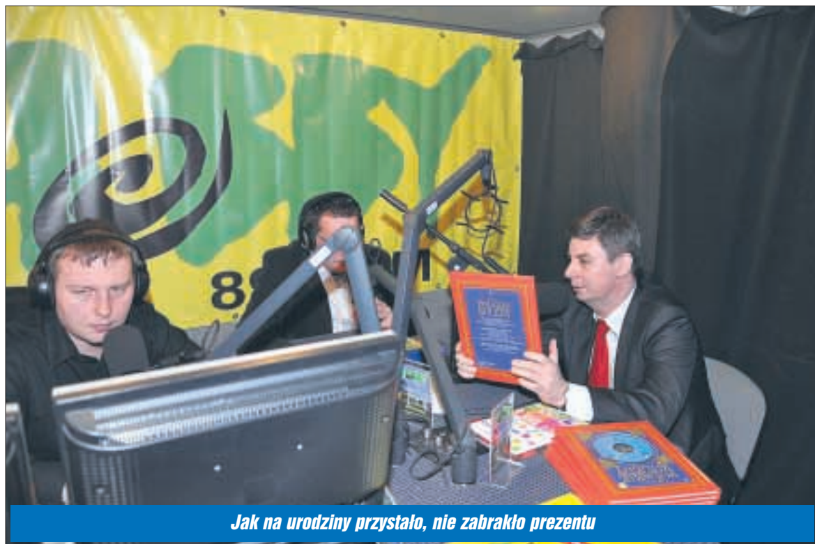
Jak na urodziny przystało, nie zabrakło prezentu

Radio Hobby ma swoją siedzibę w Legionowie.