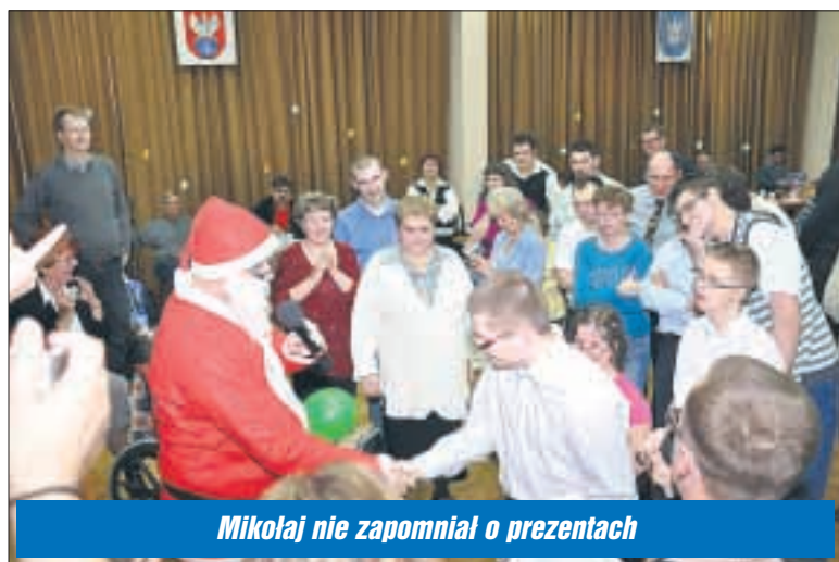
Mikołaj nie zapomniał o prezentach

Co roku przed Bożym Narodzeniem, w auli Starostwa Powiatowego w Legionowie, spotykają się dzieci z Kół Specjalnej Troski przy Towarzystwie Przyjaciół Dzieci, aby świętować zbliżające się święta. Podobnie było i w tym roku.