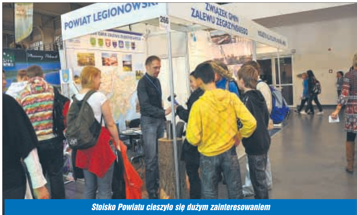
Stoisko Powiatu cieszyło się dużym zainteresowaniem

Powiatowe stoisko gościło w Poznaniu wielu profesjonalistów branży turystycznej oraz klientów indywidualnych, szukających pomysłów na ciekawe spędzenie wolnego czasu. Najczęściej pytano o informator usług hotelowych i bazy rekreacyjno-sportowej. Wielkim zainteresowaniem cieszyły się nasze mapki, publikacje i gadżety. Dużą atrakcją było własnoręczne wybijanie pamiątkowych monet powiatu. Odwiedzający stoisko pytali w głównej mierze o Jezioro Zegrzyńskie i możliwości aktywnego wypoczynku w naszym powiecie. ■