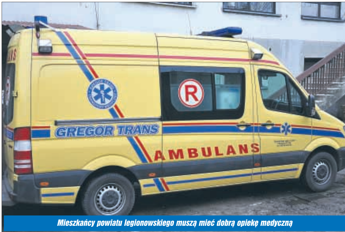
Mieszkańcy powiatu legionowskiego muszą mieć dobrą opiekę medyczną

stwa Otwartego w Legionowie. Zgodnie z ustawą z dnia 8 września 2006 roku o Państwowym Ratownictwie Medycznym osoba w stanie nagłego zagrożenia zdrowotnego transportowana jest do