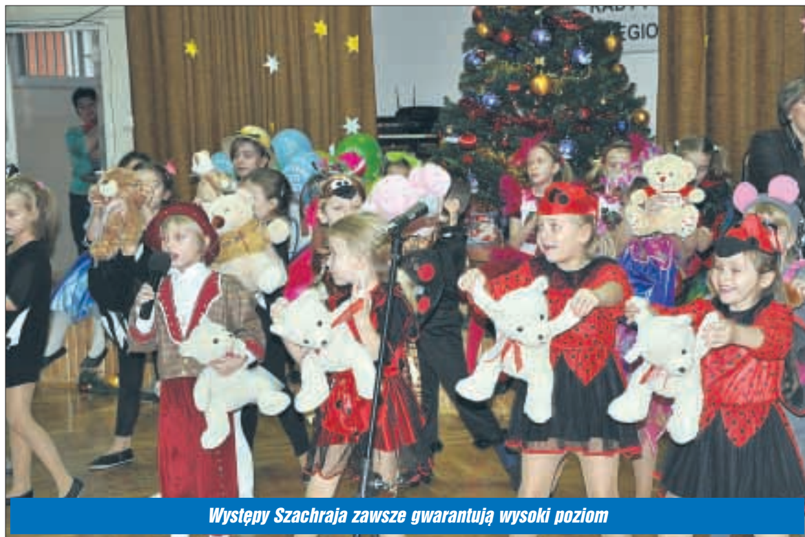
Występy Szachraja zawsze gwarantują wysoki poziom

W gorącej atmosferze i wśród przyjaciół, w sobotę 5 grudnia, legionowski zespół taneczno-wokalny „Szachraj”, świętował swoje 15 urodziny.