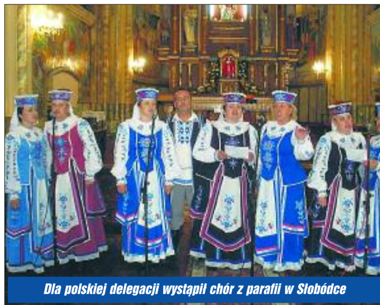
Dla polskiej delegacji wystąpił chór z parafii w Słobódce

Poza przekazaniem książek w programie wizyty znalazło się również spotkanie z przedstawi-