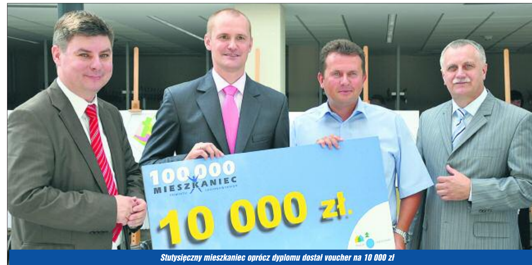
Stutysięczny mieszkaniec oprócz dyplomu dostał voucher na 10 000 zł