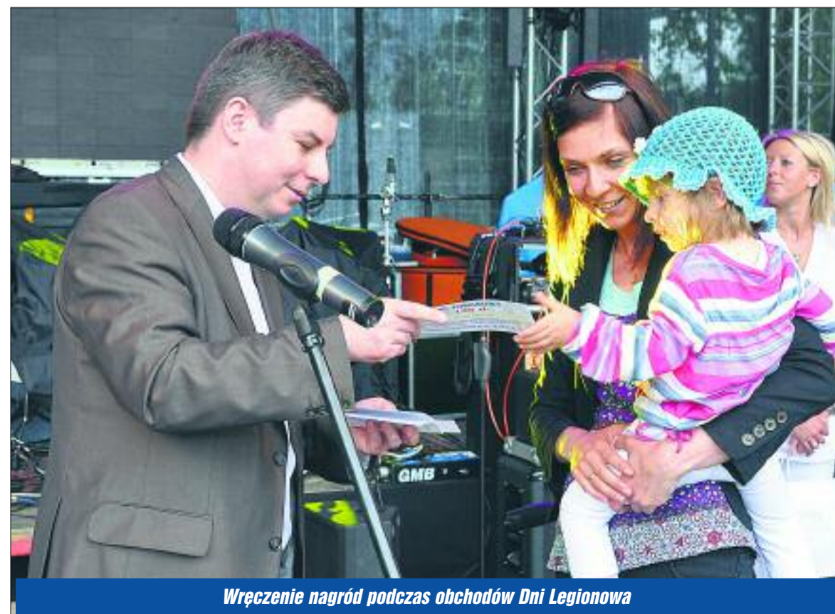
Wręczenie nagród podczas obchodów Dni Legionowa