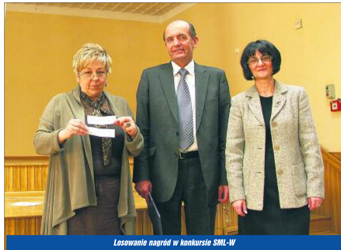
Losowanie nagród w konkursie SML-W