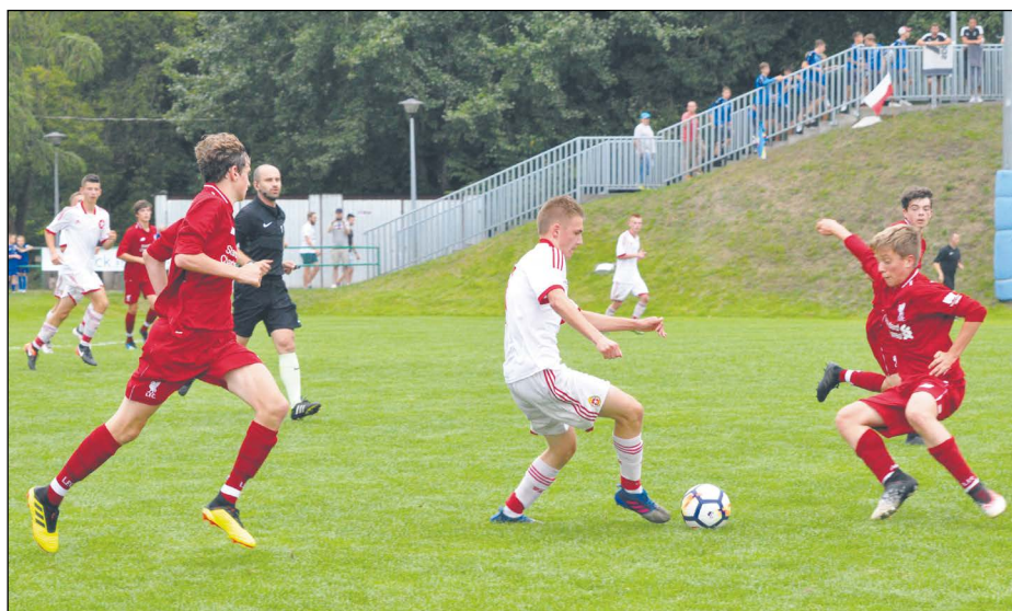
W zaciętym i pełnym emocji pojedynku Liverpool FC pokonał FC Viktoria Pilzno 3:0