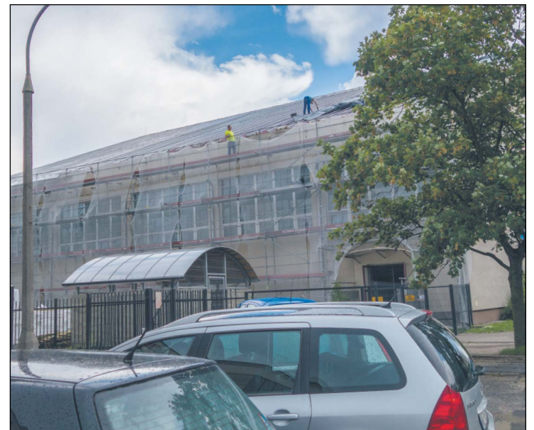
Prace związane z wymianą dachu hali sportowej przy PZSO w Legionowie powinny zakończyć się we wrześniu br.