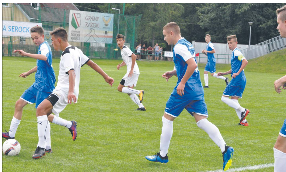
Pierwszy mecz turniej rozegrały drużyny Powiatu Legionowskiego i Wisły Kraków. Zespół gospodarzy musiał uznać wyższość rywala

miejsca zajęły drużyny Wisły Kraków (wicemistrz), Viktorii Pilzno i Powiatu Legionowskiego. Powiat Legionowski był patronem i współorganizatorem wydarzenia. JK