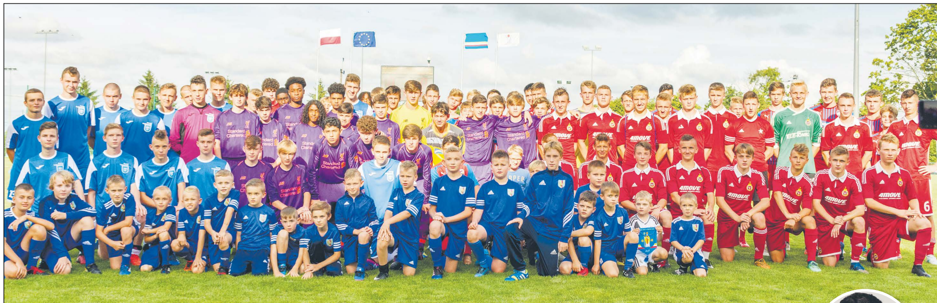
W międzynarodowym turnieju Serock Cup wystartowały cztery zespoły: angielski Liverpool FC, czeski FC Viktoria Pilzno, Wisła Kraków oraz drużyna Powiatu Legionowskiego

Młodzieżowe drużyny z Anglii, Czech i Polski rozegrały pierwszy w historii powiatu legionowskiego międzynarodowy turniej futbolowy. Organizatorem piłkarskich zmagania był Klub Sportowy Sokół Serock, który w tym roku obchodzi 65. jubileusz powstania.