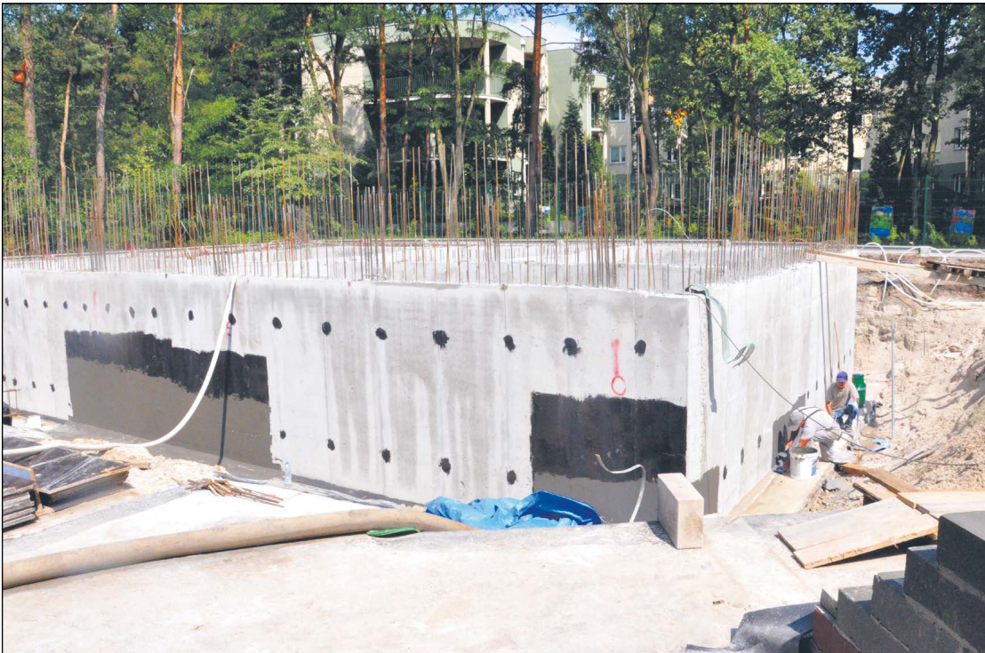
Budowa przy Jagiellońskiej 69 przebiega zgodnie z harmonogramem. Gotowa jest już płyta żelbetowa części podpiwnicznej. Wykonano ściany żelbetowe w poziomie piwnic oraz ławy fundamentowe części niepodpiwnicznej. Wykonywane są zbrojenia ław schodkowych i przygotowywane szalunki

Trwa budowa Centrum Poradnictwa i Wczesnego Wspomagania Rozwoju Dziecka w Legionowie. Pod nowy budynek została wylana płyta fundamentowa i rozpoczęły się prace na poziomie piwnic.