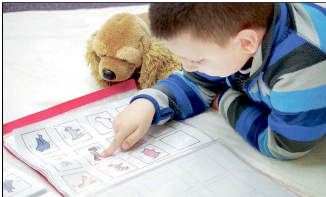
Uczące się w Zespole Szkół i Placówek Specjalnych w Legionowie dzieci korzystają z najbardziej skutecznych terapii

Zajęcia specjalistyczne, doposażenie sal dydaktycznych oraz dodatkowy nabór do przedszkola specjalnego w Powiatowym Zespole Szkół i Placówek Specjalnych w Legionowie (PZSiPS) to cele, na które powiat pozyskał ponad 400 tysięcy złotych dotacji z UE i dołożył do nich jeszcze 100 tysięcy z własnego budżetu.