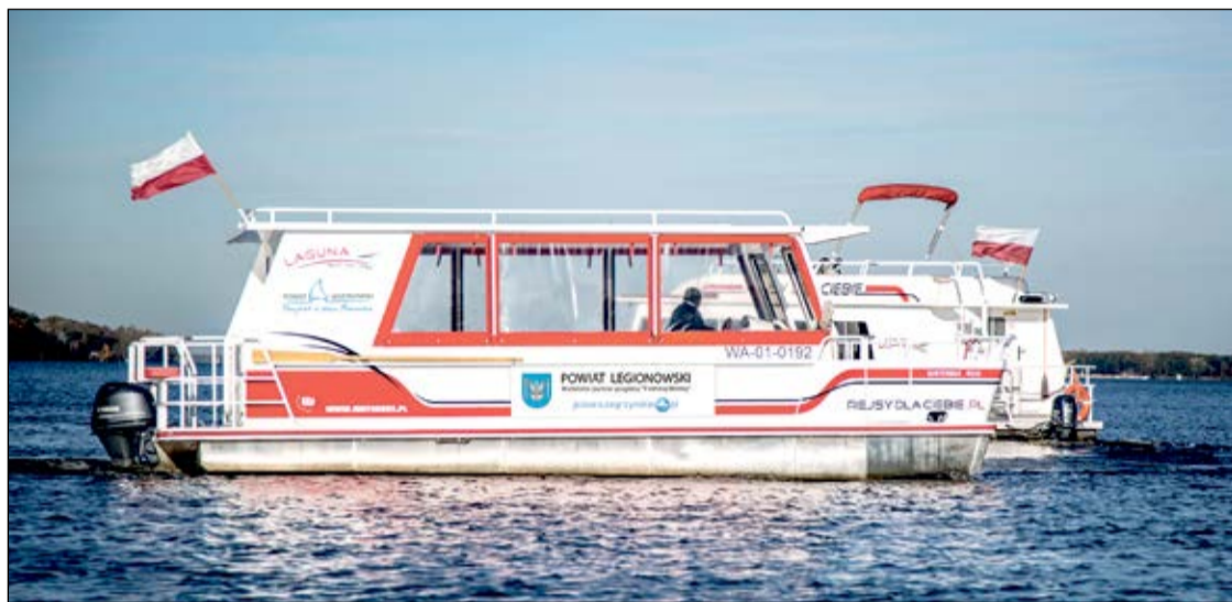
Statek Laguna promuje atrakcje turystyczne Powiatu Legionowskiego

1 maja rozpoczął się sezon żeglugi pasażerskiej na Jeziorze Zegrzyńskim. Popularne statki – Laguna, Albatros i Zefir – zapraszają na rejsy po szlakach wodnych. Z tafli Jeziora podziwiać możemy zarówno okoliczne rezerваты, jak i atrakcje turystyczne usytuowane wokół akwenu.