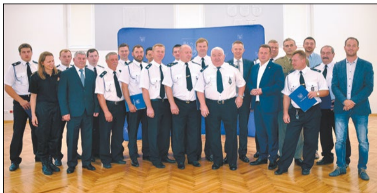
Na terenie powiatu legionowskiego funkcjonuje szesnaście jednostek Ochotniczej Straży Pożarnej. Na spotkaniu w starostwie ich przedstawiciele otrzymali uroczyste podziękowania za zaangażowanie i pełną mobilizację w walce ze skutkami czerwcowej nawałnicy

W trakcie spotkania, które odbyło się 12 lipca br., w siedzibie starostwa uroczysto podziękowano druhom Ochotniczych Straży Pożarnych z terenu powiatu legionowskiego za ich zaangażowanie w usuwanie skutków nawałnicy, która nawiedziła nasz teren pod koniec czerwca.