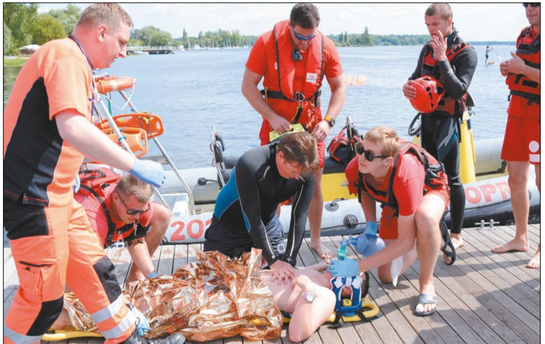
W ubiegłym roku w Polsce miały miejsce 504 utonięcia. W tym roku już ponad 140. Niestety wciąż zbyt wiele osób nie przestrzega zasad bezpieczeństwa przebywając nad wodą