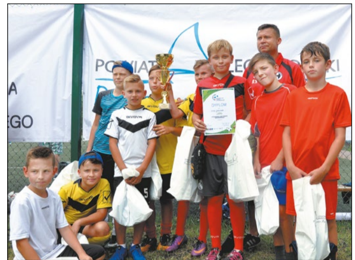
W roczniku 2007 najwięcej punktów wywalczyli zawodnicy Wisły Jabłonna

Zakończyła się już 4. edycja Piłkarskiej Ligi Powiatu Legionowskiego. Ostatnia seria turniejów dla wszystkich grup wiekowych odbyła się 25 czerwca br., na terenie Stadionu Miejskiego w Legionowie. Udział wzięło ponad 350 zawodników z 33 zespołów.