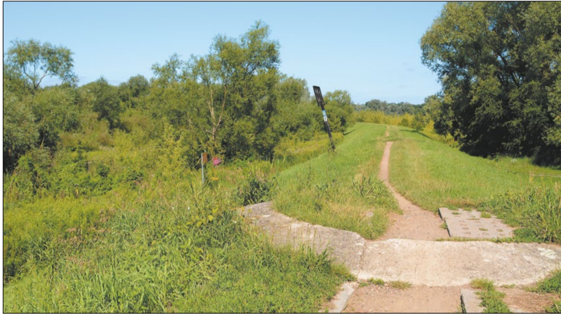
Przebudowa wałów na odcinku Jabłonna-Nowy Dwór Mazowiecki to niezbędna inwestycja, która zapewni bezpieczeństwo przeciwpowodziowe

Rusza przygotowanie rozbudowy oraz remontu wału przeciwpowodziowego Wisły na długości prawie 19 km po stronie powiatów legionowskiego i nowodworskiego. Nowa budowla będzie spełniała wszystkie wymagania techniczne zapewniając mieszkańcom bezpieczeństwo.