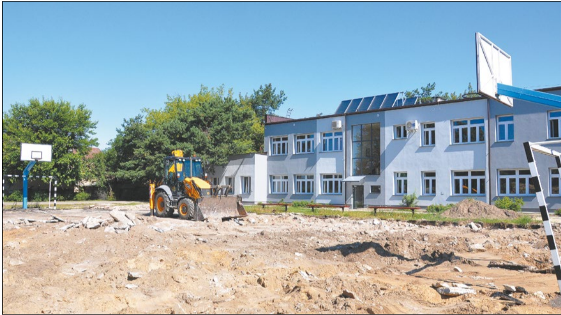
Budynek szkoły przy ul. Targowej ma już nową elewację. Teraz przyszedł czas na wyposażenie placówki w nowoczesne boisko sportowe. Prace właśnie ruszyły

Dzięki inwestycji w szkole przy ul. Targowej w Legionowie jednostka prowadząca tę placówkę, czyli Powiat Legionowski, zaoszczędzi fundusze i przyczyni się do ochrony środowiska naturalnego.