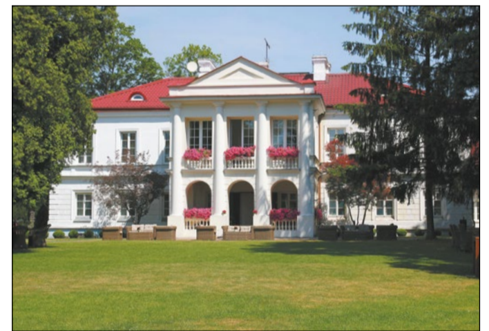
Fot. Krzysztof Czarnecki „Pałac Krasieńskich w Zegrzu”

Znamy już kolejnego laureata konkursu fotograficznego „Architektura powiatu legionowskiego w obiektywie”. „Pałac Krasieńskich w Zegrzu” autorstwa Krzysztofa Czarneckiego zostało zdjęciem miesiąca w czerwcu.