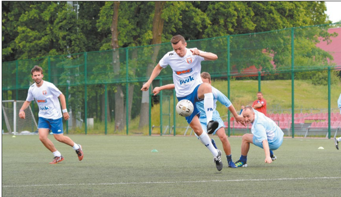
Powiat Legionowski w bratobójczym pojedynku z Miastem Legionowo

Już 10 lat minęło od pojawienia się Mazovii Cup w kalendarzu największych piłkarskich wydarzeń samorządowych w naszym województwie. W jubileuszowych rozgrywkach uczestniczyły 22 zespoły reprezentujące powiaty, gminy i instytucje zaprzyjaźnione.