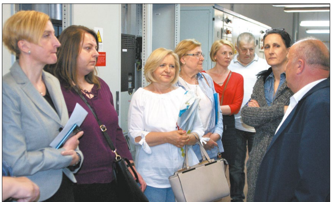
Projekt, którego budżet opiewa na ponad 600 tys. zł, ma za zadanie umożliwić wymianę doświadczeń i dobrych praktyk pomiędzy pracodawcami a osobami wchodzącymi na rynek pracy