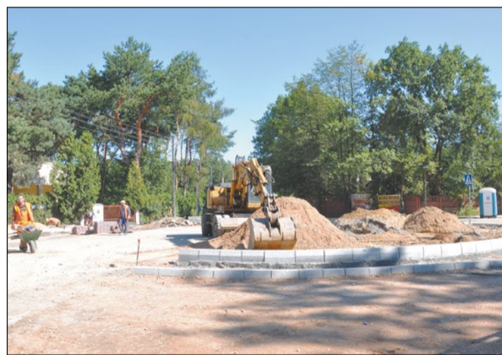
Prace przy budowie ronda na skrzyżowaniu Al. Legionów z Al. Róż idą pełną parą. Ich finisz zaplanowano na koniec sierpnia

W połowie drogi jest ekipa budująca rondo na skrzyżowaniu Al. Legionów i Al. Róż w Legionowie. Zadanie ma być wykonane przed końcem wakacji, ponieważ w okresie tym wzrasta natężenie ruchu drogowego.