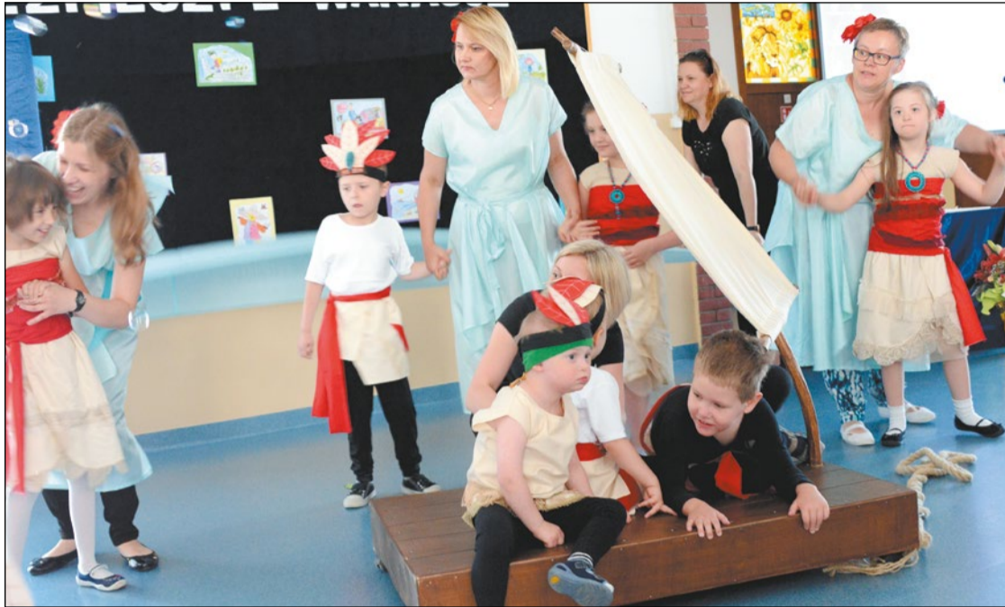
Z okazji spotkania podopieczni Przedszkola Specjalnego przygotowali występ artystyczny

W Powiatowym Zespole Szkół i Placówek Specjalnych w Legionowie dobiegła końca realizacja projektu pn. „Dziecko w wieku przedszkolnym – aktywny partner w edukacji, komunikacji oraz zabawie. Projektowanie sytuacji edukacyjnych ukierunkowanych na rozwój umiejętności komunikacyjnych i społecznych u dzieci z autyzmem i niepełnosprawnych intelektualnie. Projektowi partnerowało Starostwo Powiatowe w Legionowie.