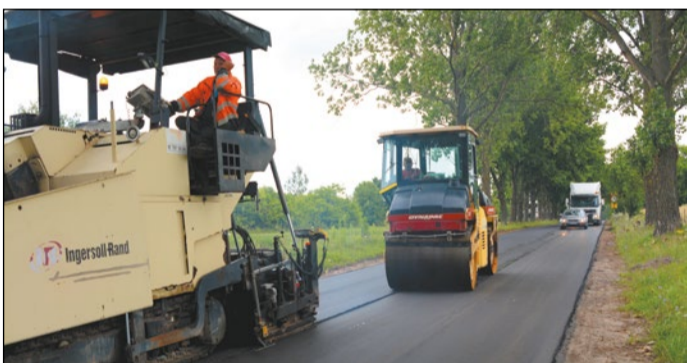
Roboty w Woli Kiełpińskiej są już bardzo zaawansowane i przebiegają zgodnie z harmonogramem

Powiat Legionowski już na początku sierpnia br. odda do użytku przebudowywany ponad 1300-metrowy odcinek drogi 1803W z Dosina do Woli Kiełpińskiej. Obecnie trwają zaawansowane prace przy kładzeniu nawierzchni bitumicznych.