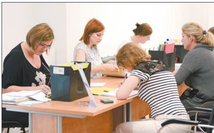
Zainteresowani udziałem w projekcie uzyskali wszelkie niezbędne informacje podczas spotkania, które odbyło się 14 lipca br. w budynku starostwa

Powiatowy Urząd Pracy w Legionowie we współpracy z Wojewódzkim Urzędem Pracy w Warszawie i Zakładem Doskonalenia Zawodowego w Warszawie przystąpił do realizacji projektu zakładającego aktywizację zawodową osób długotrwale bezrobotnych. Środki na ten cel pochodzą z Funduszu Pracy.