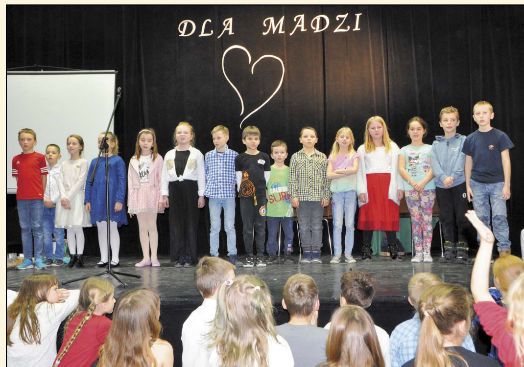
Inicjatorami akcji charytatywnej byli rodzice uczniów klas IIc i VIb ze szkoły w Łajskach. Szczytny cel połączył lokalną społeczność, w pomaganie włączyli się wszyscy bez względu na wiek

Jesteśmy bardzo wdzięczni całemu środowisku skupionemu wokół tej wyjątkowej szkoły, wszystkim ludziom zaangażowanym w tę akcję – rodzicom, uczniom oraz gronu pedagogicznemu. Dziękujemy za okazane serce i zbiórkę funduszy na ratowanie zdrowia naszej córki. Odezwe społeczny i rozmiar akcji przeszedł nasze oczekiwania. Był to jeden z najpiękniejszych dni w naszym życiu. Dzień wyjątkowych ludzi na rzecz wyjątkowego dla nas celu. Dziękujemy.