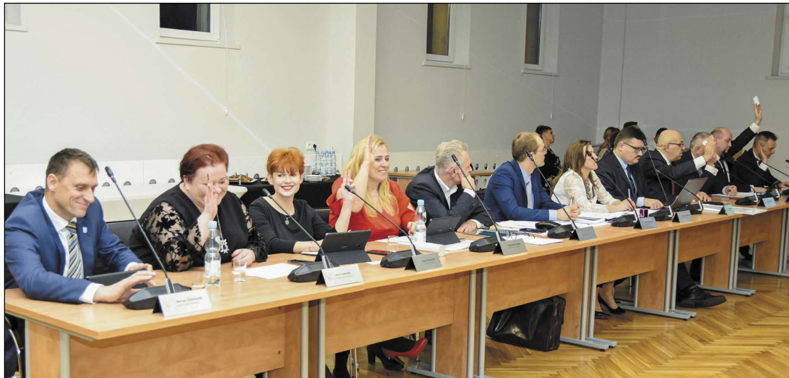
Radni powiatu przyjęli budżet na 2020 rok. Wartość zaplanowanych w nim wydatków jest o prawie 2,5 mln zł większa w stosunku do budżetu uchwalonego w roku ubiegłym

Zgodność ze strategią rozwoju powiatu, realizacja zadań w zakresie edukacji, zdrowia i bezpieczeństwa, wsparcie pieczy zastępczej i dzieci z niepełnosprawnościami oraz utrzymanie wysokiej jakości usług świadczonych na rzecz mieszkańców to główne założenia budżetu powiatu na 2020 rok. Wartość zaplanowanych w nim wydatków to ponad 125 mln złotych.