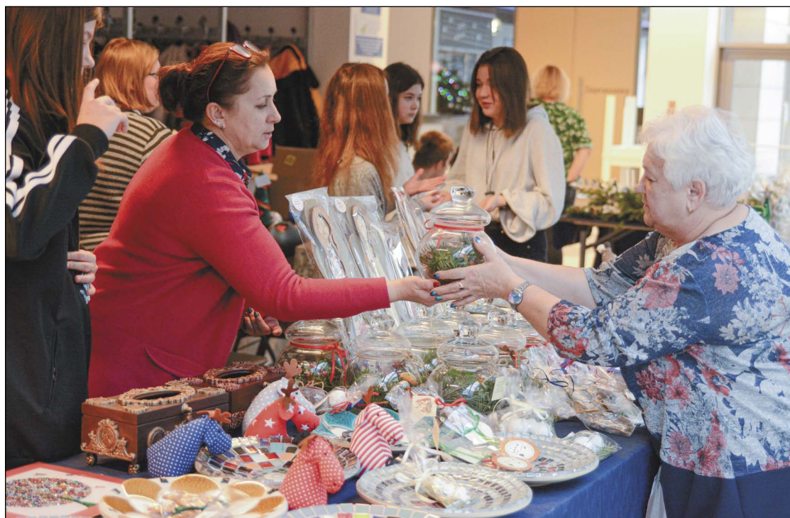
Odwiedzający kiermasz chętnie kupowali unikatowe rękodzieło, wspierając tym samym osoby z niepełnosprawnościami

Doroczny Świąteczny Kiermasz i Koncert Kolęd Fundacji „Promień Słońca” odbył się 19 grudnia w legionowskim ratuszu.