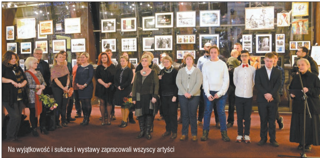
Na wyjątkowość i sukces wystawy zapracowali wszyscy artyści

Od początku grudnia w atrium legionowskiego ratusza można było oglądać dziesiątą, jubileuszową wystawę zdjęć Grupy Fotograficznej „Migawki”, której towarzyszyła prezentacja gobelinów pracowni Gobel Artki oraz fotografii młodzieży z Powiatowego Zespołu Szkół i Placówek Specjalnych w Legionowie. Wydarzenie otrzymało wsparcie Powiatu Legionowskiego.