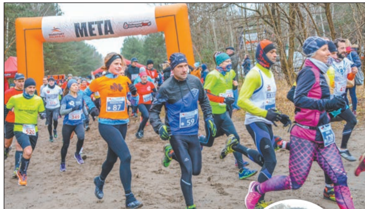
W III Biegu Zająca wzięło udział prawie 500 zawodników

Fundacja Active Life we współpracy z Powiatem Legionowskim 16 grudnia br., w Legionowie zorganizowała trzecią edycję charytatywnego Biegu Zająca. Impreza jest dedykowana osobom niepełnosprawnym.