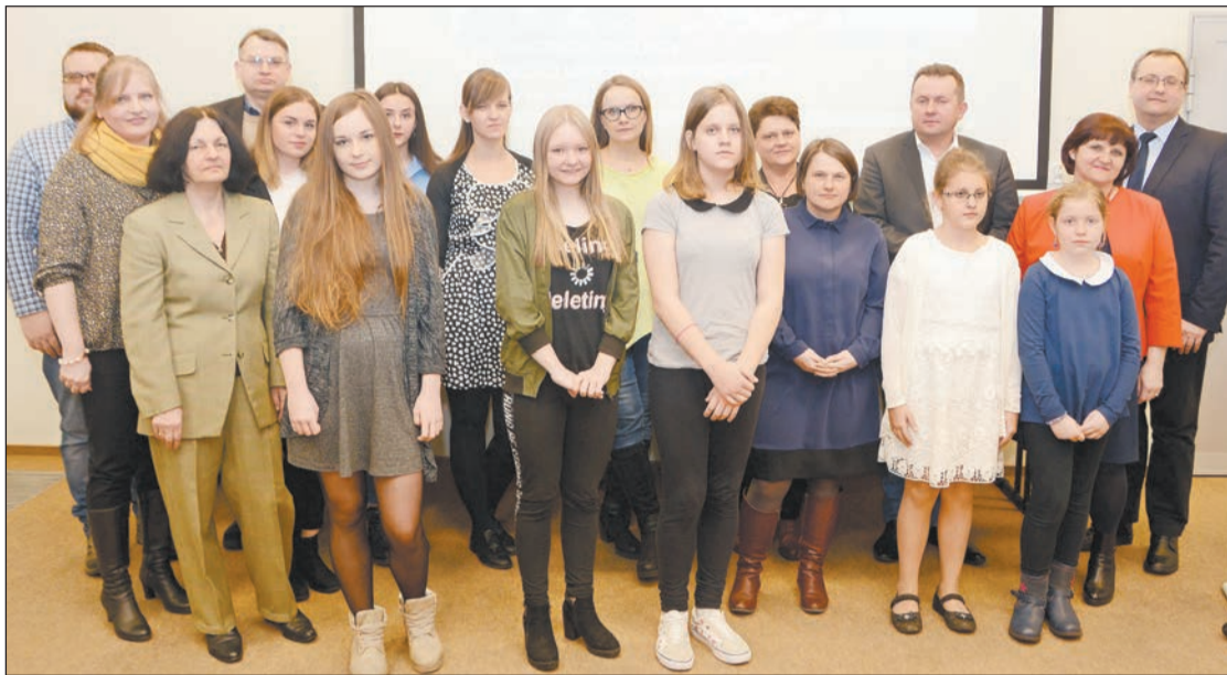
Autorzy najlepszych wypracowań, oprócz słów uznania i gratulacji, otrzymali dyplomy oraz nagrody rzeczowe

Szkoły na terenie powiatu legionowskiego powinny kształtować lokalną tożsamość, gdyż uczniowie potrzebują poczucia przynależności. Stąd pomysł na scenariusz lekcji wychowawczej. Zagadnienie jest trudne, ale jest częścią historii Legionowa. Dzięki zwróceniu uwagi na aspekt lokalny, możemy równocześnie przybliżyć młodzieży wiedzę dotyczącą historii. Ten temat pokazuje dodatkowo, że nie ma łatwych wyborów i ocen, budzi wrażliwość i empatię. Uczy młodych ludzi rozmawiania o naszym trudnym dziedzictwie, zarówno o postawach heroicznych jak i tych, których nie chcielibyśmy naśladować.