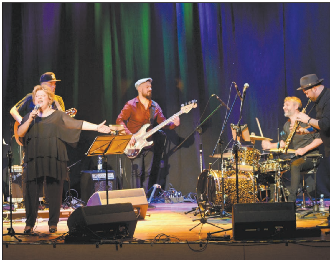
Koncert Lory Szafran zakończył realizację projektu Powiat Legionowski-Stolica Kultury Mazowsza 2017, ale mieszkańcy powiatu mogą liczyć na bogatą ofertę kulturalną na naszym terenie także w nadchodzącym roku

Za nami rok pełen wydarzeń kulturalnych, które na terenie powiatu zorganizowano pod szyldem „Powiat Legionowski – Stolica Kultury Mazowsza 2017”. Projekt podsumowano w trakcie uroczystej gali, której punktem kulminacyjnym był koncert Lory Szafran.