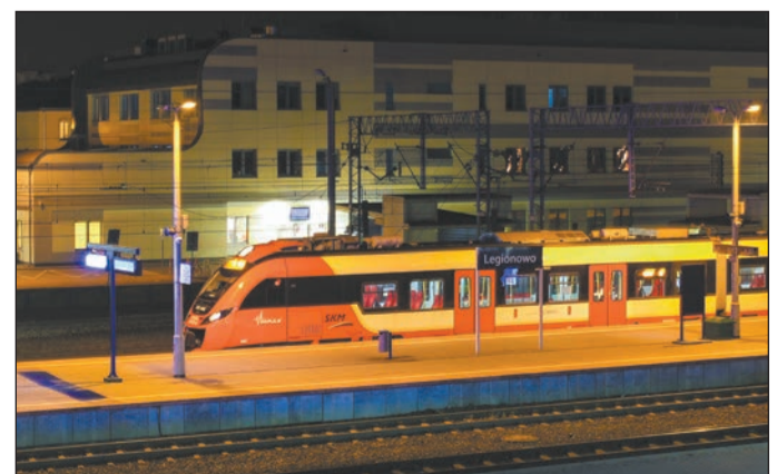
„Dworzec w Legionowie”