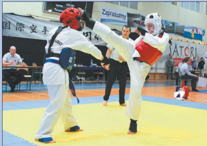
Kategoria „Kumite” jest najbardziej widowiskowa. Starują w niej najstarsi zawodnicy