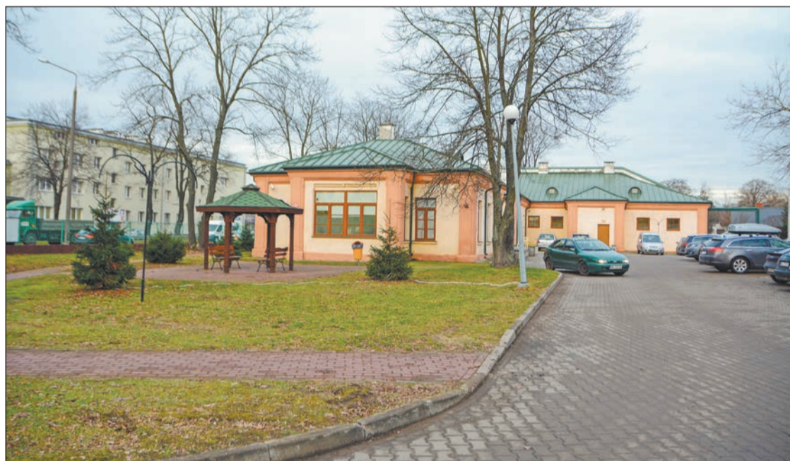
Szpital powstanie w sąsiedztwie Wojskowej Specjalistycznej Przychodni Lekarskiej w Legionowie

W Legionowie powstanie szpital. Ta wyczekiwana przez mieszkańców inwestycja ma zostać zrealizowana przez Ministerstwo Obrony Narodowej przy wsparciu lokalnych samorządów na terenie przyległym do wojskowej przychodni na Piaskach.