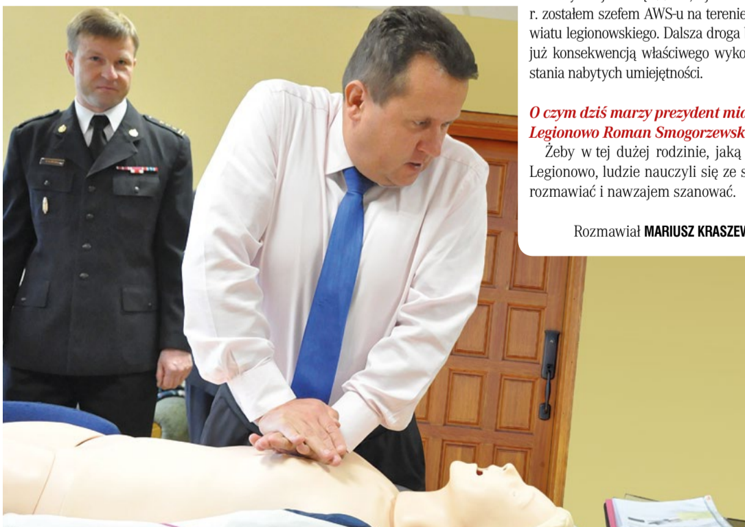
Przekazanie fantoma Państwowej Straży Pożarnej w Legionowie.