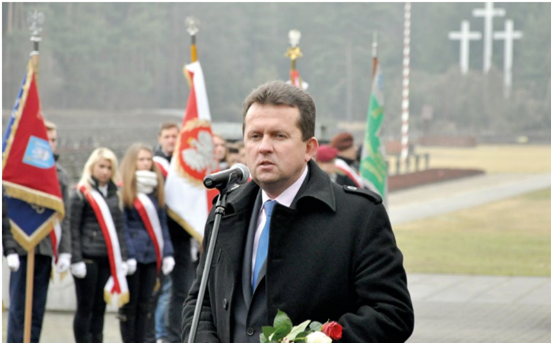
Obchody 75. rocznicy rozstrzelania mieszkańców Legionowa i okolic w Palmirach.

właśnie frekwencja w wyborach prezydenckich jest u nas największa.