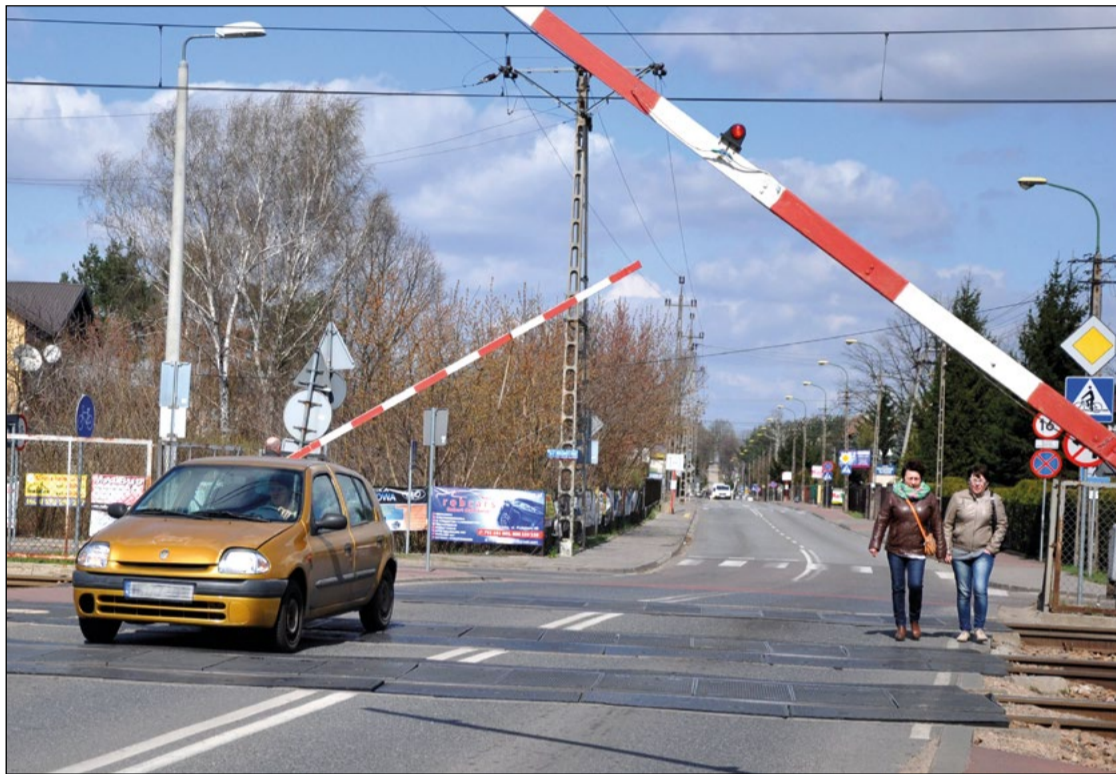
Warunkiem rozpoczęcia prac przy budowie kładki jest zamknięcie przejazdu i jego rozbiórka. Wciąż nie ma deklaracji Kolei, kiedy to nastąpi.

Przetarg na budowę kładki nad torami kolejowymi w ulicy Parkowej został rozstrzygnięty. Powiat jest gotowy do rozpoczęcia robót. Jednak kolej musi rozebrać przejazd.