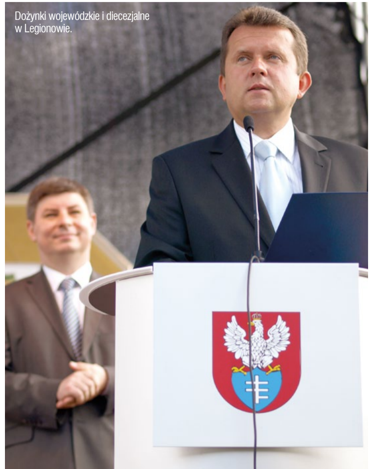
Dożynki wojewódzkie i diecezjalne w Legionowie.