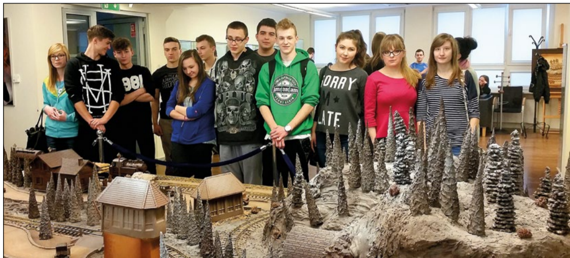
W galerii rzeźb z czekolady młodzież dowiedziała się jak wygląda praca cukierników przy tworzeniu tych „słodkich dzieł sztuki”.

klasy trzeciej Technikum Żywności i Usług Gastronomicznych oraz klasy czwartej Technikum Żywności i Gospodarstwa Domowego, było poznanie rodzajów maszyn, urządzeń i sprzętu w części magazynowej, produkcyjnej, ekspedycyjnej i handlowej zakładów gastronomicznych, ich zastosowania oraz produktów spożywczych z różnych grup, zwłaszcza warzyw i owoców egzotycznych. Była to doskonała okazja dla przyszłych techników żywności do zapoznania się z wyposażeniem technologicznym zaplecza gastronomicznego, a także szerokim asortymentem