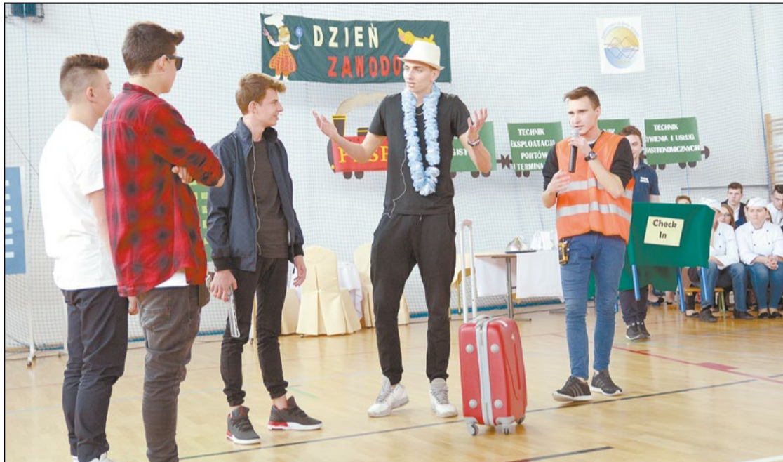
Skecze kabaretowe i pełne humoru scenki to sposób uczniów PZSP w Serocku, aby ciekawie zaprezentować szkołę i jej ofertę

Już wkrótce uczniowie ostatniej klasy gimnazjum staną przed trudnym wyborem dalszej ścieżki edukacji. Z pomocą w podjęciu właściwej decyzji przyszły dni otwarte, które zorganizowano w Powiatowym Zespole Szkół Ponadgimnazjalnych im. J. Sivińskiego w Legionowie (9-10.03) oraz III Dzień Zawodowca w Powiatowym Zespole Szkół Ponadgimnazjalnych im. W. Wolskiego w Serocku (16.03).