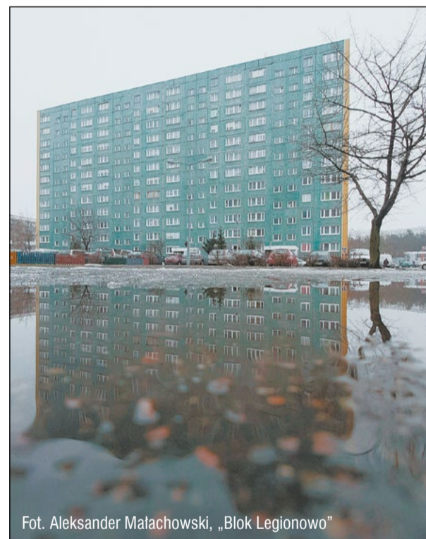
Fot. Aleksander Małachowski, „Blok Legionowo”

Konkurs trwać będzie przez cały rok. Zachęcamy do nadsyłania zdjęć budynków, współczesnych i zabytkowych oraz ciekawych wnętrz i konstrukcji znajdujących się na terenie naszego powiatu. Termin nadsyłania prac to ostatni dzień każdego miesiąca. Na laureatów czekają nagrody miesiąca w postaci zestawów upominków promocyjnych o wartości ponad 300 złotych. Autor zdjęcia, które otrzyma tytuł fotografii kwartału otrzyma tablet. Najciekawsze prace zostaną zaprezentowane w kalendarzu wieloplanowym Powiatu Legionowskiego na 2018 rok. Regulamin konkursu i karta zgłoszenia znajdują się na www.powiat-legionowski.pl . Dodatkowe informacje można uzyskać pod numerem telefonu 22 764 05 95. Organizatorem konkursu jest Powiat Legionowski. Serdecznie zapraszamy do udziału!