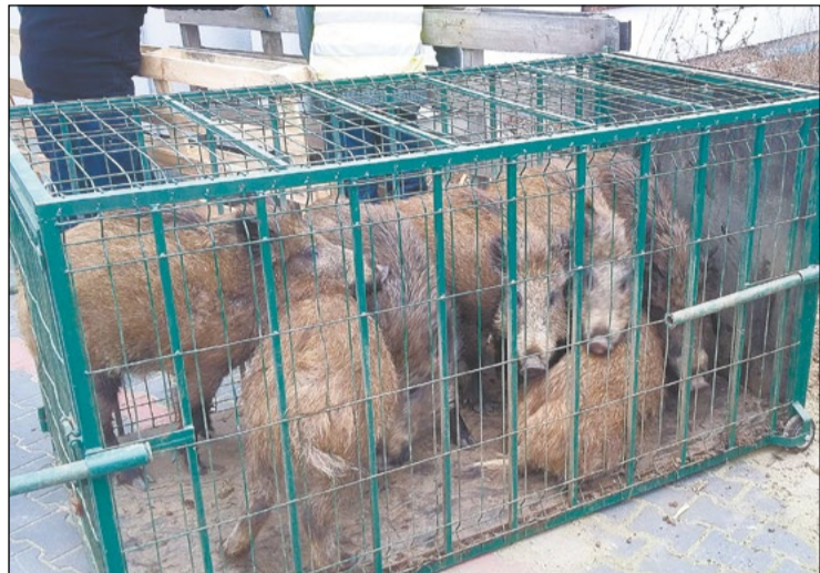
13 marca, na terenie legionowskiego Aviotexu z powiatowej odłowni „skorzystało” aż 7 dzików

Dwie powiatowe odłownie zostały wyposażone w system całodobowego monitoringu zachowania dzików pojawiających się w ich obrębie. Nowe metody znacznie usprawniły i zwiększyły skuteczność przenoszenia uporczywych zwierząt na tereny nie zamieszkałe przez ludzi.