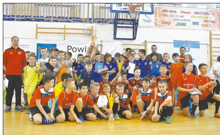
MK Finaliści dwóch roczników trzeciej edycji Piłkarskiej Ligi Powiatu Legionowskiego

Idea utworzenia PLPL zakłada umożliwienie gry każdemu dziecku, które trenuje piłkę nożną w ramach tego projektu. Składy drużyn są dobierane tak, aby wszyscy ich członkowie prezentowali podobny poziom wyszkolenia. Takie rozwiązanie powoduje, że nie dochodzi do sytuacji, w której ktoś notorycznie występuje w roli zawodnika rezerwowego.