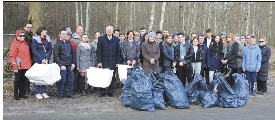
Z okazji nadejścia wiosny uczniowie PZSP w Legionowie postanowili nie topić Marzanny, a posprzątać okoliczny las. I to był świetny pomysł

Powiat podejmuje i wspiera wiele działań na rzecz ochrony środowiska, ale najbardziej cieszą te, które powstają oddolnie. Inicjatywa uczniów ze szkoły przy ul. Targowej nie tylko stanowi doskonały przykład połączenia edukacji z ekologią, ale przede wszystkim jest dowodem na to, że młodzi ludzie biorą na siebie odpowiedzialność za stan środowiska oraz chcą dbać o swoje otoczenie. Tak dojrzała postawa zasługuje na podziw i naśladowanie.