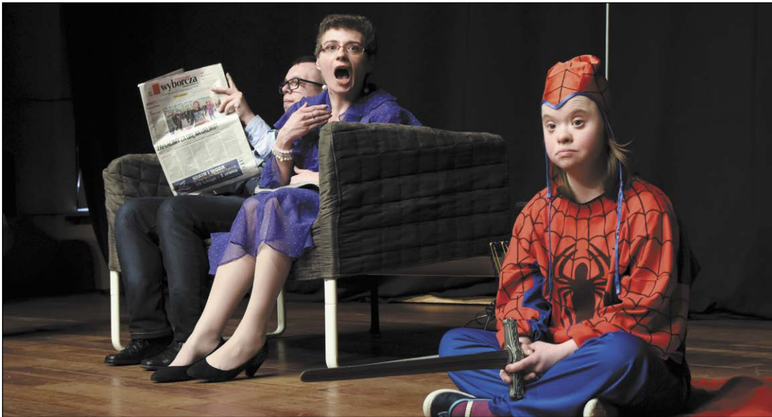
Wszyscy uczestnicy konkursów zostali dostrzeżeni i wyróżnieni. Najlepsi otrzymali nagrody. Na zdjęciu występ Teatru Wkręceniu