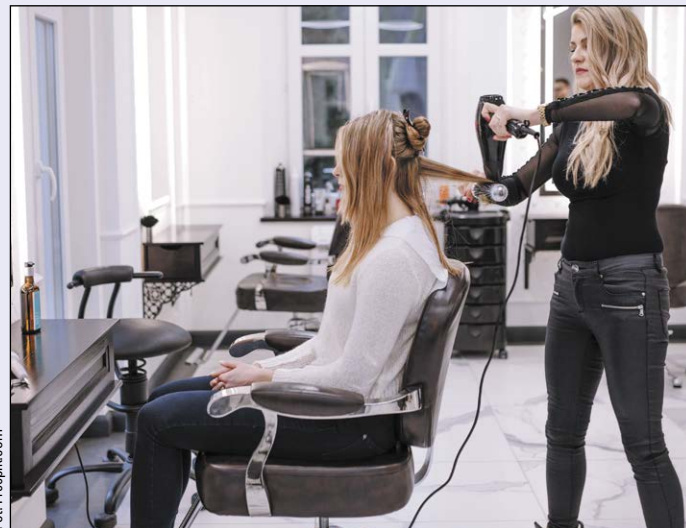
W kwietniu br. zostanie przeprowadzony uzupełniający nabór wniosków o przyznanie środków z Krajowego Funduszu Szkoleniowego. Środki te można przeznaczyć na szkolenia dla przedstawicieli zawodów deficytowych na terenie powiatu (np. fryzjerów i kosmetyczek)