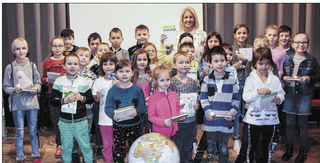
Misją Klubu Młodego Podróżnika jest wzbudzenie u dzieci zainteresowania światem, jego różnorodną kulturą, obyczajowością i bogactwem geograficznym