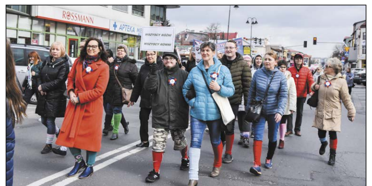
W legionowskim Pochodzie Kolorowej Skarpetki mieszkańcy zademonstrowali swoją solidarność z osobami z zespołem Downa

Cykl wydarzeń zorganizowanych z okazji Dnia Kobiet przy udziale Powiatowej Instytucji Kultury najlepiej pokazuje nową wizję działalności tej ważnej jednostki. Jestem przekonany, że szeroki wachlarz zaproponowanych wydarzeń - od wykładów poprzez koncerty i na projekcji filmu skończywszy - jak i ich rozmieszczenie na terenie powiatu, umożliwiły znacznie większemu gronu zainteresowanych skorzystanie z oferty kulturalnej powiatu.