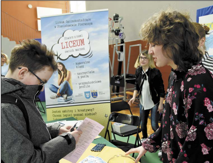
Na tegorocznej giełdzie szkół zadebiutowało Liceum Ogólnokształcące w Stanisławowie Pierwszym, które rozpocznie funkcjonowanie od września br.

Uczniowie ostatnich klas gimnazjum i szkoły podstawowej mają już coraz mniej czasu na wybór dalszej ścieżki edukacji. Z pomocą w podjęciu właściwej decyzji przysłała XIX Powiatowa Giełda Szkół Ponadgimnazjalnych, która odbyła się w Powiatowym Zespole Szkół Ogólnokształcących w Legionowie.