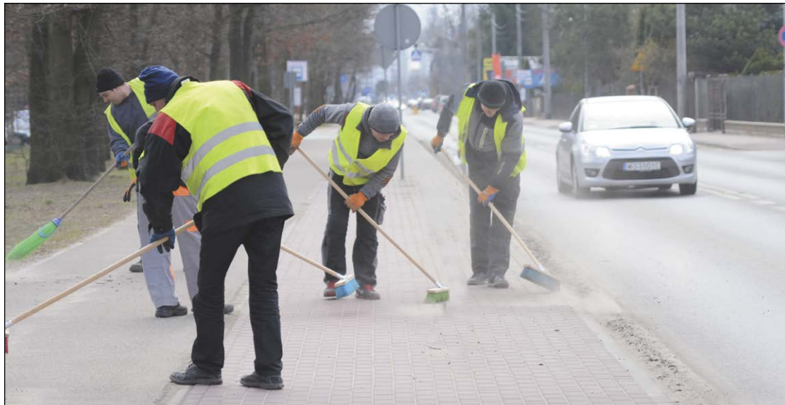
Zima odeszła, ale jej skutki na drogach widać gołym okiem. Dlatego jezdnie i ciągi pieszo-rowerowe systematycznie czyszczone są z zalegającego brudu, a dziury łatanie

Powiat zobowiązany jest do zapewnienia odpowiedniego stanu nawierzchni zarządzanych przez siebie dróg i chodników oraz utrzymania przyległej do nich zieleni. Dba również o prawidłowe ich odwodnienie i oznakowanie zarówno pionowe, jak i poziome. W tegorocznym budżecie zaplanowano odpowiednie środki na realizację tych zadań.