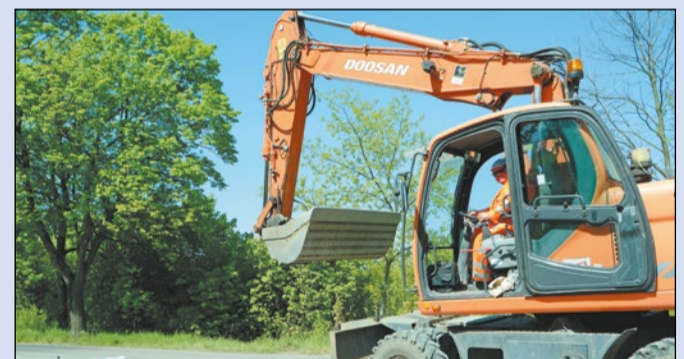
Wykonawca został wprowadzony na teren budowy. Trwają prace przygotowawcze

Na początku sierpnia 2017 r. Powiat Legionowski odda do użytku przebudowywany ponad 1300-metrowy odcinek drogi 1803W z Dosina do Woli Kiełpińskiej. Inwestycja jest kontynuacją wykonanego w ubiegłym roku remontu jezdni i pobocza w Woli Kiełpińskiej.