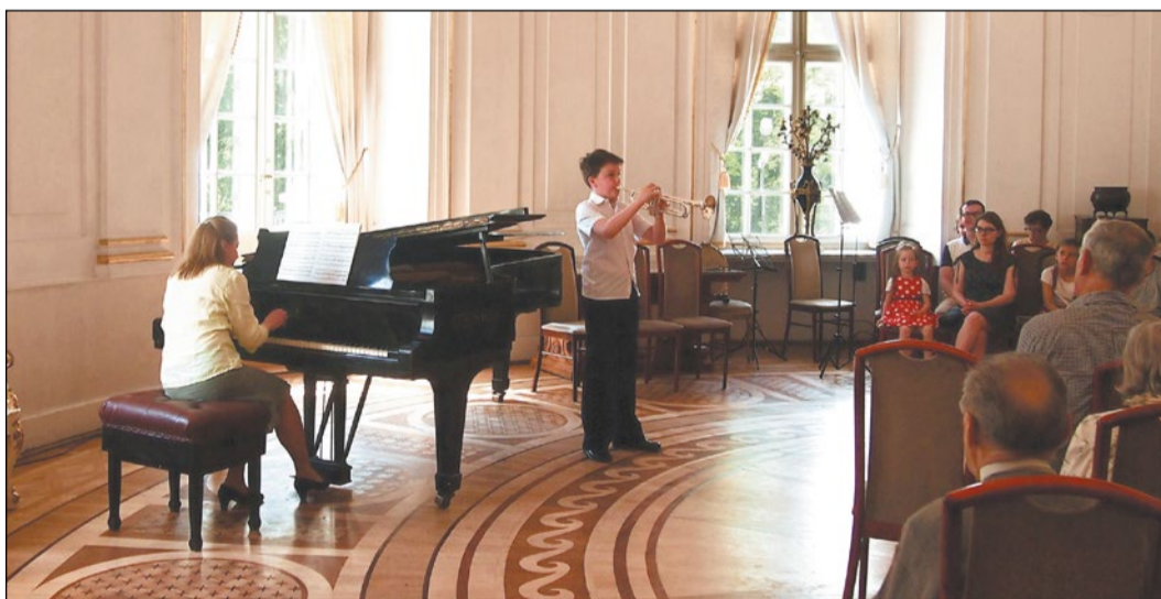
Fot. Pałac w Jabłonie

Utwory kilkunastu znakomitych kompozytorów znalazły się w programie 150. koncertu z cyklu „Pałacowe spotkania z muzyką”. Tym razem w muzyczną podróż publiczność zabrali młodzi artyści.