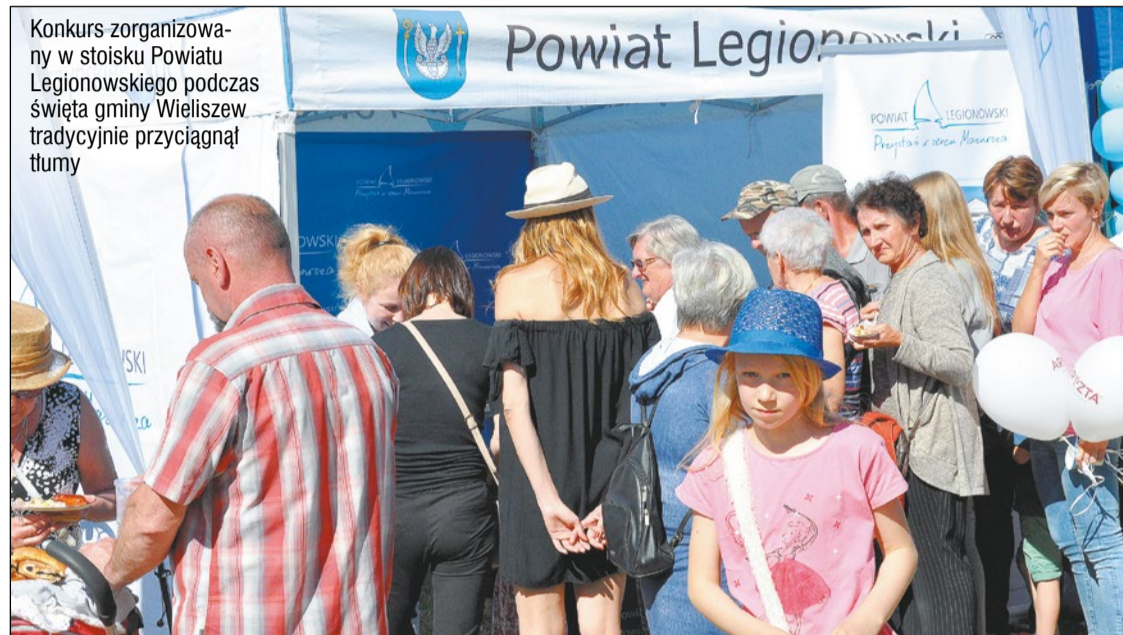
Konkurs zorganizowany w stoisku Powiatu Legionowskiego podczas święta gminy Wieliszew tradycyjnie przyciągnął tłumy

Czerwiec w kalendarzu powiatu legionowskiego to święta gmin, pikniki z okazji Dnia Dziecka i inne imprezy plenerowe. Mieszkańcy mieli już okazję bawić się m.in. w Serocku na Wojciechowym Świętowaniu, które w tym roku było wyjątkowe, bo związane z rocznicą 600-lecia nadania miastu praw miejskich, podczas świąt gmin Wieliszew i Nieporęt oraz XXXVIII Dni Legionowa.