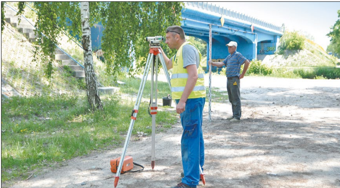
Wykonawca rozpoczął prace od wytyczenia wykopu pod skarpią, która zostanie umocniona

Powiat Legionowski rozpoczął w Izabelinie budowę nowych schodów oraz odcinka ciągu pieszo-jezdnego biegnącego równoległe do powiatowej 1815W. Inwestycja zostanie oddana do użytku już w połowie września 2017 r.