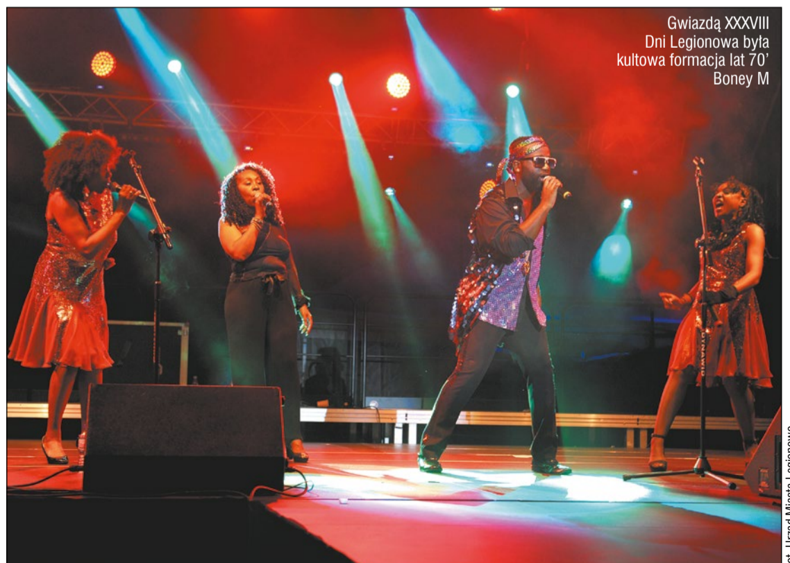
Gwiazdą XXXVIII Dni Legionowa była kulturowa formacja lat 70' Boney M

Dzieciaki miały wspaniałą zabawę. Organizatorzy nie zapomnieli też o atrakcjach dla dorosłych mieszkańców. W trakcie takich imprez, odwiedzając stoiska, od razu można dowiedzieć się, co dzieje się w powiecie. Wieczorny koncert zagranicznej gwiazdy to strzał w dziesiątkę.