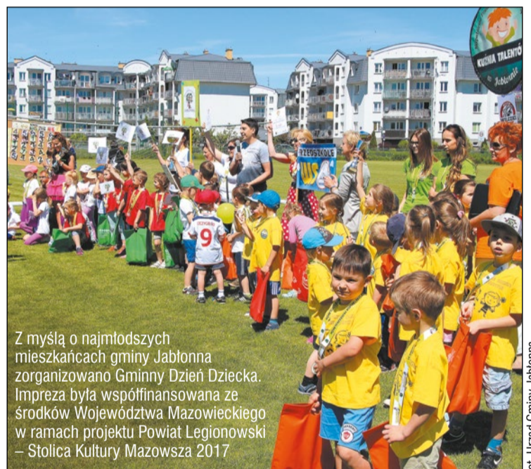
Z myślą o najmłodszych mieszkańcach gminy Jabłonna zorganizowano Gminny Dzień Dziecka. Impreza była współfinansowana ze środków Województwa Mazowieckiego w ramach projektu Powiat Legionowski – Stolica Kultury Mazowsza 2017