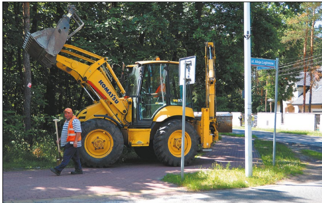
Wykonawca rozpoczął prace od robót ziemnych oraz wytyczenia poszerzenia przestrzeni pod budowę ronda

Wystartowała jedna z najbardziej oczekiwanych powiatowych inwestycji – 20 czerwca Powiat Legionowski wprowadził wykonawcę na budowę ronda przy skrzyżowaniu Al. Róż i Al. Legionów w Legionowie. Do końca sierpnia prace zostaną zrealizowane a czas korków w okolicy tunelu – zakończony.