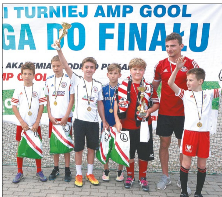
Młodzi reprezentanci Stanisławowa Pierwszego z roczników 2004/2005/2006 triumfowali w swojej kategorii wiekowej. Będą reprezentowali gminę i powiat w wielkim finale