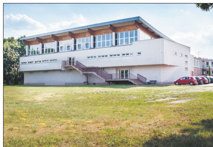
Już wkrótce w tym miejscu powstanie nowoczesne boisko sportowe

wypychacz i twister. Zaplanowano również montaż elementów tzw. małej architektury. Roweryści będą mogli korzystać z dwóch 6-stanowiskowych stojaków na rowery. Zainstalowane zostanie 6 ławek wolnostojących o profilach stalowych oraz 4 kosze na śmieci. Cały teren będzie oświetlony za pomocą energooszczędnej instalacji. Boisko zabezpieczy estetyczne ogrodzenie. Zaprojektowany został także dojazd z betonowej kostki brukowej o grubości 8 cm koloru szarego. Chodniki będą wybudowane z betonowej kostki