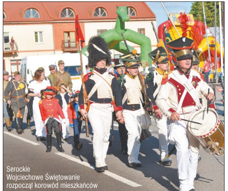
Serockie Wojciechowe Świętowanie rozpoczął korowód mieszkańców