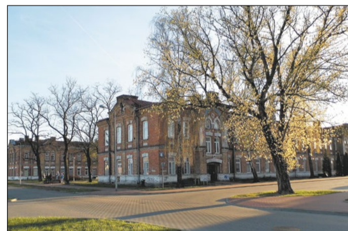
Zdjęcie miesiąca: „Stare budynki przy kolei Legionowo”

Znamy już kolejnego laureata konkursu fotograficznego „Architektura powiatu legionowskiego w obiektywie”. „Stare budynki przy kolei Legionowo” autorstwa Konrada Radzyńskiego zostało zdjęciem miesiąca w maju.