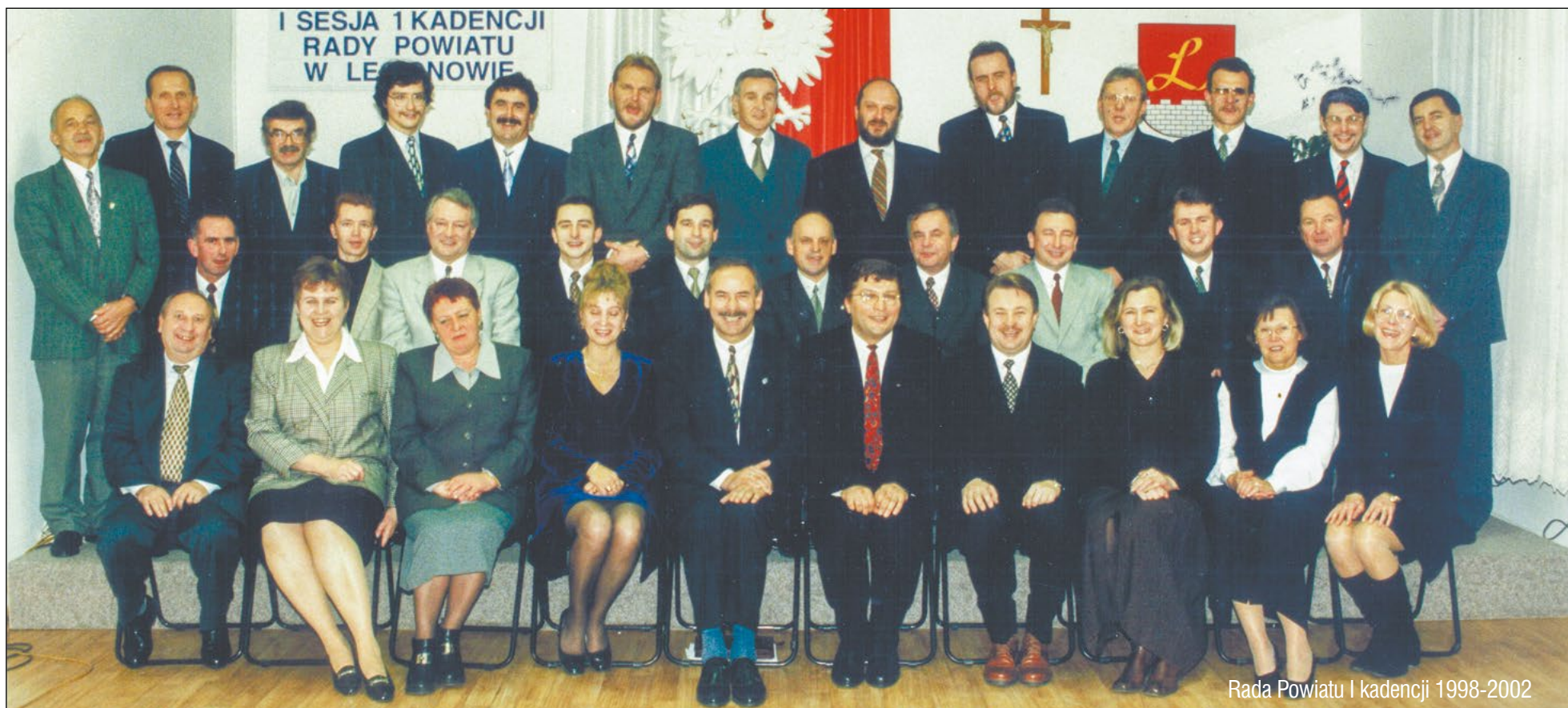
Rada Powiatu I kadencji 1998-2002