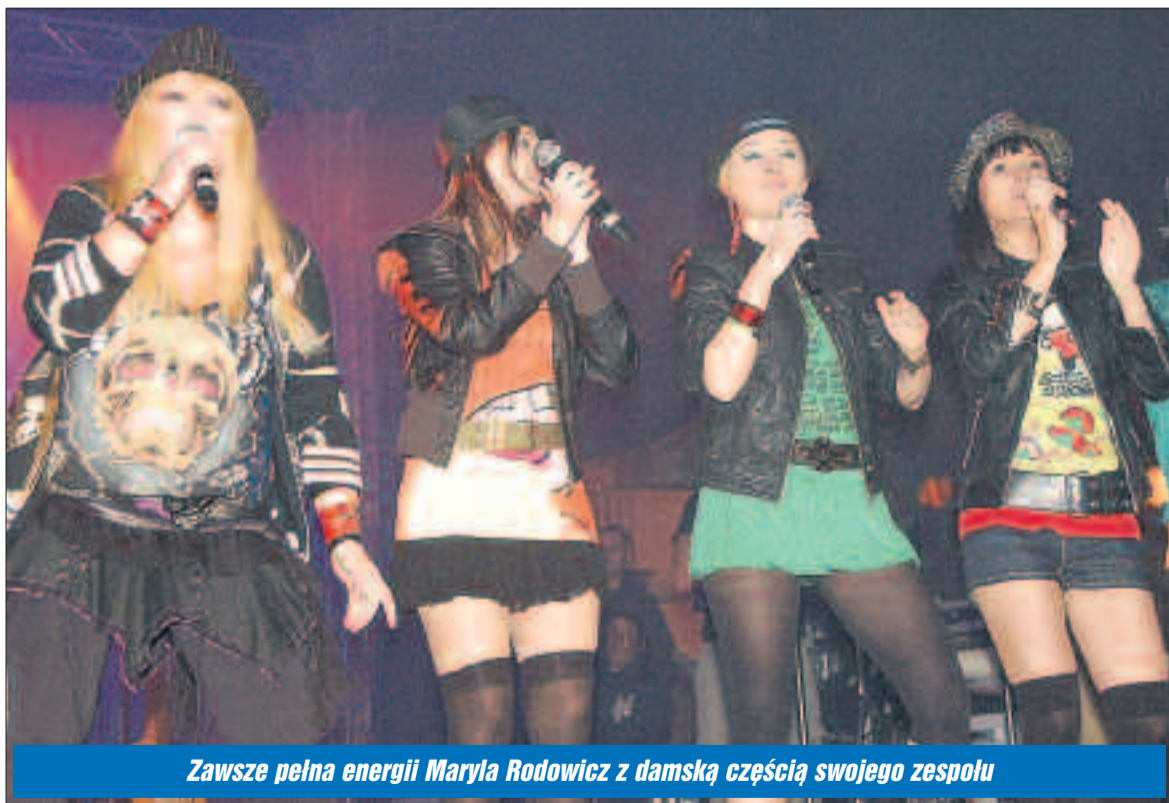
Zawsze pełna energii Maryla Rodowicz z damską częścią swojego zespołu

Niezmiernie udane popołudnie i wieczór na rynku – tak można w skrócie określić majowe uroczystości święta patrona Serocka.