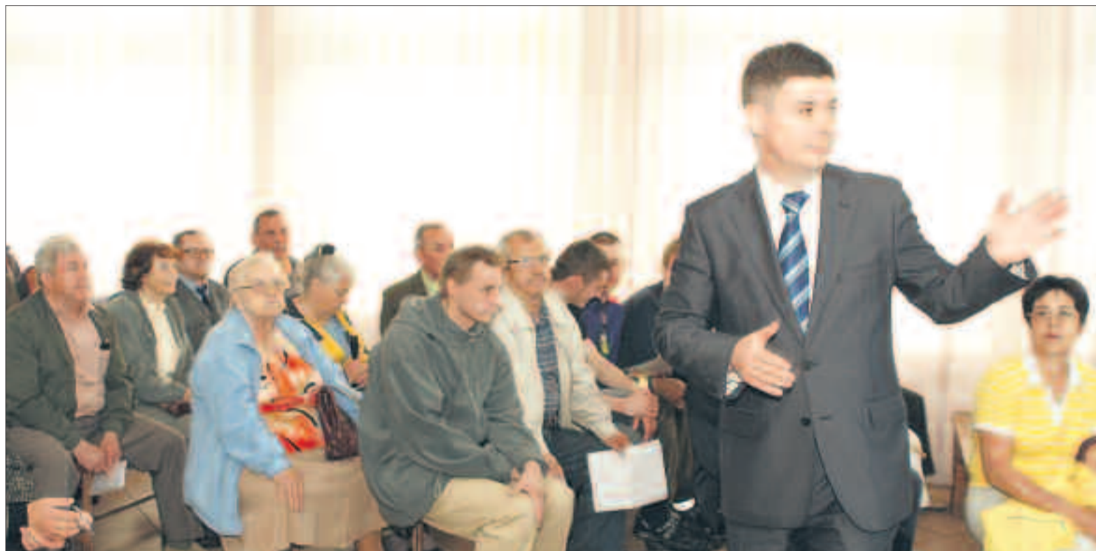
Projekt przebudowy ulicy Sobieskiego zaprezentował Starosta Legionowski Jan Grabiec

Ulica Sobieskiego i dokończenie jej przebudowy było tematem spotkania konsultacyjnego, które zorganizował dla mieszkańców starosta Jan Grabiec.