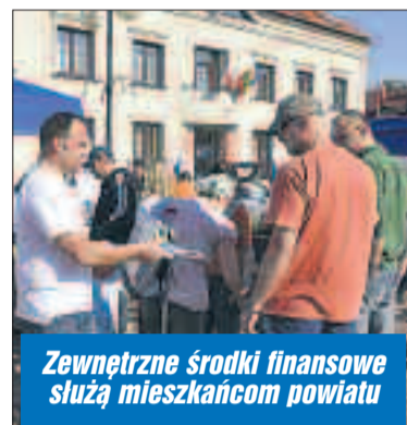
Zewnętrzne środki finansowe służą mieszkańcom powiatu

2 700 000 zł z budżetu państwa (rezerva subwencji ogólnej m.in. na inwestycje na drogach publicz-