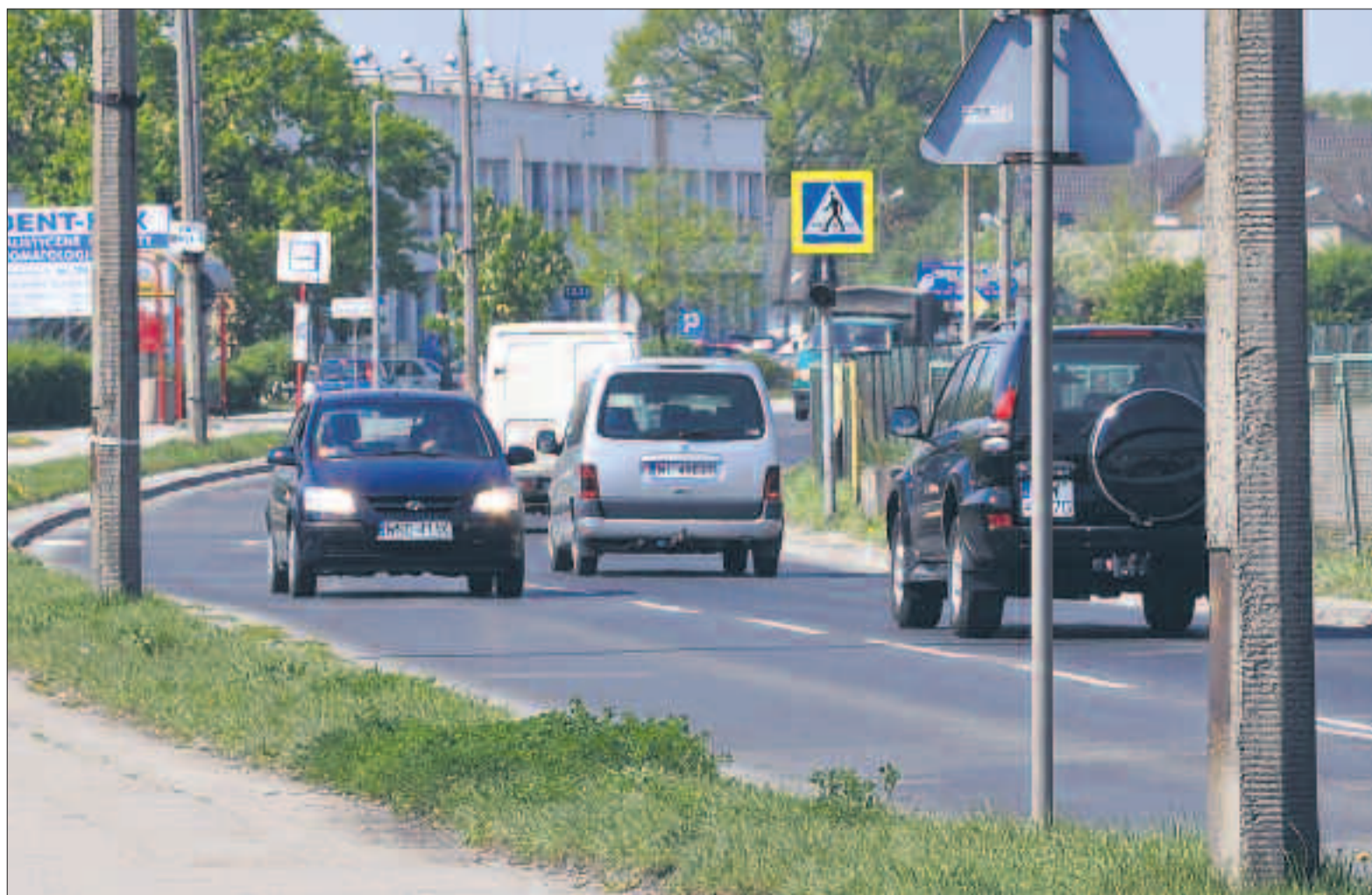
Już wkrótce ulica zostanie zmodernizowana