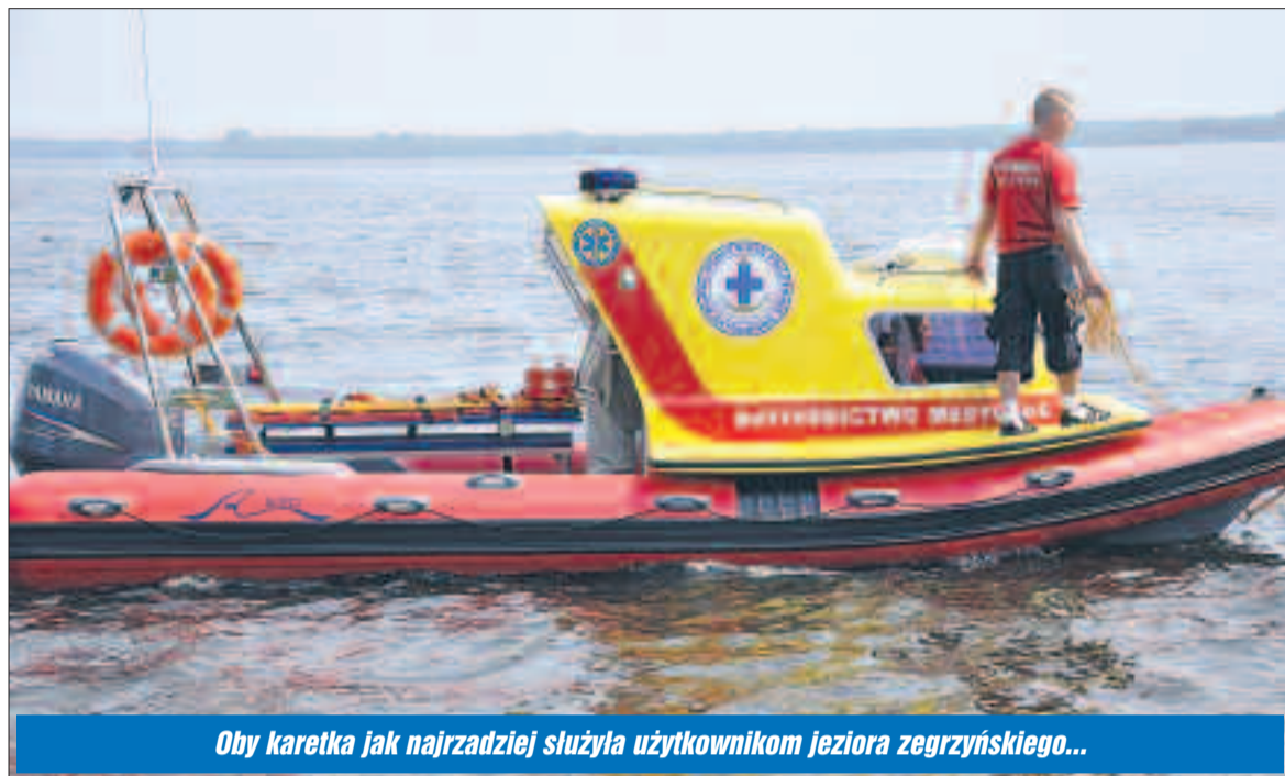
Oby karetka jak najrzadziej służyła użytkownikom jeziora zegrzyńskiego...