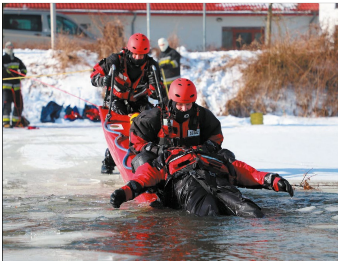
Służby odpowiedzialne za bezpieczeństwo na terenie powiatu stale podnoszą swoje kwalifikacje. Na zdjęciu tegoroczne ćwiczenia z ratownictwa lodowego

Podczas lutowej sesji Rady Powiatu Komenda Powiatowa Policji w Legionowie, Komenda Powiatowa Państwowej Straży Pożarnej w Legionowie, jednostki Ochotniczych Straży Pożarnych na naszym terenie oraz Legionowskie Wodne Ochotnicze Pogotowie Ratunkowe złożyły sprawozdania ze swojej działalności za ubiegły rok.