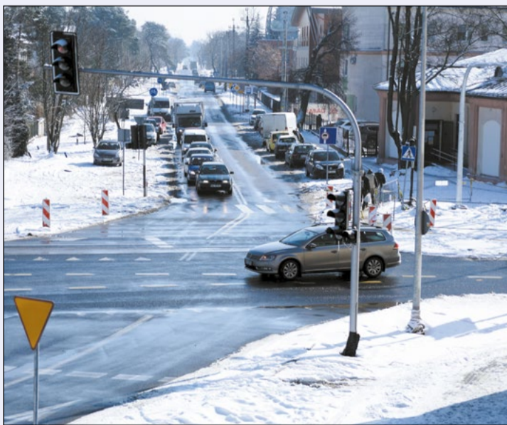
Przebudowa, której inwestorem jest Generalna Dyrekcja Dróg Krajowych i Autostrad, jest jedną z najbardziej oczekiwanych inwestycji na terenie powiatu. W najbliższym czasie wykonawca rozpocznie prace na ul. Strużańskiej

Zakończenie prac zaplanowano na koniec maja. AMZ