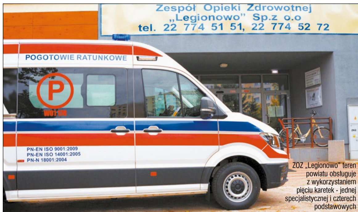
ZOZ „Legionowo” teren powiatu obsługuje z wykorzystaniem pięciu karetek - jednej specjalistycznej i czterech podstawowych

Zakład Opieki Zdrowotnej „Legionowo” ponownie wygrał konkurs i dalej będzie wykonywał świadczenia zdrowotne w zakresie ratownictwa medycznego na obszarach działania Legionowo, Jabłonna, Zegrze, Serock.