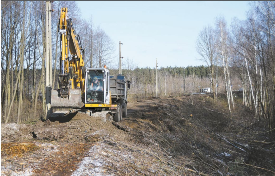
Rewitalizacja połączenia kolejowego z Wieliszewa do Zegrza Południowego z etapu projektu przenosi się w teren. Widać już pierwsze efekty trwających na budowie prac

Rozpoczęły się pierwsze prace w terenie związane z rewitalizacją połączenia kolejowego nr 28 z Wieliszewa do Zegrza Południowego.