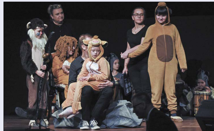
Finale DON 2019 był pełen emocji i wzruszeń. Już wiosną, po raz dziewiąty, zainaugurowane zostaną wydarzenia integrujące osoby niepełnosprawne, ich rodziny, znajomych oraz całą lokalną społeczność

Uroczyste zakończenie VIII Dni Osób Niepełnosprawnych Miasta Legionowo i Powiatu Legionowskiego nastąpiło 22 listopada w sali widowiskowej legionowskiego ratusza. Podczas uroczystości podsumowano także doroczną akcję poświęconą Alternatywnym i Wspomagającym Metodą Komunikacji (AAC).