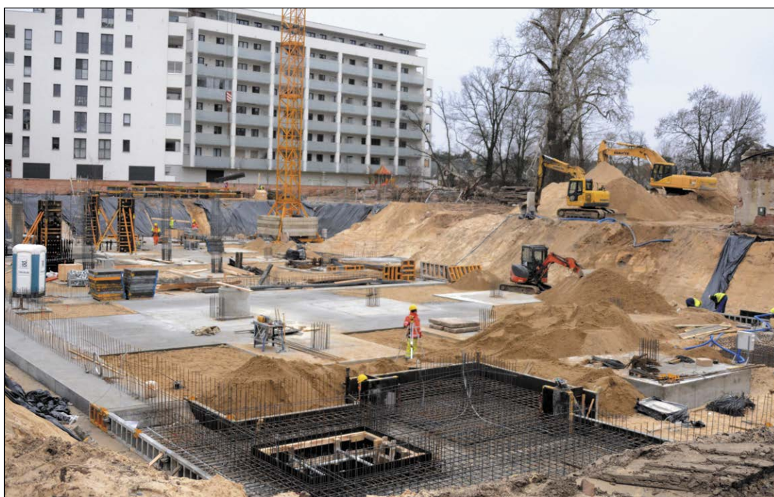
Wykonawca robót nie zwalnia tempa, prace związane z budową szpitala w Legionowie przebiegają bez zakłóceń