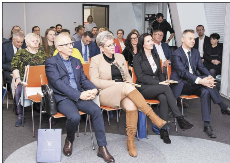
Forum jest odpowiedzią na potrzebę integracji środowiska przedsiębiorców i wzmocnienia ich roli w procesach gospodarczych powiatu