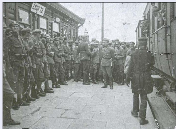
Wyjazd Legionistów ze stacji Zegrze do Szczypioma, 1917 r.