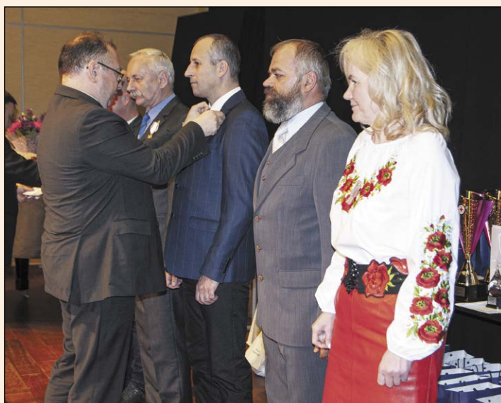
Najbardziej zasłużeni krwiodawcy z terenu powiatu zostali wyróżnieni podczas gali z okazji Dni Honorowego Krwiodawstwa

Listopad upłynął pod znakiem wydarzeń związanych z honorowym krwiodawstwem oraz obchodami setnej rocznicy powstania Polskiego Czerwonego Krzyża.