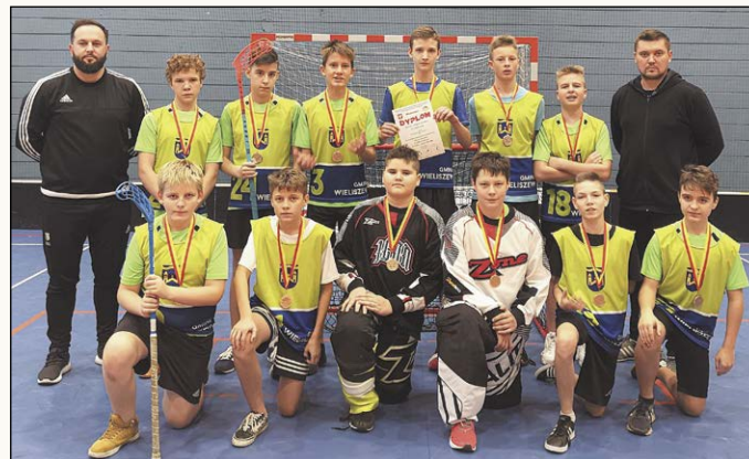
Szkoła Podstawowa w Łąjskach inwestuje w rozwój unihokeja. W tym roku zorganizowała turniej MIMS, w którym wzięło udział ponad 270 uczniów