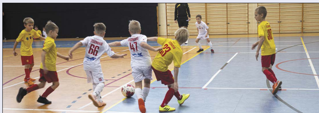
Piłkarska Liga Powiatu Legionowskiego daje możliwość rywalizowania na każdym poziomie zaawansowania. Odnajdują się w niej zarówno ci, którzy z futbolem wiążą przyszłość, jak i dzieci traktujące piłkę nożną rekreacyjnie