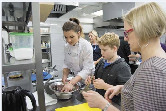
Warsztaty „Jesteś tym, co jesz” to doskonała okazja dla dzieci i rodziców do wspólnego gotowania i jednocześnie świetna zabawa