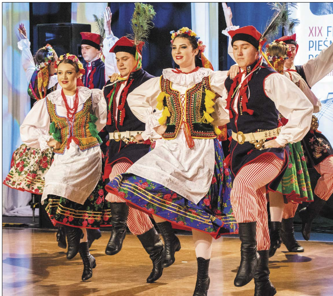
Festiwal jest co roku okazją do prezentacji tych elementów narodowej tożsamości, z których jesteśmy niepodważalnie i niepodzielnie dumni

W przeddzień obchodów Święta Niepodległości organizatorzy i uczestnicy XIX Festiwalu Pieśni i Tańców Polskich przypomnieli wszystkim zgromadzonym o rodzimej spuściznie kulturowej, prezentując tańce i pieśni ludowe z poszczególnych regionów etnograficznych kraju. Powiat Legionowski był współorganizatorem wydarzenia.