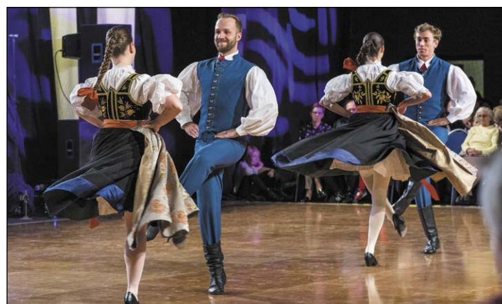
Festiwal to także piękne i kolorowe widowisko

Po raz drugi w historii Festiwalu zaprosiliśmy grupę polonijną – po litewskiej „Perle” z Wileńszczyzny przed dwoma laty, tym razem sięgnęliśmy spuścizny Polaków zamieszkujących czeskie Zaolzie, goszcząc Zespół Pieśni i Tańca „Olza”, w którego szeregach tańczy ponad 30 młodych mieszkańców Czeskiego Cieszyna i okolic. Festiwal stał się wieliszewską specjalnością i oryginalnym wkładem w świętowanie niepodległości, przypominając o roli jaką w kształtowaniu się polskiej świadomości narodowej pełniła ludowa kultura i dziedzictwo. Dziękuję za możliwość organizacji tak efektownego i ważnego dla lokalnej społeczności wydarzenia jego współorganizatorom: Gminie Wieliszew, Samorządowi Województwa Mazowieckiego, Powiatowi Legionowskiemu oraz Ministrowi Kultury i Dziedzictwa Narodowego, z którego środków dofinansowano zadanie.