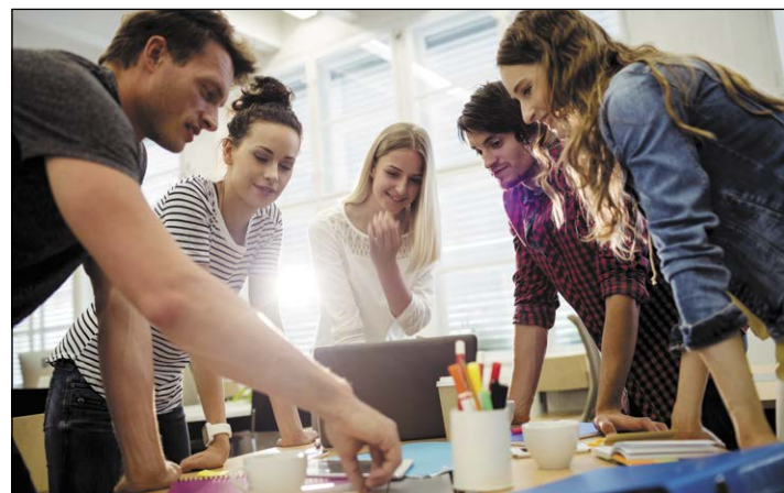
Uczestnicy projektu „Start w samodzielność” mogą liczyć na wszechstronne wsparcie

Realizacja projektu zaplanowana została na trzy lata. Całkowita jego wartość to ponad milion złotych. 80% tej kwoty pokryje dofinansowanie z Unii Europejskiej, a pozostałe ponad 200 tys. zł to wkład własny Powiatu Legionowskiego.