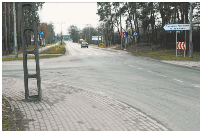
Skrzyżowanie ulic Suwalnej i Szarych Szeregów – tu powstanie sygnalizacja świetlna i dodatkowe pasy do skrętu

Kolejnym działaniem będzie przebudowa skrzyżowania ul. Suwalnej z ul. Szarych Szeregów, na granicy gmin Legionowo i Wieliszew. W tym miejscu za 5 mln zł powstanie