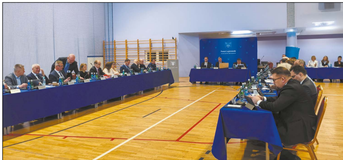
Największe wydatki w tegorocznym budżecie Powiatu Legionowskiego zaplanowano w kluczowych obszarach działalności, czyli edukacji i oświacie oraz inwestycjach. Radni podjęli uchwałę budżetową bez głosów przeciwnych

kolejności inwestycji rozpoczętych, w tym zadań, na które Powiat otrzyma dofinansowanie zewnętrzne, oraz realizację kluczowych, niezbędnych inwestycji drogowych na terenie gmin powiatu legionowskiego.