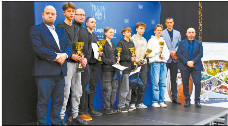
Najlepsi uczestnicy projektu zostali nagrodzeni

Popularyzacja strzelectwa i upowszechnienie postaw probronnych to najważniejsze cele zakończonego właśnie zadania, którego uczestnikami byli uczniowie szkół ponadpodstawowych. Konferencję podsumowującą zorganizowano 16 grudnia ub. r. w legionowskiej Poczycalni.