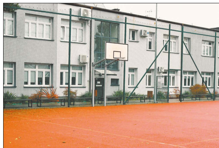
Powiatowy Zespół Szkół Ponadpodstawowych im. J. Siwińskiego w Legionowie zostanie rozbudowany

Powiat Legionowski konsekwentnie buduje swoją przyszłość. Tegoroczne inwestycje to przykład odpowiedzialnego planowania, w którym rozwój infrastruktury idzie w parze z myśleniem o jakości usług publicznych i komforcie mieszkańców. Będziemy działać kompleksowo – od administracji, przez kulturę i edukację, po bezpieczeństwo w przestrzeni publicznej i drogowe – znając lokalne potrzeby i łącząc różne obszary dla spójnej strategii rozwoju. Nasz samorząd nie ogranicza się do doraźnych działań, lecz realizuje projekty, które będą służyć mieszkańcom przez wiele lat. Jestem przekonany, że efekty tych decyzji będą odczuwalne w codziennym życiu mieszkańców i staną się solidnym fundamentem dla wzmocnienia potencjału powiatu.