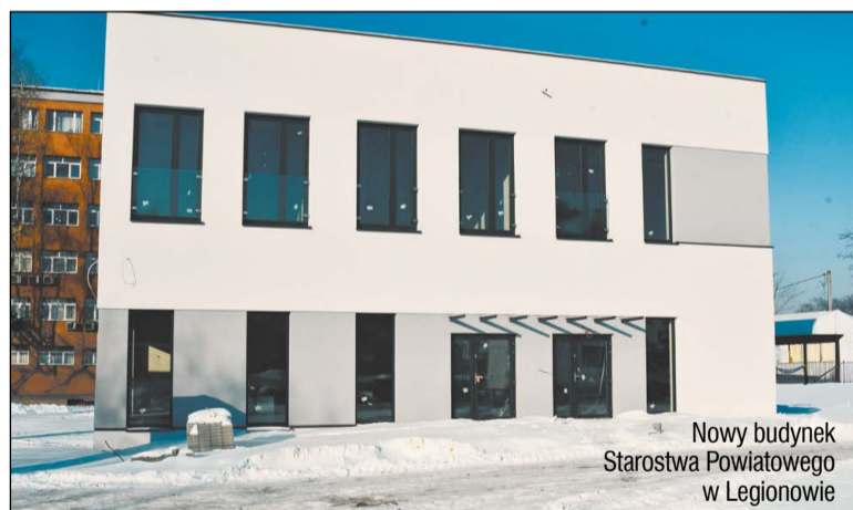
Nowy budynek Starostwa Powiatowego w Legionowie