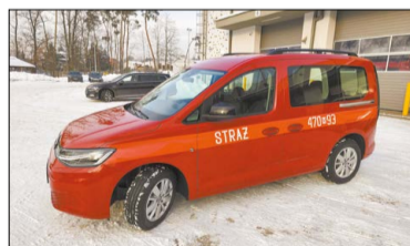
W ramach projektu zakupiono samochód dla Państwowej Straży Pożarnej w Legionowie

Istotnym elementem projektu była także organizacja specjalistycznego szkolenia z zakresu ochrony ludności i obrony cywilnej, przeprowadzonego zgodnie z obowiązującymi przepisami. W szkoleniu wzięło udział 60 osób wykonujących zadania związane z ochroną ludności i obroną cywilną na terenie powiatu legionowskiego, w tym