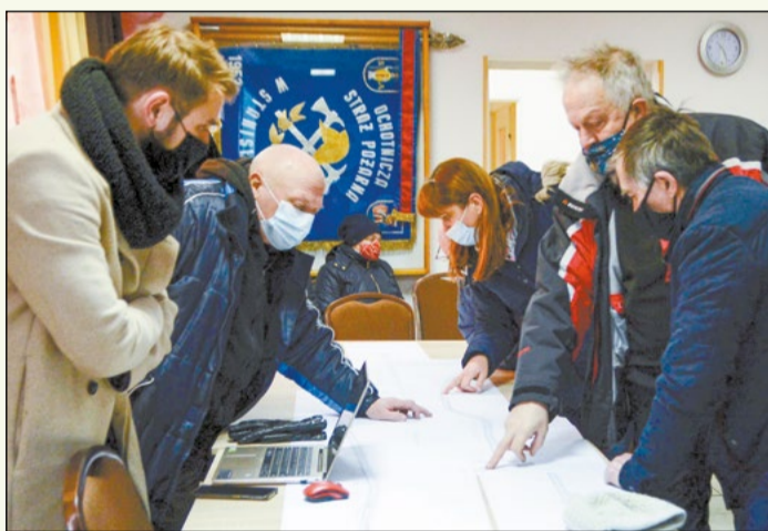
Spotkanie konsultacyjne było okazją do zapoznania się z planami przebudowy i poznania potrzeb oraz oczekiwań mieszkańców, dotyczących przebudowy drogi nr 1801W w Stanisławowie

Na liście zadań, które otrzymały dofinansowanie, znalazła się wnioskowana przez Powiat inwestycja dotycząca rozbudowy drogi powiatowej nr 1801W w gminie Serock – od drogi wojewódzkiej nr 632 do drogi wojewódzkiej nr 622. Zadanie obejmuje rozbudowę nawierzchni drogi do parametrów drogi klasy Z i kategorii ruchu KR2, budowę jednostronnego chodnika o szerokości 2 m na długości 2532 m w terenie zabudowanym,