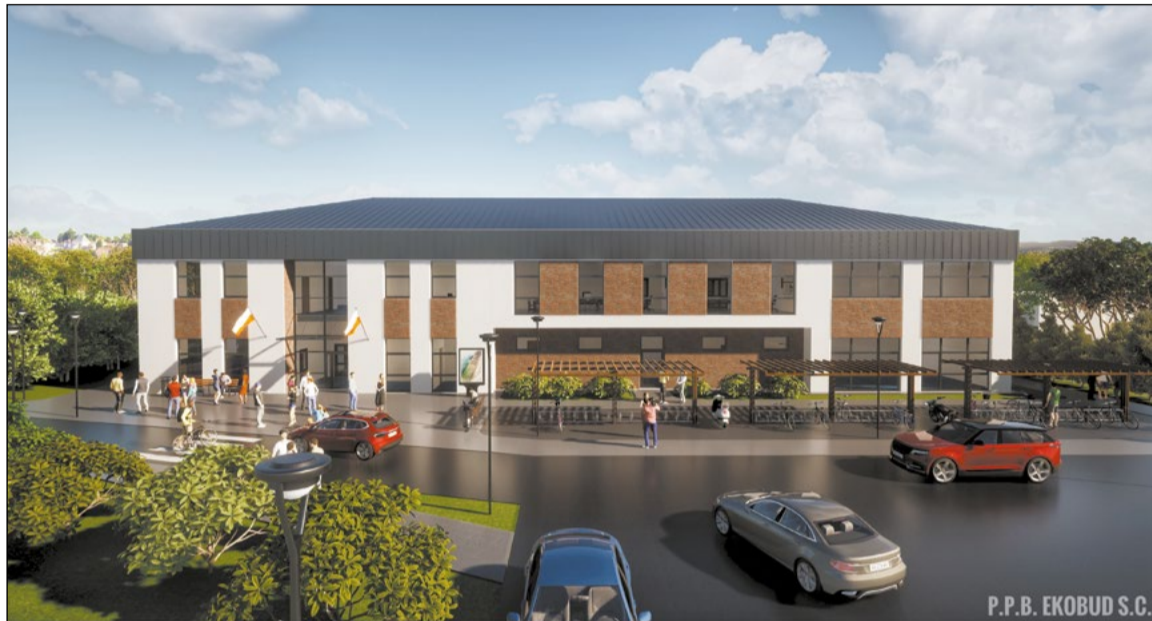
Prawie milion złotych zostanie w tym roku przeznaczony na rozpoczęcie budowy siedziby dla Liceum Ogólnokształcącego w Stanisławowie Pierwszym

Projekty nowych i realizacja już zaplanowanych inwestycji to zadania, których Powiat Legionowski podejmie się w roku 2021. Będą to zarówno przedsięwzięcia drogowe, jak i kubaturowe z przeznaczeniem na działalność oświatową i kulturalną.