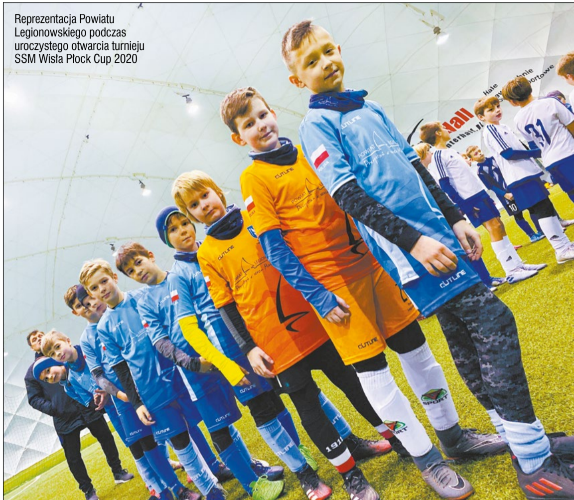
Reprezentacja Powiatu Legionowskiego podczas uroczystego otwarcia turnieju SSM Wisła Płock Cup 2020

Nasi piłkarze z rocznika 2010 przywieźli srebrne medale wywalczone w silnie obsadzonym turnieju SSM Wisła Płock Cup 2020. Wszyscy młodzi reprezentanci Powiatu Legionowskiego szlifują formę przed sezonem wiosenno-letnim.