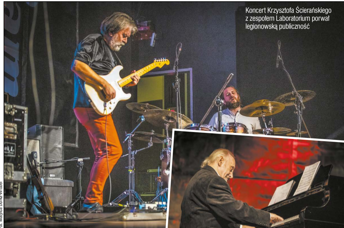
Fot. Małyda Durka-Wróbel