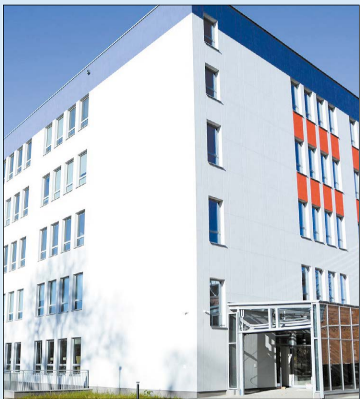
Szpital w Legionowie przejął od 1 listopada udzielanie pomocy w ramach nocnej i świątecznej opieki zdrowotnej

Od 1 listopada nocną i świąteczną opiekę zdrowotną świadczy Poradnia NiSOZ Wojskowego Instytutu Medycznego przy ul. Zegrzyńskiej 8 w Legionowie.