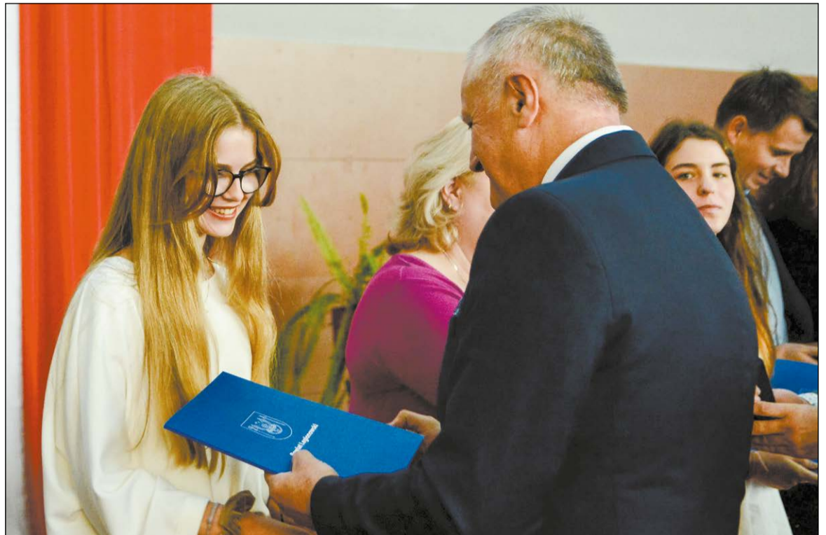
Nagrody starosty legionowskiego dla najlepszych uczniów to uznanie wysiłku włożonego w naukę i zachęta do dalszych starań

Jak co roku, wraz ze Starostą, miałem zaszczyt wręczać nagrody dla najzdolniejszych uczniów ze szkół, dla których organem prowadzącym jest Powiat Legionowski. Jako Powiat dostrzegamy osiągnięcia naszych szczególnie uzdolnionych uczniów i jesteśmy za nie wdzięczni. Wręczając nagrody starosty, motywujemy młodych ludzi do dalszej pracy. Oprócz tego widzimy także rolę rodziców, gdyż bez ich wsparcia tak wysokie wyniki byłyby trudne do zdobycia. Wszystkim nagrodzonym składam serdeczne gratulacje.