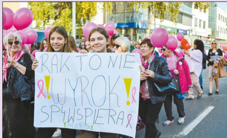
Marsz Różowej Wstążki jest gestem solidarności ze zmagającymi się z rakiem piersi oraz zachętą do regularnej profilaktyki

Mieszkańcy mieli okazję zadbać o zdrowie, wykonując badania profilaktyczne oraz uczestnicząc w wykładach i warsztatach podczas zorganizowanego 17 października w Legionowie Dnia Promocji Zdrowia. Powiat Legionowski przyłączył się do akcji.