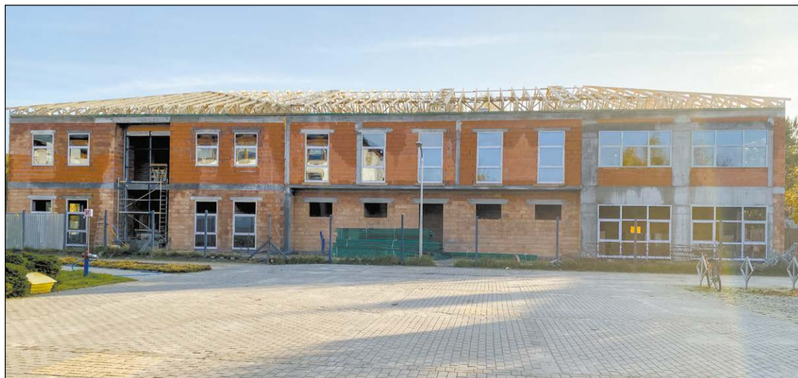
Tak obecnie prezentuje się budynek liceum w Stanisławowie Pierwszym

Współpraca Powiatu Legionowskiego i Gminy Nieporęt związana z realizacją budowy siedziby dla liceum w Stanisławowie Pierwszym układa się doskonale. Na początku procesu inwestycyjnego Gmina Nieporęt przekazała grunt pod budowę szkoły średniej i udzieliła gościny licealistom w budynku Szkoły Podstawowej w Stanisławowie Pierwszym. Powiat otrzymał już też dotację od Gminy na budowę liceum w wysokości pół miliona złotych. Cieszymy się, że budowa postępuje zgodnie z harmonogramem i że Gmina Nieporęt ma w niej swój udział.