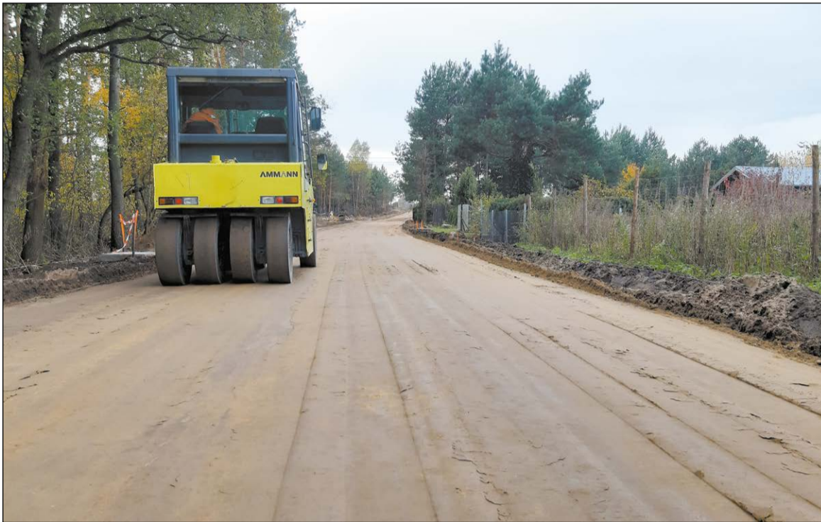
Prace przebiegają zgodnie z harmonogramem. Ich zakończenie zaplanowano na koniec roku

W połowie września wystartowały roboty na drodze powiatowej nr 1801W w gminie Serock na odcinku Stanisławowo – Zabłocie. Zgodnie z kontraktem wykonawca ma cztery miesiące, aby je zakończyć.