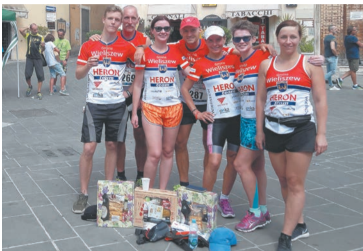
Zawodnicy Wieliszew Heron Team we włoskim Orte pobiegli na dystansie 13 km

Barwy Wieliszew Heron Team reprezentuję od momentu powstania sekcji kolarskiej i biegowej w ramach stowarzyszenia, czyli od 2012 roku. Jest to super sekcja i są tam fajni ludzie. Kolarstwo MTB uprawiam amatorsko, a czasem półamatorsko, od ponad 10 lat. Jeżdżę przede wszystkim na rowerze, bo rzadziej boją nogi w porównaniu z bieganiem, a ewentualne kontuzje na rowerze to tylko wina zawodnika. Moim największym sukcesem w tym roku jest II miejsce w klasyfikacji generalnej Vienna Life Lang Team Marathon w kategorii M5 na najdłuższym dystansie Grand Fondo. Długość etapów to od 85 km do 100 km, a przewyższeń... jak dla mnie za dużo.