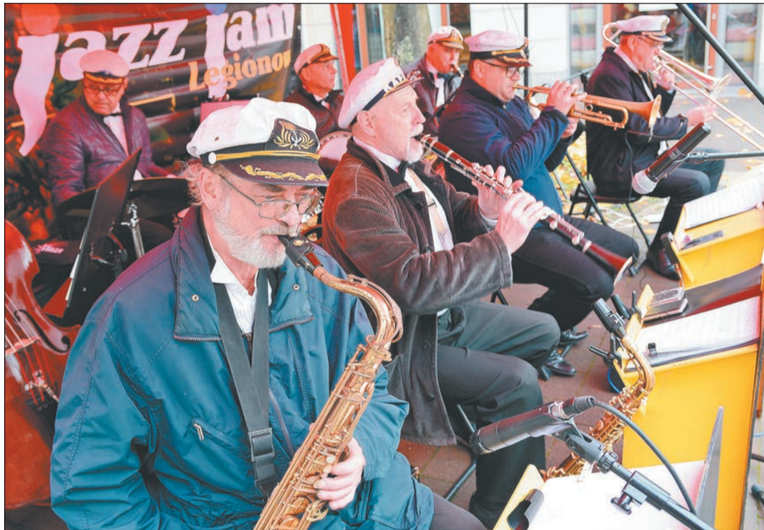
Vistula River Brass Band zainauguował tegoroczną edycję festiwalu Jazz Jam. W przyszłym roku zespół będzie obchodził jubileusz 50-lecia istnienia

Jazz w najlepszym wydaniu powrócił do nas na dobre. Właśnie trwa 2. edycja Festiwalu Mazowiecki Jazz Jam. Legionowo, którego współorganizatorem jest Powiat Legionowski.