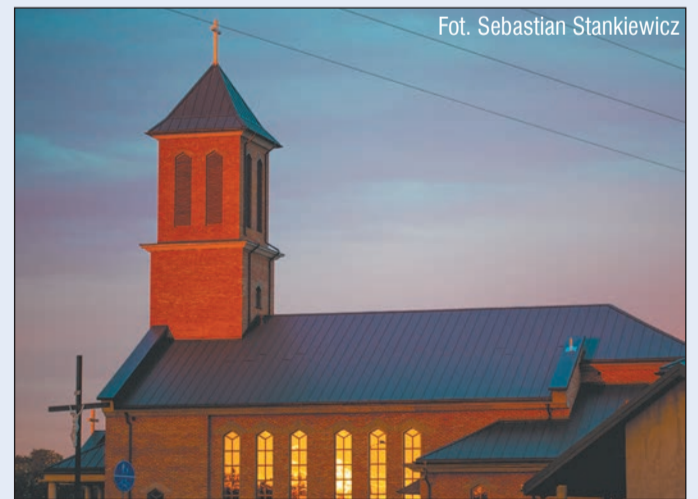
Fot. Sebastian Stankiewicz

Znamy już kolejnego laureata konkursu fotograficznego „Architektura powiatu legionowskiego w obiektywie”. Zdjęcie przedstawiające kościół w Skrzyszewie autorstwa Sebastiana Stankiewicza zostało fotografią miesiąca we wrześniu.