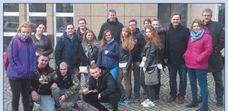
W tym roku uczniowie z Targowej odwiedzili już kolegów z niemieckiego Soest w ramach międzynarodowego programu Erasmus +. Wkrótce wyjadą do Chicago