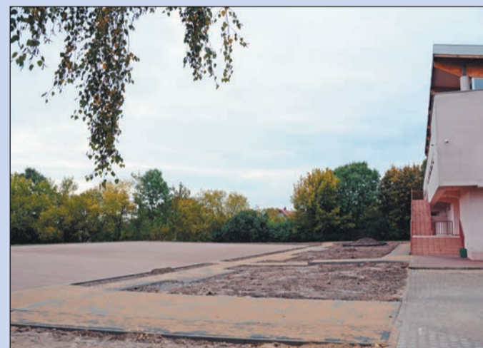
Już wkrótce społeczności PZSP w Serocku zostanie oddane do użytku nowoczesne boisko sportowe

Już wkrótce uczniowie Powiatowego Zespołu Szkół Ponadgimnazjalnych w Serocku będą mogli korzystać z boiska sportowego IV generacji do gry w piłkę nożną, które Powiat Legionowski buduje przy ich szkole. Koszt inwestycji to ponad 660 tys. złotych.