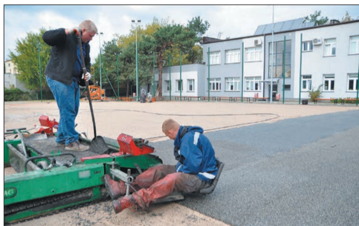
Budowa boiska na Targowej jest już na finiszu

Powiat Legionowski na dniach zakończy budowę wielofunkcyjnego boiska sportowego przy Powiatowym Zespole Szkół Ponadgimnazjalnych w Legionowie. Na inwestycję, której koszt wyniósł prawie 900 tys. zł czekają zarówno uczniowie, jak i nauczyciele wychowania fizycznego.