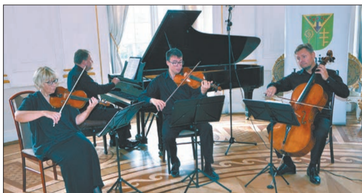
Muzycy kwartetu Quartetto Tempestivo grają ze sobą od wielu lat. Ostatnio wystąpili w Jabłonnie

Koncert muzyki klasycznej w wykonaniu kwartetu Quartetto Tempestivo znalazł się w programie październikowej odsłony „Pałacowych spotkań z muzyką”. Współorganizatorem cyklu jest Powiat Legionowski.