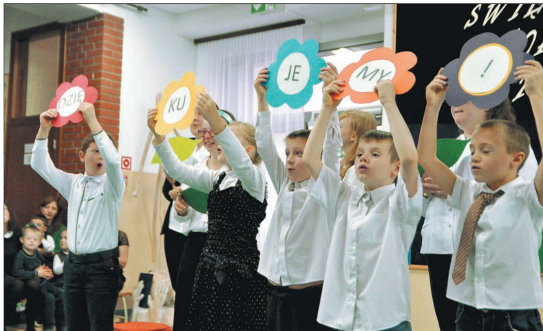
O oprawę artystyczną w trakcie uroczystej akademii zadbał uczniowie PZSiPS

Święto szkoły to wyjątkowe wydarzenie dla społeczności Powiatowego Zespołu Szkół i Placówek Specjalnych w Legionowie. Z tej okazji 12 października br. zorganizowano uroczystą akademię z udziałem uczniów, nauczycieli i zaproszonych gości.