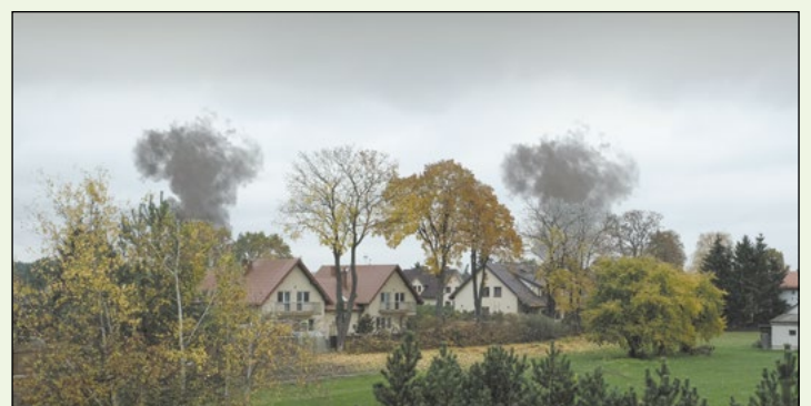
Dzięki dofinansowaniu z programu Czyste Powietrze można wymienić stare źródło ciepła na nowe i zadbać o środowisko

W Starostwie Powiatowym w Legionowie działa punkt konsultacyjny programu Czyste Powietrze, w którym można uzyskać informacje dotyczące programu oraz pomoc niezbędną do złożenia wniosku o dotację. Punkt działa w każdy czwartek. Kontakt – tel.: 22 764 01 85, e-mail: powietrze@powiat-legionowski.pl lub osobiście po wcześniejszym umówieniu się na spotkanie. OPRAC.KB