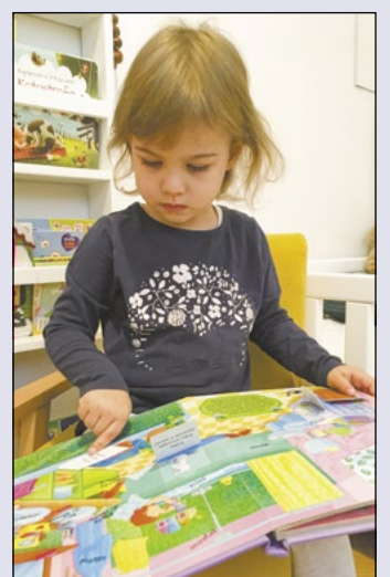
Czytanie rozwija dziecięcą wyobraźnię i kreatywność, wzbogaca słownictwo i jest doskonałym antidotum na nudę