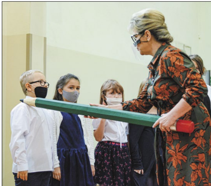
Pasowanie i ślubowanie to podniosły moment w życiu każdego ucznia wstępującego w szkolne i przedszkolne szeregi. To także wzruszająca chwila dla rodziców oraz pedagogów