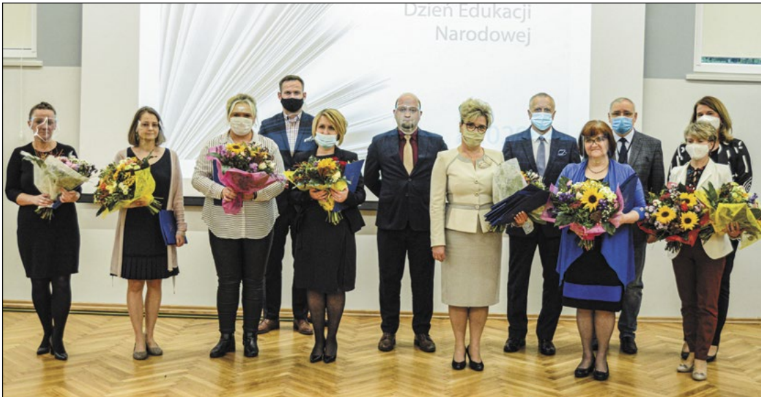
W szkołach prowadzonych przez Powiat zatrudnionych jest 236 nauczycieli. Z okazji Dnia Edukacji Narodowej nagrodzonych, którzy wyróżnili się w pracy dydaktyczno-wychowawczej

Nauczyciele z placówek edukacyjnych prowadzonych przez Powiat Legionowski za osiągnięcia dydaktyczno-wychowawcze zostali nagrodzeni podczas spotkania z okazji Dnia Edukacji Narodowej, które 13 października zorganizowano w legionowskim starostwie.