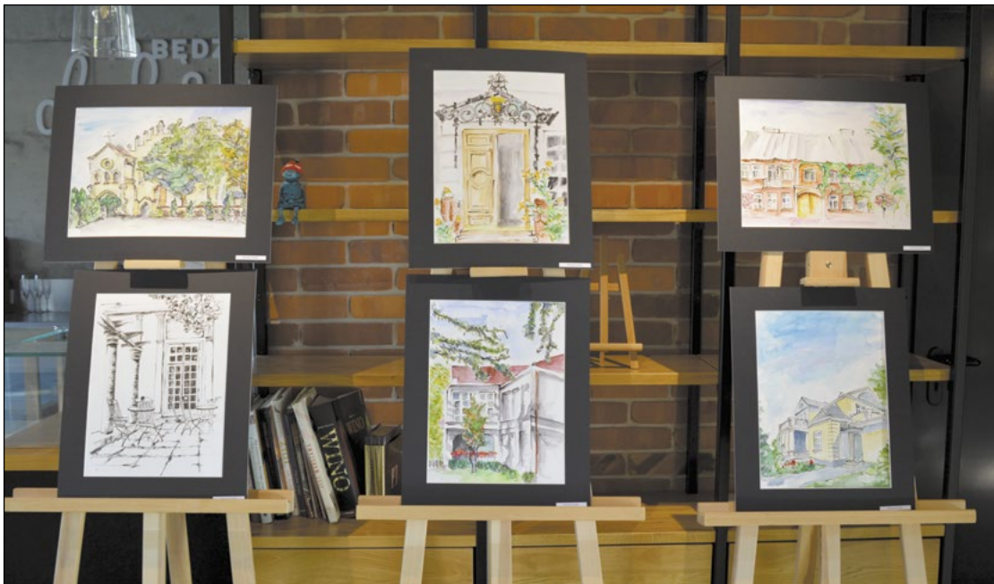
Podczas wystawy zaprezentowano efekty pracy uczestników letnich „ARCHI-PLENERÓW – LATO 2020”

Prace, które powstały w ramach wakacyjnych „ARCHI-PLENERÓW – LATO 2020”, zaprezentowano na ekspozycji w jabłonowskiej galerii „Na Prostej”. Transmisję na żywo wernisażu wystawy zorganizowano 24 października.