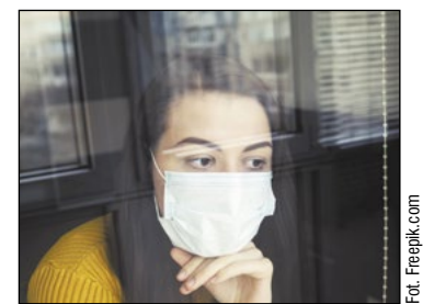
O nałożeniu kwarantanny sanepid informuje wyłącznie ustnie (telefonicznie)

Mazowiecki Państwowy Wojewódzki Inspektor Sanitarny w Warszawie poinformował, że w aktualnym stanie rozprzestrzeniania się wirusa SARS-CoV-2 zaistniała sytuacja epidemiologiczna uniemożliwiająca państwowym powiatowym inspektorom sanitarnym województwa mazowieckiego doręczanie decyzji o nałożeniu kwarantanny na piśmie. Zawiadomienia takie przekazywane są wyłącznie ustnie.