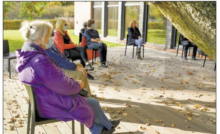
Część oficjalną wernisażu zorganizowano w plenerze z zachowaniem zasad dystansu społecznego

Uwarunkowania stanu epidemicznego sprawiają, że w wielu miejscach działalność kulturalna się zatrzymuje – ale nie w powiecie legionowskim. Wiele wydarzeń jest realizowanych w sposób zdalny. Taki też charakter miał wernisaż wystawy ARCHI-pleneru – wyjątkowej również i z tego względu, że prezentującej architekturę naszego powiatu poprzez sztukę naszych mieszkańców.