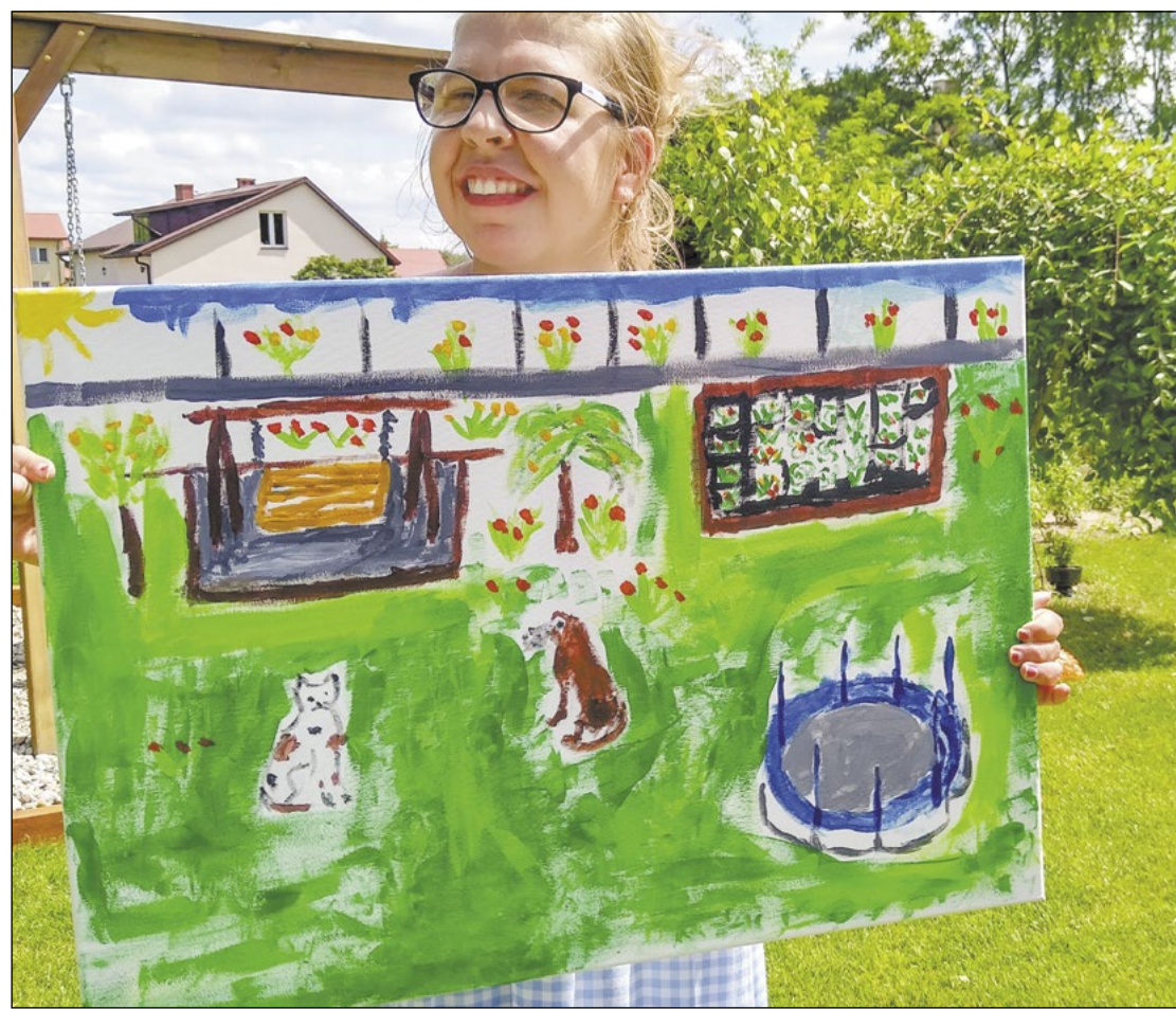
Uczestnicy pleneru malarskiego tworzyli we własnych domach i ogrodach

Pomimo niesprzyjających warunków organizatorzy IX Dni Osób Niepełnosprawnych Miasta Legionowo i Powiatu Legionowskiego znaleźli sposób, aby zaplanowane wydarzenia doszły do skutku. Było fajnie, ale przede wszystkim bezpiecznie.