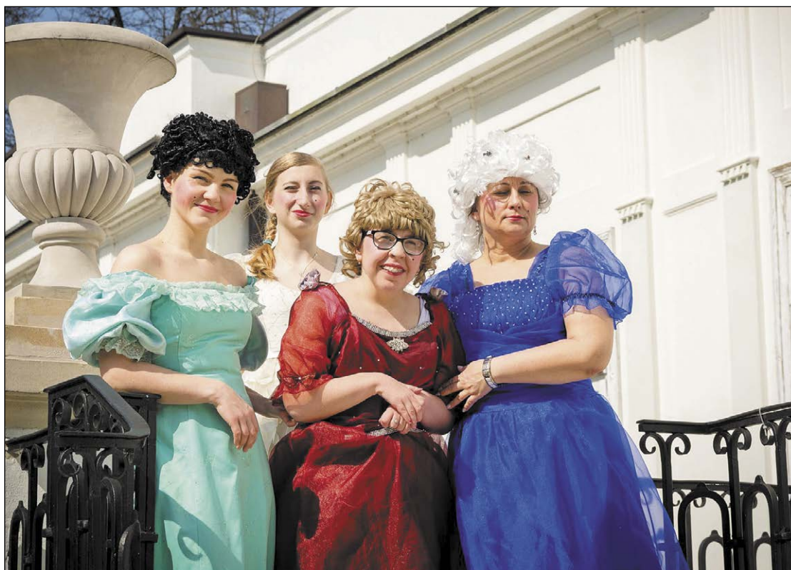
Wystawa pokazuje, że sztuka osób z niepełnosprawnościami nie ma ograniczeń, a udział w artystycznych projektach daje dużo radości i jest doskonałą formą terapii