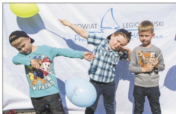
Najmłodszy mieszkańcy chętnie odwiedzali stoisko Powiatu Legionowskiego, biorąc udział w zorganizowanym w nim konkursie wiedzy

Nazwa stanowi o identyfikacji miejsca, ale to mieszkańcy tworzą jego charakter oraz budują jego wartość. To jest właśnie największy potencjał Legionowa, że szanujemy i pielęgnujemy pamięć o przeszłości, potrafimy wspólnie działać oraz odważnie patrzeć w przyszłość.