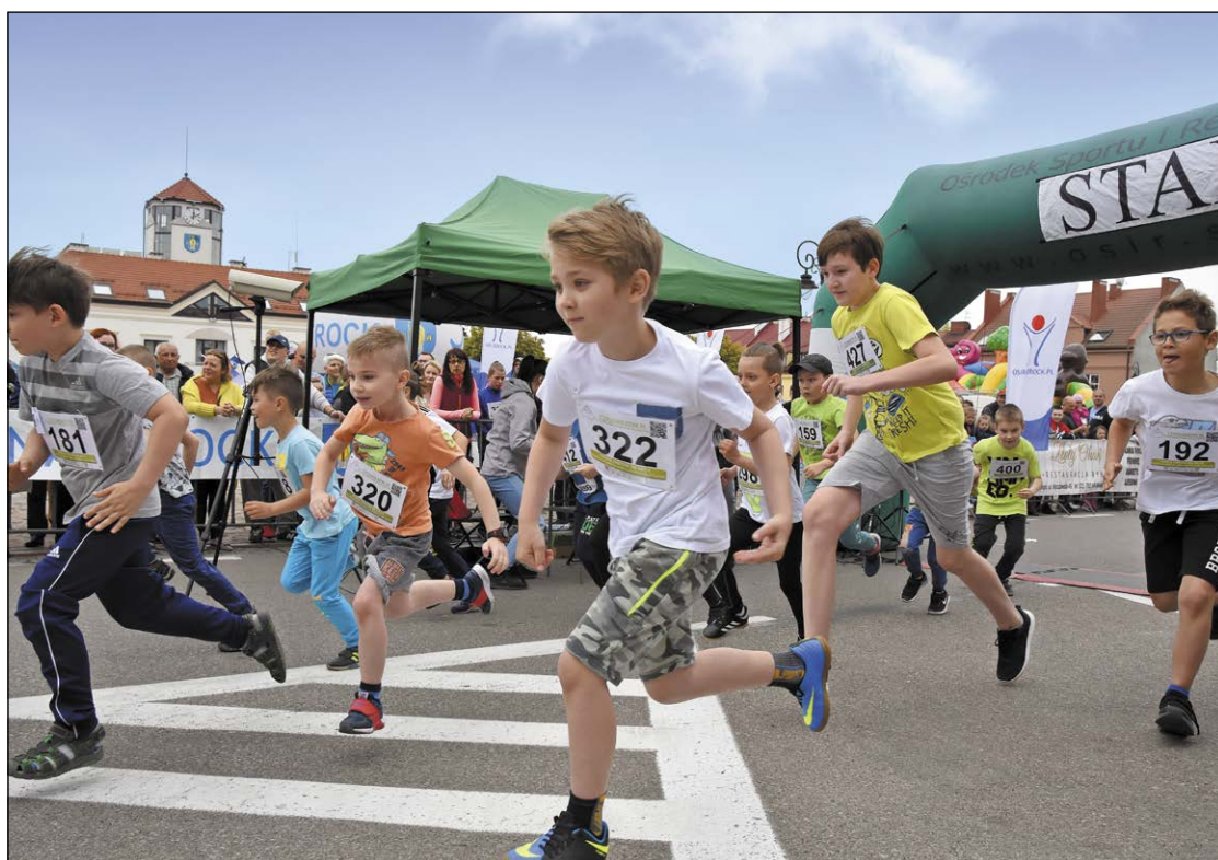
W Biegu Wojciechowym może wziąć udział każdy. Otwartość i dobra organizacja to podstawy sukcesu tego wydarzenia

Po 10 latach przerwy Poland Bike Marathon wrócił do Serocka. Na dodatek w wielkim stylu! W wyścigu, którego start i metę umiejscowiono na rynku jednego z najpiękniejszych i najstarszych miast na Mazowszu, wzięło udział aż 800 zawodników. Warto podkreślić, że czołówka Poland Bike Marathonu to jednocześnie najlepsi kolarze górscy i terenowi w kraju.