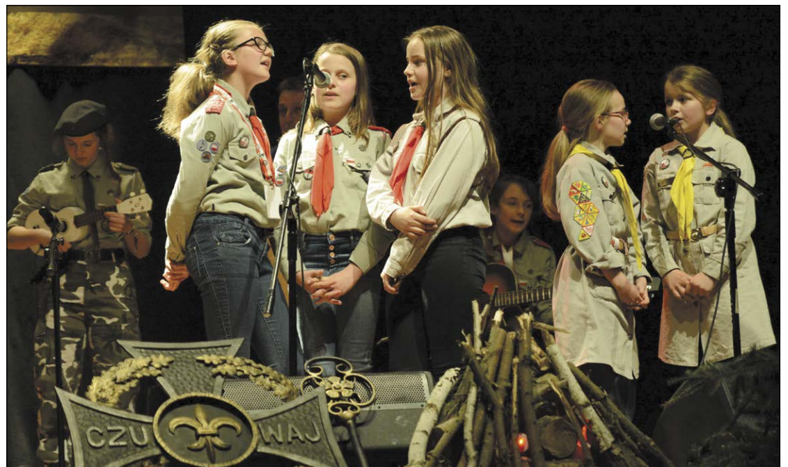
Przez trzy pełne atrakcji dni, wspólnie ze społecznością harcerską bawili się mieszkańcy naszego powiatu

Festiwal, w ciągu dekady, od małej lokalnej imprezy urosł do poziomu ogólnopolskiego wydarzenia z patronatami i wsparciem szanowanych instytucji. W tym roku niesamowity był jubileuszowy koncert Tadeusza Woźniaka. Jego najbardziej znany utwór „Zegarmistrz światła” wykonany został z udziałem aż trzech chórów. Tegoroczne wydarzenie jest ukoronowaniem naszych dotychczasowych działań. Mamy już pomysły na kolejne jego edycje.