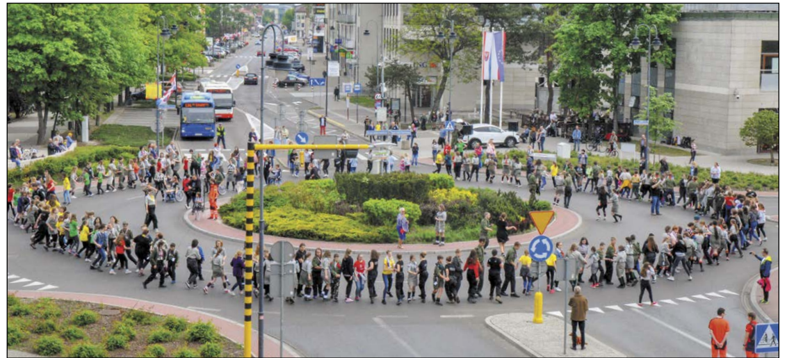
Harcerze tradycyjnie odtańczyli belgijkę na rondzie przy ratuszu