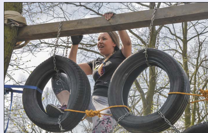
Spędzany „na sportowo” drugi dzień Świąt Wielkiej Nocy to coraz częściej wybierane rozwiązanie przez tych, którzy wysiłek fizyczny traktują jako styl życia

Po raz czwarty grupa Bravehearts Legionowo zaprosiła miłośników ekstremalnych doznań na morderczy trening, który odbył się w drugi dzień Świąt Wielkiej Nocy. W tym wydaniu „Lanego Poniedziałku” nie mogło zabraknąć obfitych strumieni wody.