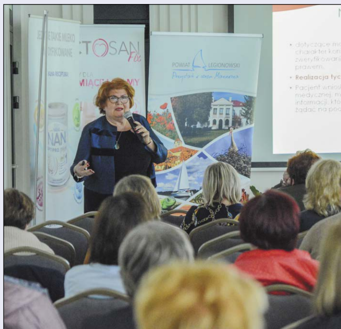
Konferencja zgromadziła przedstawicieli środowisk pielęgniarskich i położniczych z całego kraju. Spotkanie było okazją do zdobycia wiedzy i wymiany doświadczeń