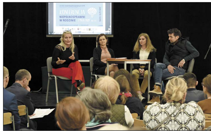
Konferencja w sposób kompleksowy odniosła się do zagadnienia niepełnosprawności w rodzinie

Tematy poruszane podczas spotkania dotyczyły także praw dzieci