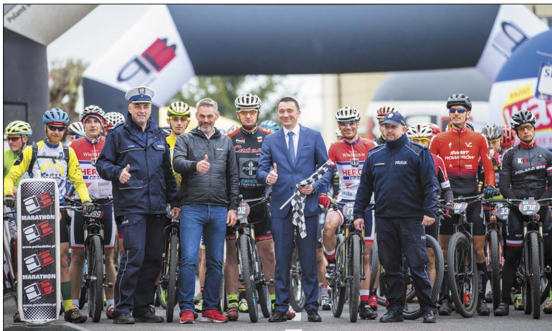
Jedno z największych w Polsce wydarzeń kolarskich – Poland Bike Marathon – zapewne jeszcze nie raz zagości w gościnnym Serocku

Ponad 800 zawodników, wśród których znaleźli się najlepsi w Polsce, rywalizowało podczas odbywającego się w Serocku trzeciego etapu Poland Bike Marathon. Zarówno organizatorzy, jak i kolarze chwalili urozmaiconą terenowo trasę, którą wielu miało okazję pokonać po raz pierwszy.