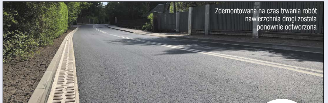
Zdemontowana na czas trwania robót nawierzchnia drogi została ponownie odtworzona

Zakończyły się prace przy budowie odwodnień w miejscowości Łacha w gminie Serock. Na zrealizowanie tej inwestycji Powiat przeznaczył prawie 640 tys. złotych.