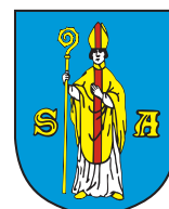
Miasto i Gmina Serock