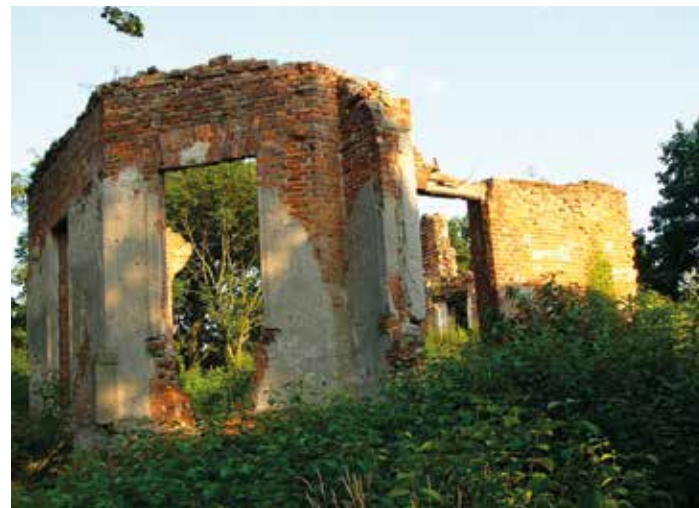
fol. Starostwo Powiatowe w Legionowie