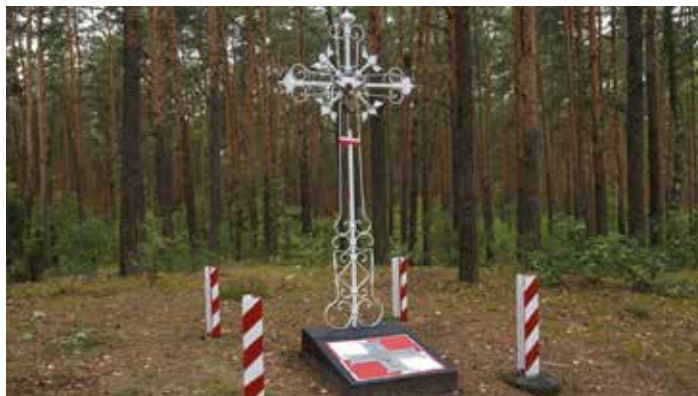
fol. Foto Media Art

Dalej kierujemy się na zachód. Trasą wśród Lasów Chotomowskich docieramy do pasma wydm Gór Chotomowskich, na których 22 lutego 1943 r. w do dziś niewyjaśnionych okolicznościach zostało zamordowanych czterech żołnierzy AK. Ich ofiarę upamiętnia żelazny krzyż osadzony na biało-czerwonej szachownicy.