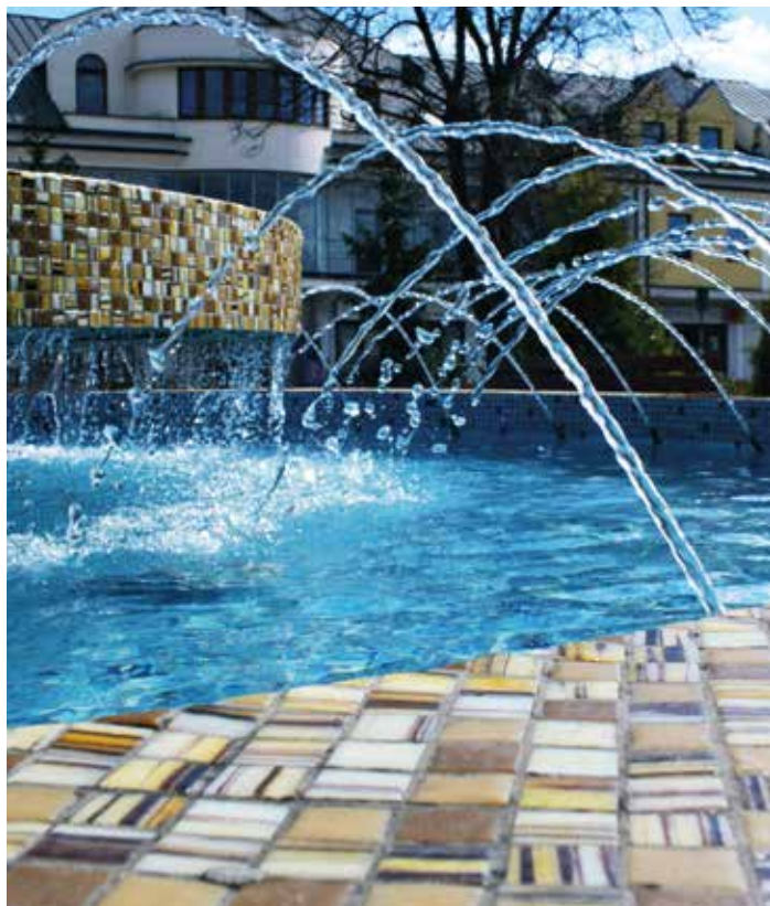
fol. Beata Dudek

Legionowo liczy ponad 55 tysięcy mieszkańców. Zajmuje 1360 ha położonych w północnej części województwa mazowieckiego, ok. 20 km od centrum Warszawy. Legionowo leży na szlakach komunikacyjnych łączących Warszawę z Gdańskiem (linia kolejowa) i Pojezierzem Mazurskim (droga krajowa nr 61). Tylko 7 km dzieli miasto od Jeziora Zegrzyńskiego - tradycyjnego miejsca wypoczynku mieszkańców Warszawy i okolic. Atrakcyjność inwestycyjną Legionowa podnosi nie tylko bliskość stolicy, ale też funkcja powiatowego centrum edukacji, ochrony zdrowia, kultury, handlu i usług. Jest to także miejsce koncentracji instytucji otoczenia biznesu, takich jak banki, firmy ubezpieczeniowe, leasingowe, kancelarie prawnicze, biura rachunkowe.