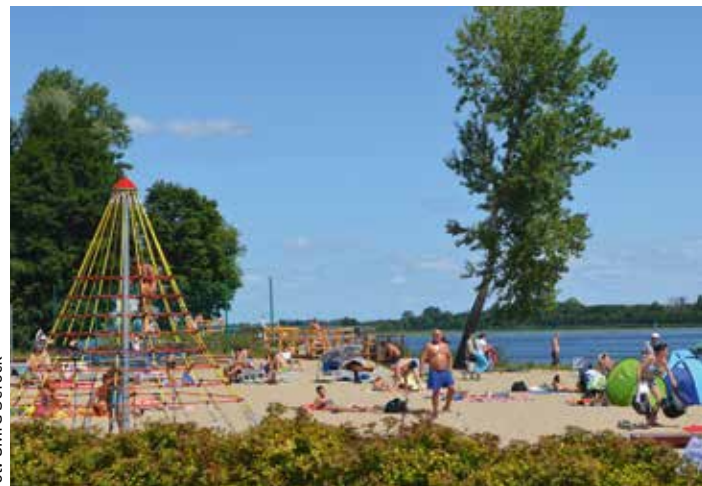
fol. UMIG Serock

W niemalże wszystkich walkach o Warszawę, Serock znajdował się w rejonie objętym działaniami wojennymi, przez co został doszczętnie zniszczony. W XIX wieku miasto to zostało zdegradowane poprzez odebranie mu praw