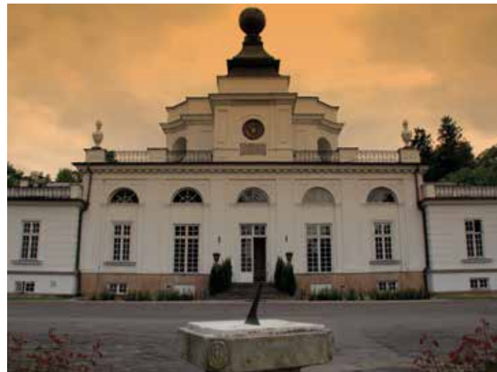
fol. Krzysztof Pietrzak