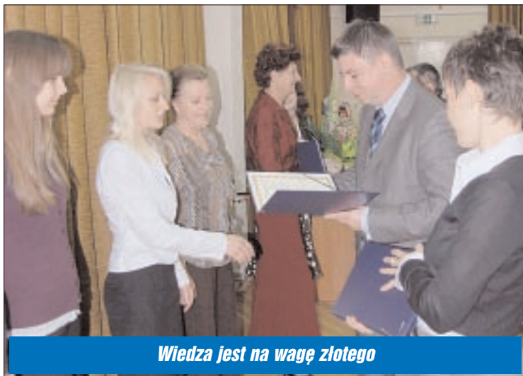
Wiedza jest na wagę złote

... także finansowo. Starosta Legionowski wręczył najlepszym uczniom szkół prowadzonych przez Powiat Legionowski nagrody pieniężne.