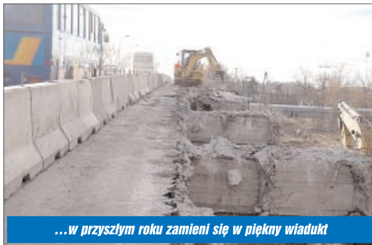
...w przyszłym roku zamieni się w piękny wiadukt

Choć historia budowy naszego długo wyczekiwanego wiaduktu brzmi jak klasyka horroru czy senny koszmar każdego inwestora, skończyła się zupełnie jak w bajce – happy endem. Prace się rozpoczęły i idą pełną parą. Cała inwestycja będzie kosztować 63,5 mln zł. Roboty zaplanowano na lata 2007 – 2009. Prawdopodobnie już w przyszłym roku pojedziemy nowym wiaduktem – stary trafi w ręce drogowców. Miejmy nadzieję, że ta inwestycja wyczerpała już przysługujący jej limit przeciwności i wszelakich kataklizmów, i że bez problemów zostanie doprowadzona do rychłego końca. Czego Państwu i sobie życzymy. ■