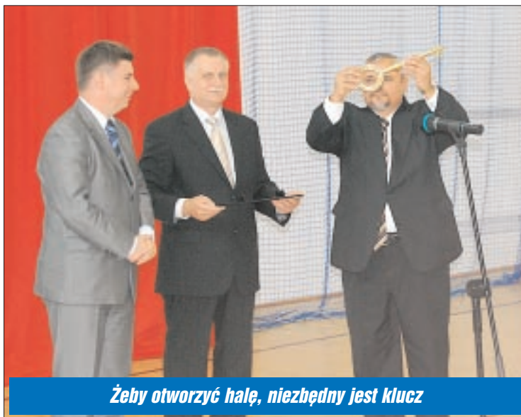
Żeby otworzyć halę, niezbędny jest klucz

28 września w serockim Powiatowym Zespole Szkół Ponadgimnazjalnych odbyła się wyjątkowa uroczystość. Społeczność szkolna oficjalnie odebrała w użytkowanie nową halę sportową.