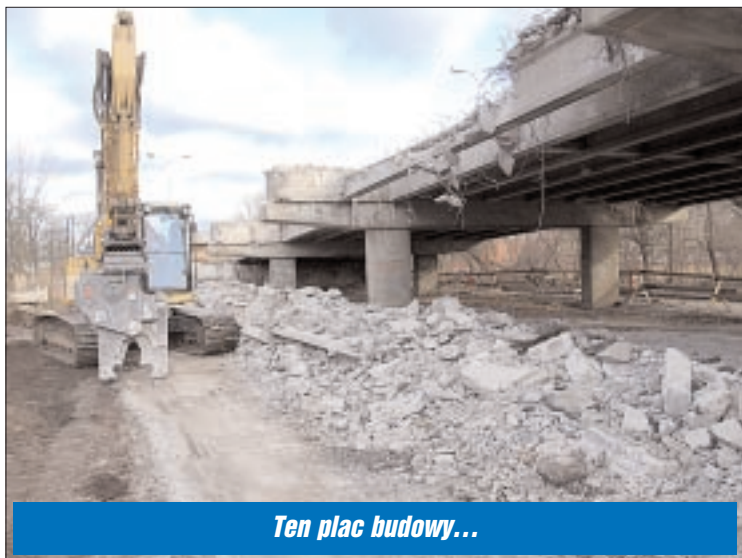
Ten plac budowy...

Rozpoczęły się długo oczekiwane prace przy budowie nowego wiaduktu nad torami kolejowymi w Legionowie.