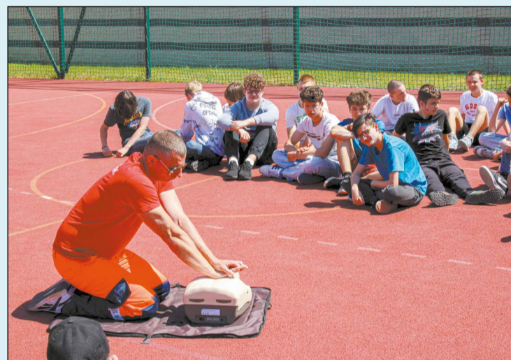
Uczestnicy szkoleń zdobędą praktyczną wiedzę z zakresu udzielania pierwszej pomocy. Być może kiedyś uratują czyjeś życie

W szkołach ponadpodstawowych na naszym terenie rozpoczęto realizację zleconych przez Powiat Legionowski warsztatów z udzielenia pierwszej pomocy przedmedycznej oraz obsługi defibrylatora. Pierwsze zajęcia odbyły się w Powiatowym Zespole Szkół Ponadpodstawowych w Legionowie, w kolejnych szkołach zorganizowane zostaną po wakacjach.