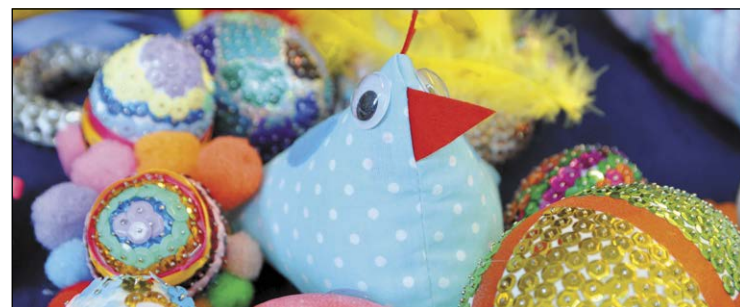
Wielkanocne ozdoby wykonane przez podopiecznych Fundacji „Promień Słońca”

Świąteczny klimat zawiątał do legionowskiego ratusza. 11 kwietnia br. odbył się tam Kiermasz Wielkanocny Fundacji „Promień Słońca”.