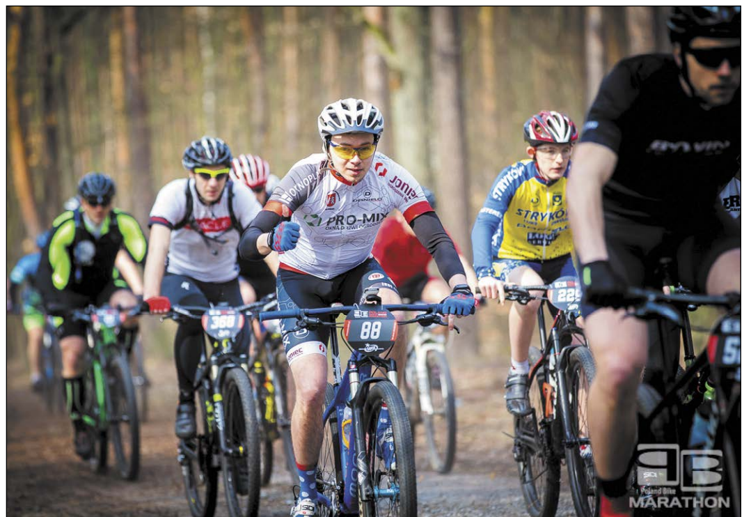
LOTTO Poland Bike Marathon w Legionowie był prawdziwym świętem miłośników kolarstwa górskiego