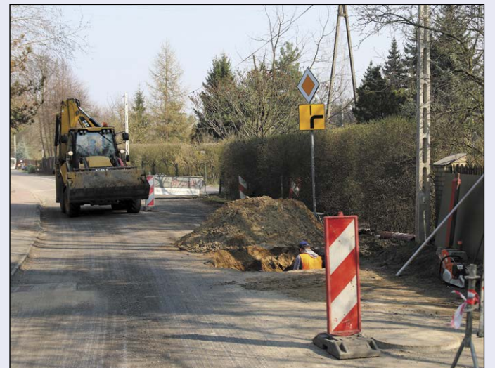
Tam, gdzie będzie to niezbędne, na czas trwania robót, zostanie zdjęta nawierzchnia drogi, a następnie ponownie odtworzona