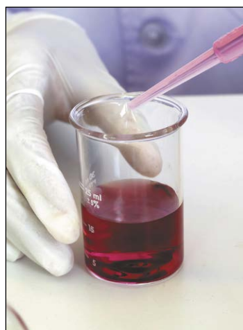
Stan bezpieczeństwa sanitarnego i weterynaryjnego w powiecie legionowskim jest na bieżąco i dokładnie monitorowany

W ramach nadzoru nad obiektami żywnościowymi pobrano 267 próbek w ramach urzędowej kontroli żywności. W rezultacie unieruchomiono jeden zakład żywienia zbiorowego otwartego ze względu na obecność szkodników i niewłaściwą gospodarkę odpadami, wystosowano trzy wnioski o ukaranie za prowadzenie działalności bez uzyskania zatwierdzenia Inspekcji Sanitarnej oraz wystąpił jeden przypadek zatrucia pokarmowego zbiorowego w jednej z legionowskich kawiarni, spowodowanego niezachowaniem ciągłości łańcucha chłodniczego.