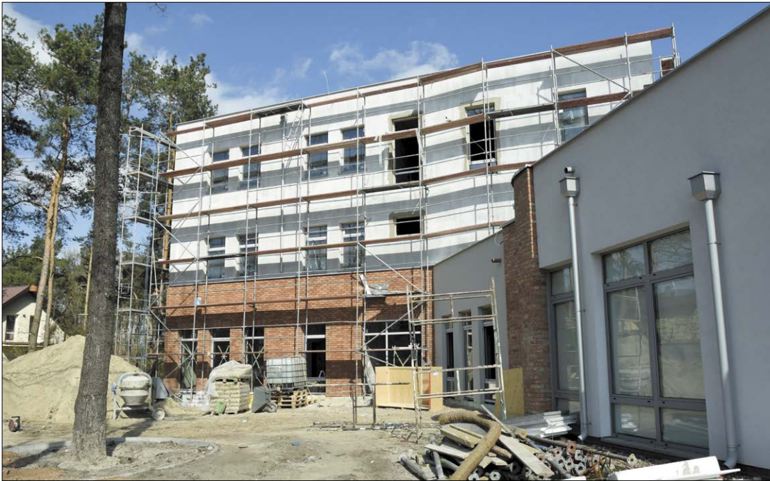
Rozbudowa budynku PZSiPS powinna zostać zrealizowana zgodnie z harmonogramem, czyli do końca grudnia br.

Budowa nowego skrzydła dla Powiatowego Zespołu Szkół i Placówek Specjalnych w Legionowie wchodzi w kolejny etap. Prace nad inwestycją, na którą Powiat przeznaczył 6 mln złotych, przebiegają zgodnie z harmonogramem.