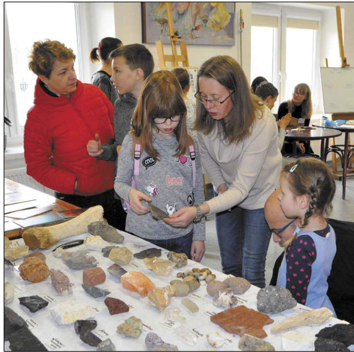
Stanowisko geologiczne było jednym z najbardziej obleganych. Muzeum Geologiczne w Warszawie zaprezentowało unikalne minerały, skamieliny, a nawet szczątki dinozaura