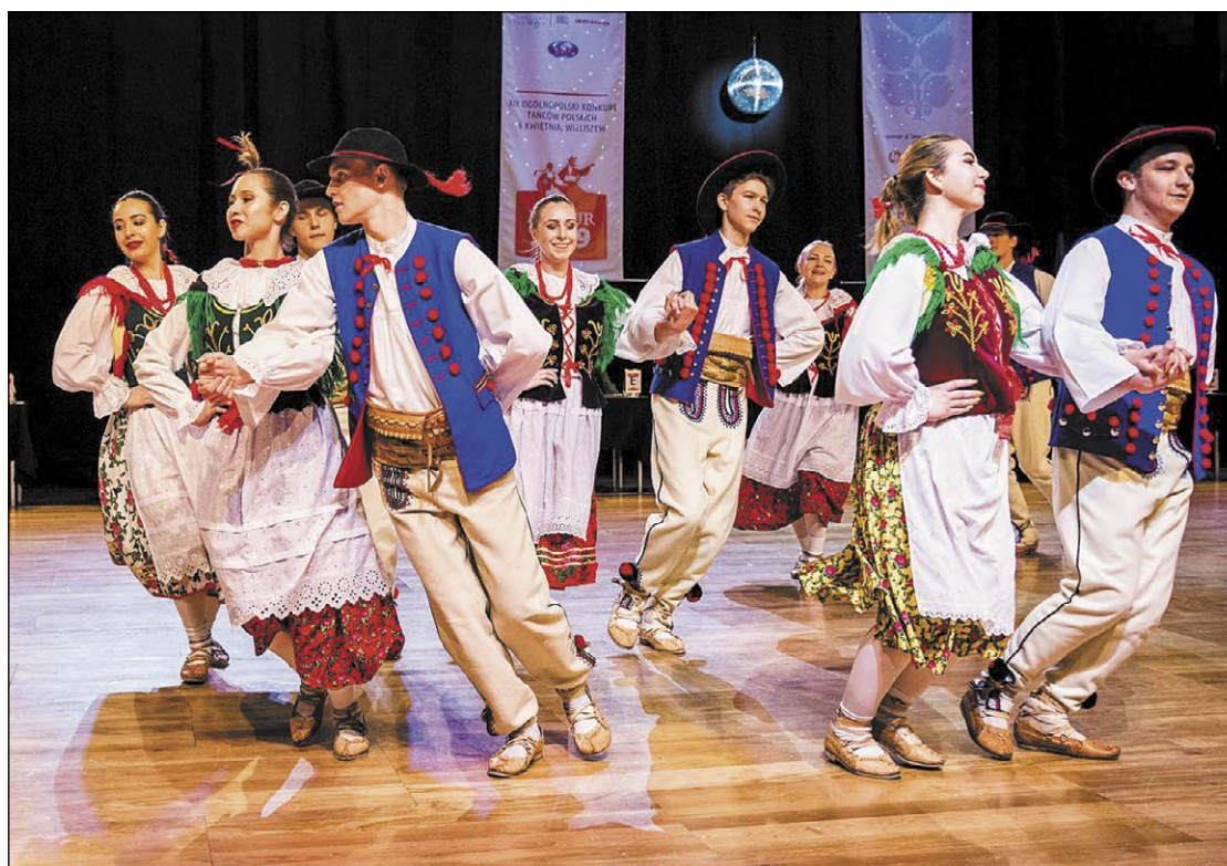
„Mazur” to nie tylko zacięta rywalizacja o mistrzowskie tytuły, ale także wspaniałe widowisko

Po raz kolejny zawiązała do nas cała czołówka par z niemal wszystkich ośrodków tanecznych w Polsce. My, jako organizatorzy Mistrzostw staraliśmy się, aby oprawa zawodów była godna rangi imprezy. Od półfinałów parom przygrywała na żywo kameralna Orkiestra Folklorystyczna pod kierownictwem Witolda Jarosińskiego. Bardzo zadowolony jestem z występu naszych par. Dwie pary, pomimo zmiany kategorii wiekowej na starszą, wywalczyły ścisły finał plasując się na VI pozycji. Mamy nadzieję, że przyszłoroczny, jubileuszowy „Mazur” również odbędzie się w Wieliszewie i już dziś zapraszamy na nasze święto tańców polskich.