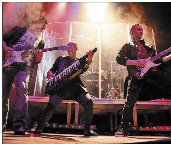
Koncerty i imprezy towarzyszące festiwalowi ProgRockFest na stałe wpisały się w kulturalny kalendarz powiatu, a Legionowo rokrocznie gości rzesze fanów rocka progresywnego z całej Polski. Na zdjęciu występ zespołu Mystery z Kanady