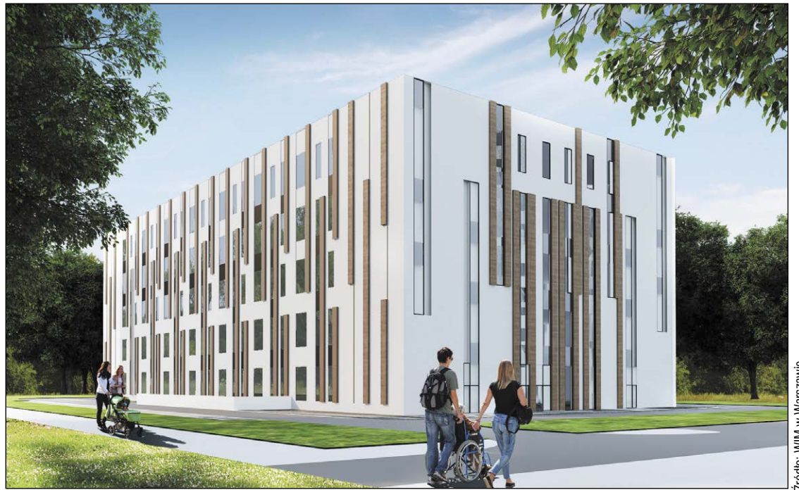
Wizualizacja budynku szpitala w Legionowie

Jednym z podstawowych praw pacjenta w Polsce jest możliwość wyboru placówki medycznej, w której chciałby być leczony. Nie ma najmniejszych