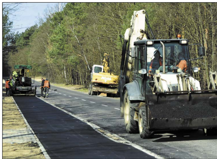
Już niedługo z ciągu pieszo-rowerowego w Komornicy będą mogli korzystać mieszkańcy oraz odwiedzający tę okolicę turyści