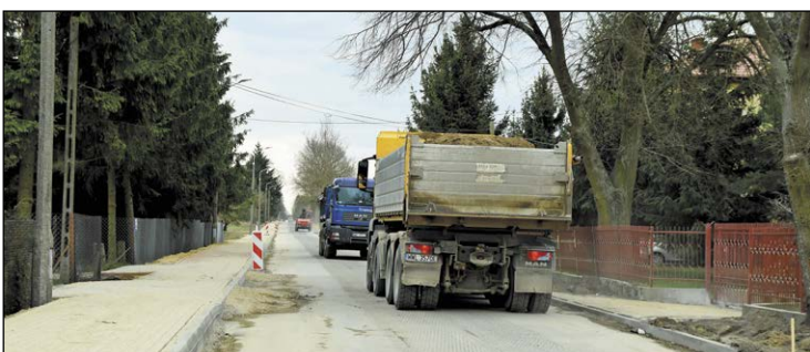
Jeżeli aura będzie łaskawa, prace powinny zakończyć się jeszcze w kwietniu, a odbiór inwestycji nastąpi na początku maja