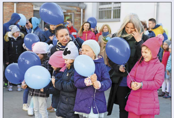
Na znak solidarności z osobami autystycznymi oraz ich rodzinami uczestnicy otrzymali niebieskie baloniki, które na koniec imprezy wypuścili do nieba