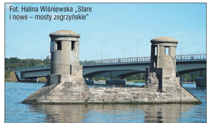
„Stare i nowe – mosty zegrzyńskie”

Znamy już kolejnego laureata konkursu fotograficznego „Architektura powiatu legionowskiego w obiektywie”. „Stare i nowe – mosty zegrzyńskie” autorstwa Haliny Wiśniewskiej zostało zdjęciem miesiąca w lipcu. Tytuł zdjęcia kwartału otrzymuje „Legionowo PKP” Wojciecha Domagały. Gratulujemy!