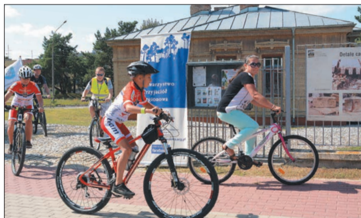
Uczestnicy rajdu wyruszyli spod filii Muzeum Historycznego na os. Piaski Legionowie

Towarzystwo Przyjaciół Legionowa (TPL) we współpracy z Powiatem Legionowskim zorganizowało 14 sierpnia br. Patriotyczny Rajd Rowerowy z Legionowa do Wólki Radzywińskiej, który był hołdem złożonym bohaterom Bitwy Warszawskiej 1920 r. Wzięło w nim udział 28 osób.