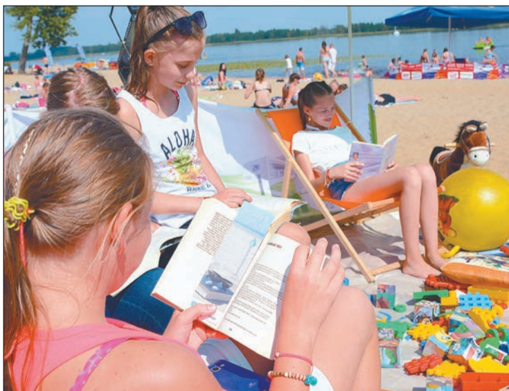
Popularność „Książki na plaży” wzrasta z każdym rokiem. Piękna pogoda, wygodny leżak i dobra książka to przepis na udany dzień nad wodą

Powiatowa Instytucja Kultury w Legionowie po raz kolejny zaprosiła mieszkańców do udziału w akcji „Książka na plaży”. Mobilne wypożyczalnię zorganizowano w sierpniu na plażach w Serocku i Wieliszewie.