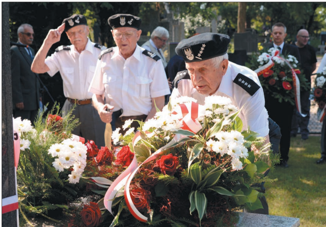
Kombatanci oddali hołd powstańcom składając kwiaty pod pomnikiem Poległych za Wolność Polski 1939-1945 na legionowskim cmentarzu

Powstanie Warszawskie to data w historii Polski wyjątkowa. Bliska wszystkim Polakom, a w sposób szczególny warszawiakom i mieszkańcom powiatu legionowskiego. Bo powstanie wybuchło nie tylko w stolicy, ale i na naszych terenach.