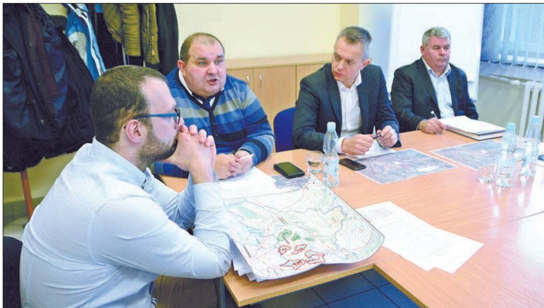
Starosta Legionowski na wniosek Powiatowego Lekarza Weterynarii w Nowym Dworze Mazowieckim zwołał spotkanie Powiatowego Sztabu Zarządzania Kryzysowego w sprawie wystąpienia przypadków afrykańskiego pomoru świń

22 listopada br. Wojewoda Mazowiecki wydał rozporządzenie w tej sprawie zakazujące organizowania targów, wystaw, pokazów lub konkursów zwierząt z udziałem świń oraz wyprowadzania świń z pomieszczeń, w których są