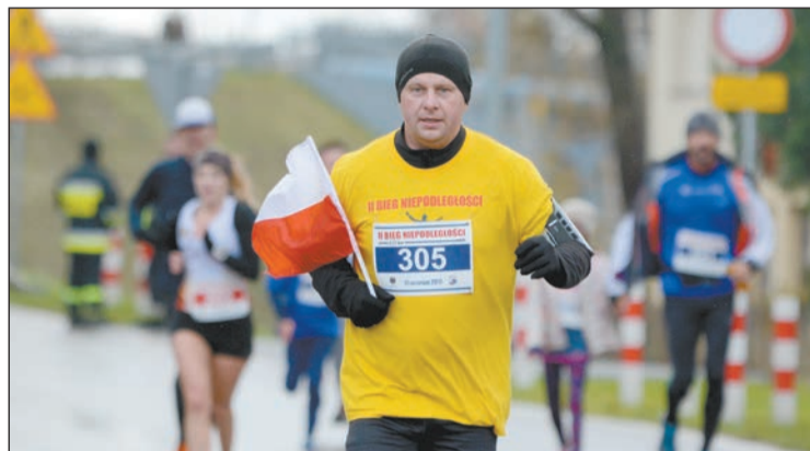
Biegi Niepodległości w gminie Nieporęt zapewne na stałe wpiszą się do kalendarza wydarzeń odbywających się na terenie powiatu legionowskiego

Narodowe Święto Niepodległości może być obchodzone na sportowo. Coraz bardziej popularne są uroczystości, których głównym punktem programu jest bieg nawiązujący do odzyskania przez Polskę wolności w 1918 roku.