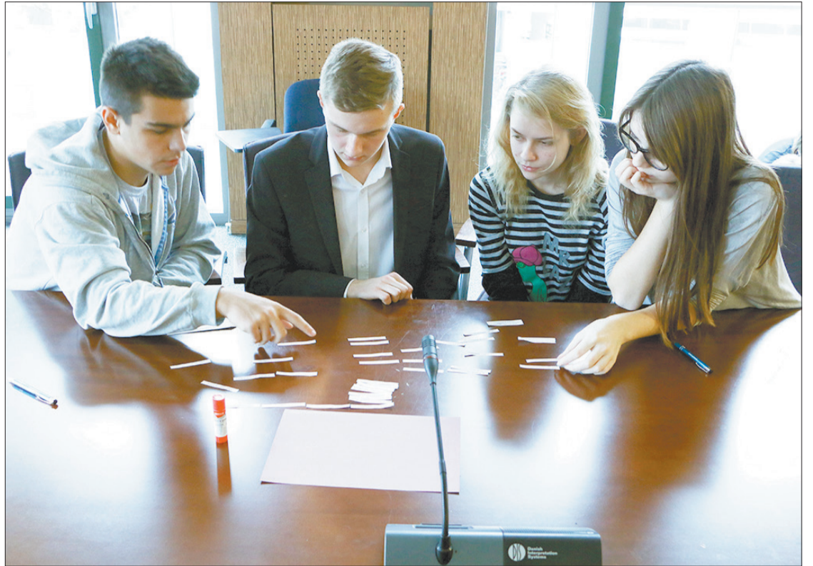
Uczniowie wspólnie zastanawiali się, jak efektywnie korzystać z wiedzy historycznej oraz, jak uniknąć pułapek interpretując przeszłość