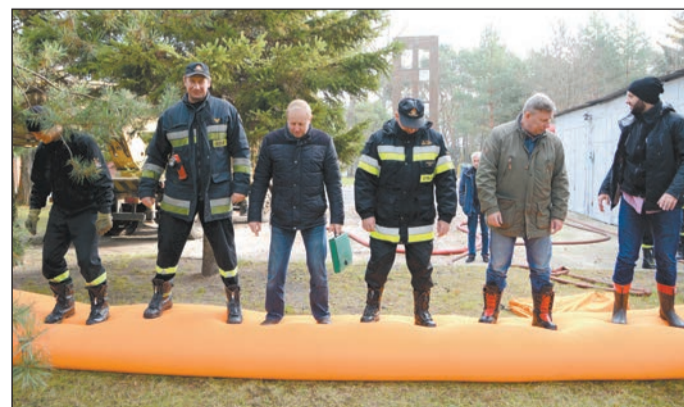
Prawidłowo napelniona wodą zapora jest wystarczająco stabilna i wytrzymała, aby unieść ciężar kilku dorosłych osób