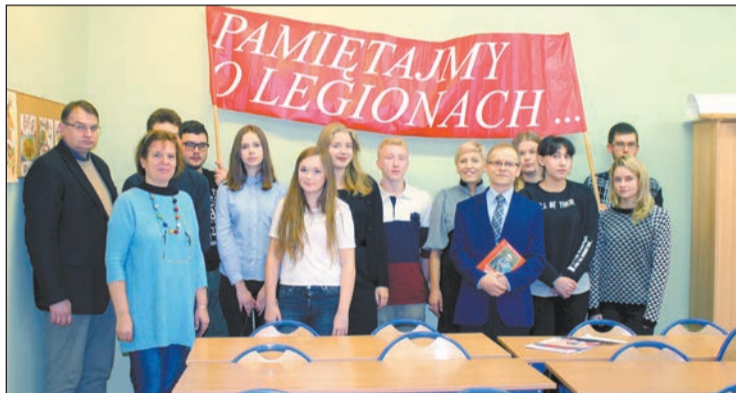
Do konkursu przystąpili uczniowie, dla których historia to nie tylko nauka, ale także prawdziwa pasja

10 listopada br., przy okazji uroczystości upamiętniających 99. rocznicę odzyskania przez Polskę niepodległości odbyło się uroczyste podsumowanie konkursu „Legiony a niepodległość Polski w latach 1914–1918. Rola Józefa Piłsudskiego” i wręczenie nagród laureatom.