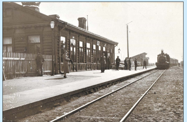
Stacja w Zegrzu, lata 20. XX w.

na typ ciężki i pobudowano wysokie perony. Pierwsze pociągi elektryczne z Warszawy do Zegrza przez Legionowo ruszyły w 1971 r. Przy stacji Zegrze wybudowano także nowoczesny dworzec kolejowy. Korzyściami z niego nie tylko turyści, ale także wojskowi z Zegrza Południowego oraz podchorążowie z Wyższej Szkoły Oficerskiej Wojsk Łączności. Latem 1977 r. stacja w Zegrzu stała się plenerem filmowym komedii „Co mi zrobisz jak mnie złapiesz” S. Barei.