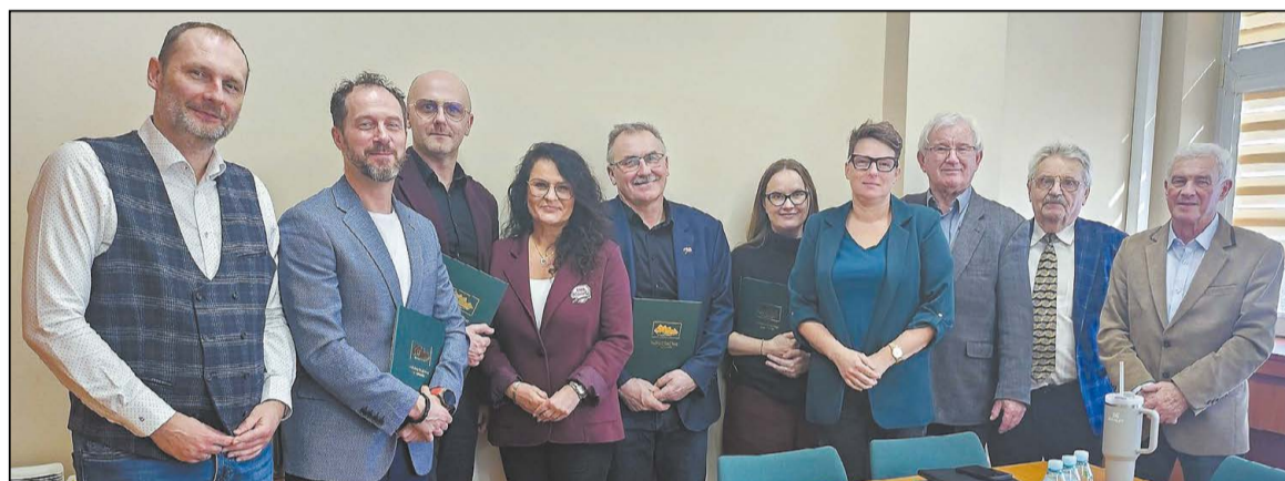
Powiatowa Rada Rynku Pracy 2026-2029 rozpoczęła działalność

Naszym celem jest realne wsparcie lokalnego rynku pracy oraz dobra współpraca z pracodawcami i instytucjami działającymi na rzecz zatrudnienia. Chcemy, aby Rada była miejscem dialogu i konkretnych działań odpowiadających na rzeczywiste potrzeby mieszkańców oraz lokalnej gospodarki. Stawiamy na praktyczne rozwiązania, które pomogą zarówno osobom poszukującym pracy, jak i przedsiębiorcom. Wierzę, że dzięki współpracy różnych środowisk nasze działania przełożą się na wzmocnienie rynku pracy w powiecie legionowskim.