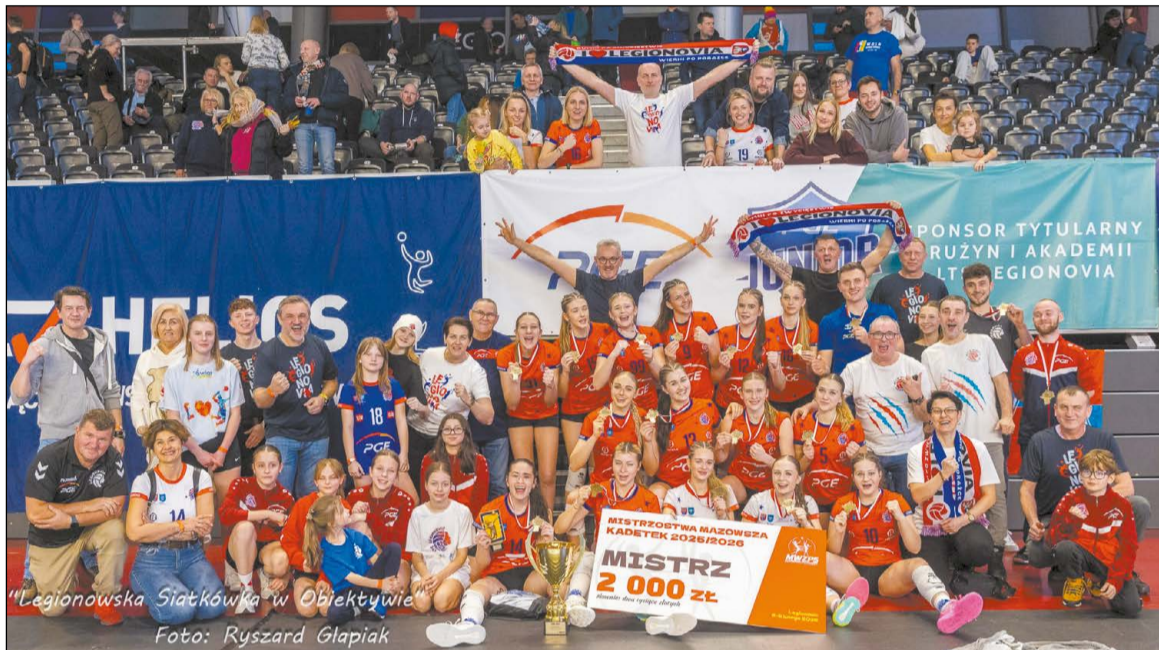
"Legionowska Siatkówka w Obiektywie"