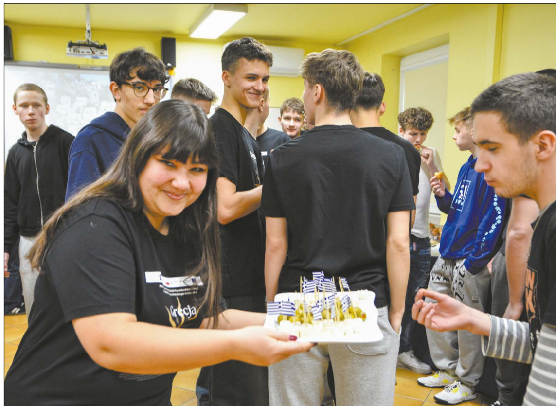
W rytmie greckich tańców i przy śródziemnomorskich smakołykach uczestnicy wracali wspomnieniami do praktyk w Grecji

Uczniowie Powiatowego Zespołu Szkół Ponadpodstawowych im. Włodzimierza Wolskiego w Serocku uczestniczyli w projekcie, który umożliwił im zdobycie cennego doświadczenia zawodowego podczas zagranicznych praktyk w Grecji. Wyjazd, finansowany ze środków europejskich, stał się okazją do połączenia nauki zawodu z poznawaniem realiów pracy w międzynarodowym środowisku.