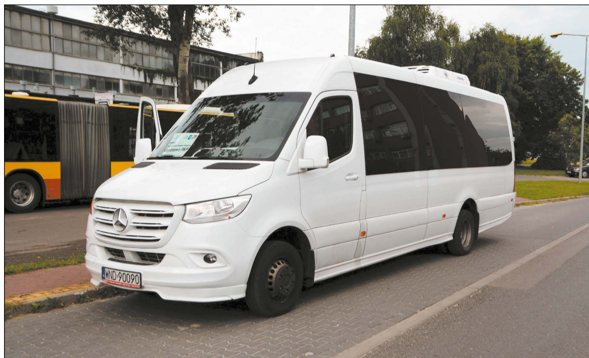
Powiat uruchamia kolejne bezpłatne połączenie autobusowe. Trasa nowej linii numer 10 P przebiega przez gminy Wieliszew i Nieporęt

Powiat Legionowski uruchamia bezpłatną linię autobusową nr 10 P, której trasa przebiega przez gminy Wieliszew i Nieporęt. To kolejny krok na drodze rozwoju powiatowych przewozów pasażerskich oraz ukłon w stronę uczniów i pracowników Liceum Ogólnokształcącego im. Stanisława Lema w Stanisławowie Pierwszym.