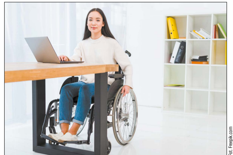
Osoby z niepełnosprawnością mogą ubiegać się o wsparcie finansowe dzięki programowi PFRON „Aktywny Samorząd”. Na pomoc mogą liczyć między innymi studenci