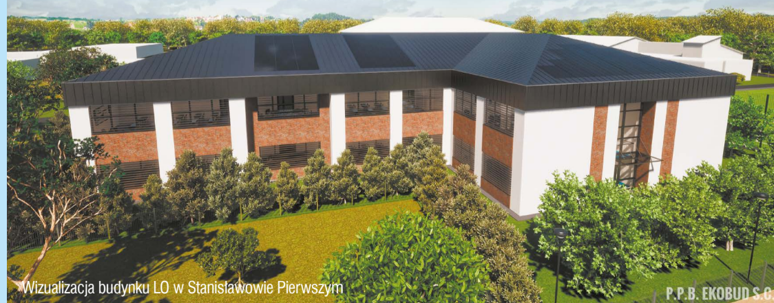
Wizualizacja budynku LO w Stanisławowie Pierwszym