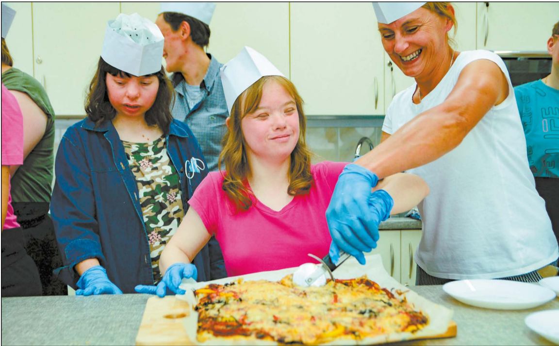
Uczestnicy Warsztatów Terapii Zajęciowej z pomocą profesjonalistów z warsztatu gastronomicznego Powiatowego Centrum Integracji Społecznej przygotowali pyszne potrawy

W ramach obchodów Dni Osób Niepełnosprawnych Miasta Legionowo i Powiatu Legionowskiego uczestnicy Powiatowego Centrum Integracji Społecznej zaprosili uczestników Warsztatów Terapii Zajęciowej z terenu powiatu do udziału w warsztatach kulinarnych.