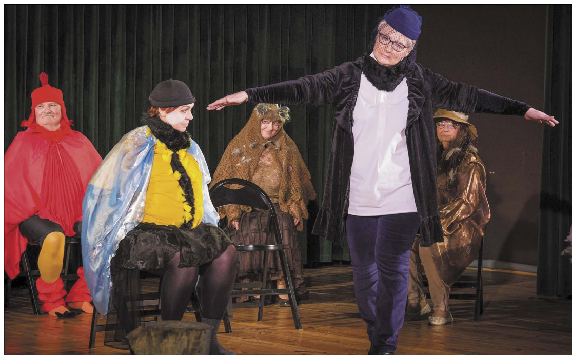
Seniorzy z serockiej grupy teatralnej „Starszaki” mają pomysł na siebie i spożytkowanie wolnego czasu. Tylko pozazdrościć formy i talentu

Grupa Teatralna Seniorów „Starszaki” z Serocka zaliczyła sceniczny debiut. Zresztą bardzo udany, i mimo że aktorzy są amatorami, to o amatorszczyźnie nie było mowy. Przedsięwzięcie współfinansował Powiat Legionowski.