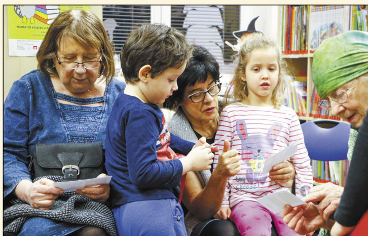
Dzień Babci można spędzić na wiele sposobów. PIK zaproponował babciom i wnukom wspólne świętowanie przy tworzeniu własnej bajki