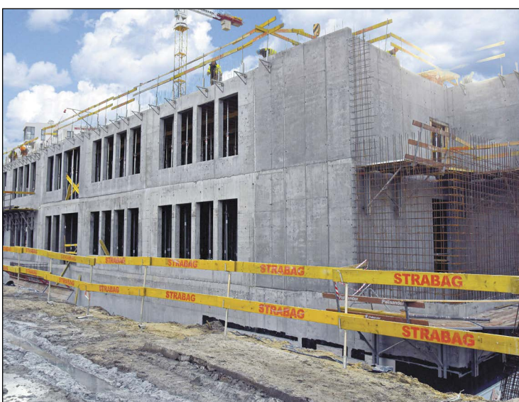
Wykonawca robót nie zwalnia tempa. Gotowy budynek będzie miał pięć kondygnacji naziemnych i jedną podziemną