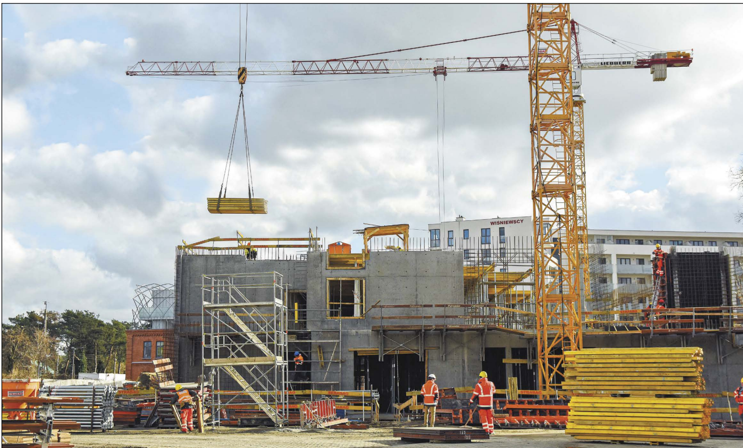
Powstający w Legionowie szpital będzie dostępny dla wszystkich mieszkańców, całodobowo świadcząc pomoc potrzebującym jej pacjentom

Ogólnodostępny szpital w Legionowie, którego powstanie przez długi czas pozostawało w sferze marzeń, staje się faktem. Trwające od czterech miesięcy prace budowlane przebiegają zgodnie z harmonogramem i bez zakłóceń, a budynek nabiera kształtu. Placówka rozpocznie działalność w drugim kwartale 2022 roku.