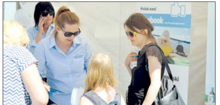
Stoisko promocyjne Powiatu Legionowskiego