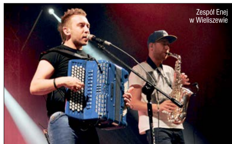
Zespół Enej w Wieliszewie

Święto Gminy Wieliszew, to tak naprawdę święto nas wszystkich, a przede wszystkim mieszkańców. To dzięki ich zaangażowaniu, pracy oraz kreatywności z roku na rok, ten wyjątkowy dzień nabiera blasku. Kolorowa parada, bogate stoiska i wspaniałe występy stają się marką naszej gminy. W tym roku tematem przewodnim obchodów był kosmos i jak co roku i tym razem mieszkańcy nie zawiedli. Z naszej strony prezentem dla wszystkich było zaproszenie gwiazd: Kabaretu Skeczów Męczących, Eleganckiej Kapeli oraz zespołu ENEJ. Odbył się również finał loterii „Rozlicz PIT w Gminie Wieliszew – wygraj samochód” – to absolutny debiut na skalę województwa mazowieckiego.