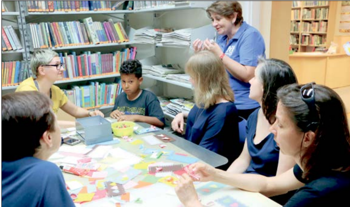
Zajęcia warsztatowe w Powiatowej Instytucji Kultury

Po sukcesie Nocy Muzeów nadszedł czas na popularyzację czytelnictwa. Druga odsłona Nocy Bibliotek nastąpiła w sobotę, 4 czerwca.