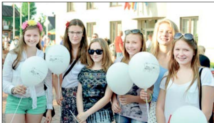
Stoisko Powiatu podczas święta w Serocku było oblegane przez dzieci i młodzież

Wspólnym mianownikiem gminnych świąt organizowanych w Serocku i Wieliszewie jest promowanie aktywności mieszkańców. To okazja do zaprezentowania ich działalności prowadzonej przez cały rok na rzecz wspólnoty lokalnej.