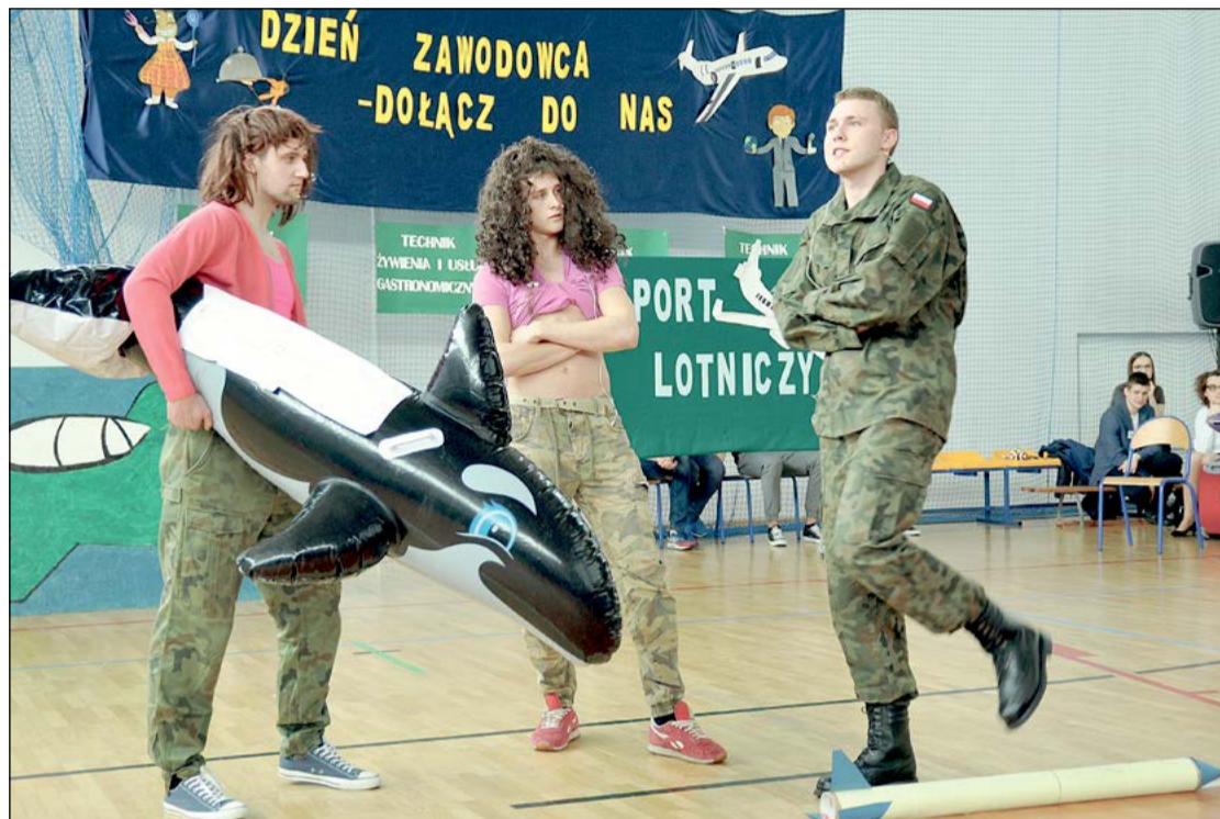
Relację filmową z Dnia Zawodowca można obejrzeć na stronie powiat-legionowski.pl

Tego dnia serocką placówkę odwiedzili także potencjalni przyszli uczniowie - gimnazjaliści z Legionowa, Dzieżeninina Woli Kiełpińskiej, Nowego Dworu Mazowieckiego, Winnicy, Zegrza, Wieliszewa i Serocka. To, co zobaczyli i czego się dowiedzieli o szkole, zachęci ich niejako nadzieję do nauki