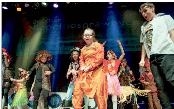
Laureaci i miejsca w konkursie form scenicznych i medialnych w kategorii grup teatralnych - Teatr Bajka z PZSiPS w Legionowie

Projekcją krótkiego materiału filmowego podsumowano dotychczasowe edycje cyklu „Dni Osób Niepełnosprawnych” oraz zaprezentowano program tegorocznych obchodów. Oprócz stałych pozycji, w harmonogramie przewidziano dodatkowe wydarzenia. Grono organizatorów zasilili bowiem Muzeum