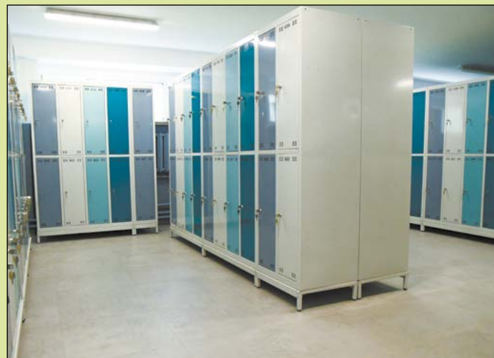
Powracający po letniej przerwie uczniowie, nauczyciele oraz pracownicy legionowskiego Liceum im. Marii Konopnickiej rozpoczną nowy rok szkolny w odświeżonych wnętrzach

W legionowskim Liceum im. Marii Konopnickiej zakończył się remont szatni oraz klatek schodowych.