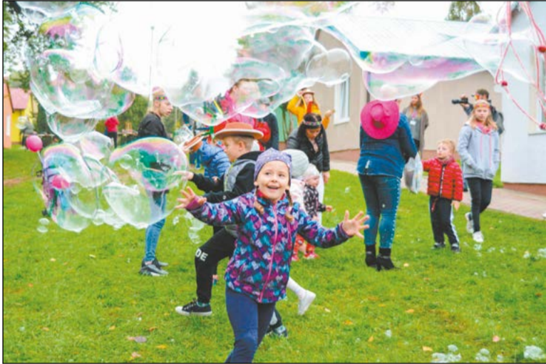
Piknik, podczas którego nie zabrakło konkursów z nagrodami, animacji, zabaw oraz poczęstunku, w tym roku odbył się w klimacie Dzikiego Zachodu

Już po raz trzynasty Powiatowe Centrum Pomocy Rodzinie w Legionowie zaprosiło do wspólnej zabawy rodziny zastępcze z powiatu legionowskiego. Piknik im dedykowany odbył się 2 października na terenie Integracyjnego Centrum Opieki Wychowania Terapii w Serocku.