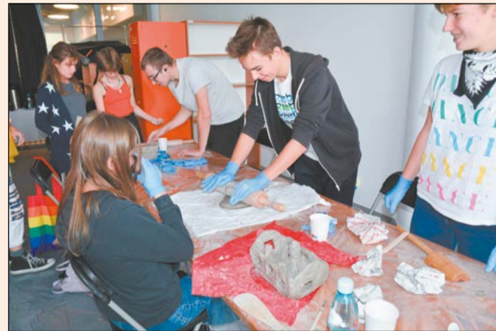
Warsztaty ceramiczne w legionowskiej Pocztyalni, podczas których powstaje makietę Prawieku

Powiatowa Instytucja Kultury w Legionowie w niecodzienny sposób chce uhonorować noblistkę Olę Tokarczuk, prezentując w przestrzeni Legionowa makietę Prawieku, wsi opisanej w powieści „Prawiek i inne czasy”.