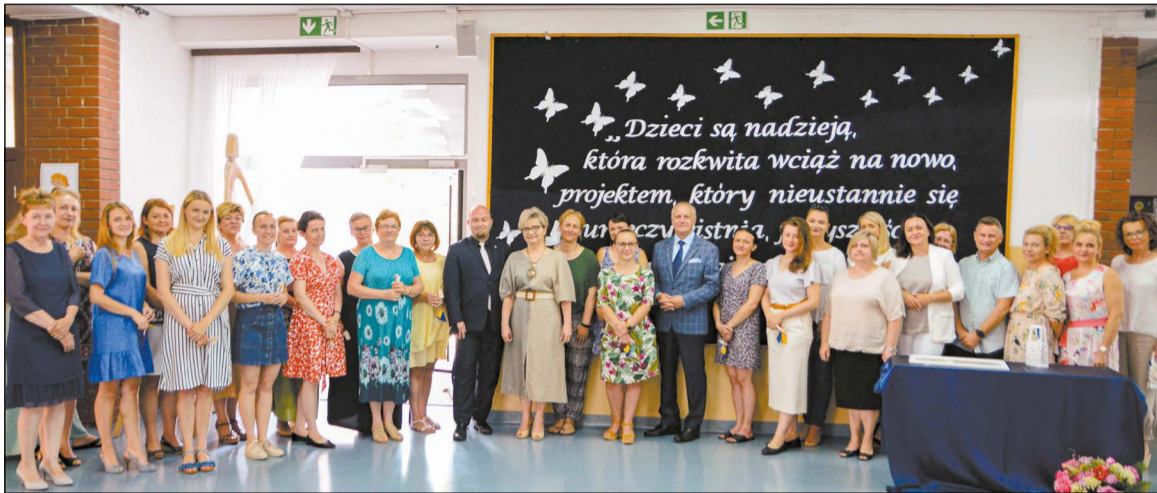
Spotkanie podsumowujące efekty obu realizowanych projektów odbyło się 29 czerwca w Powiatowym Zespole Szkół i Placówek Specjalnych

Powiatowy Zespół Szkół i Placówek Specjalnych w Legionowie podsumował dwa unijne projekty, dzięki którym dzieci z niepełnosprawnościami mogły zwiększyć swoją aktywność w życiu społecznym i kulturalnym.