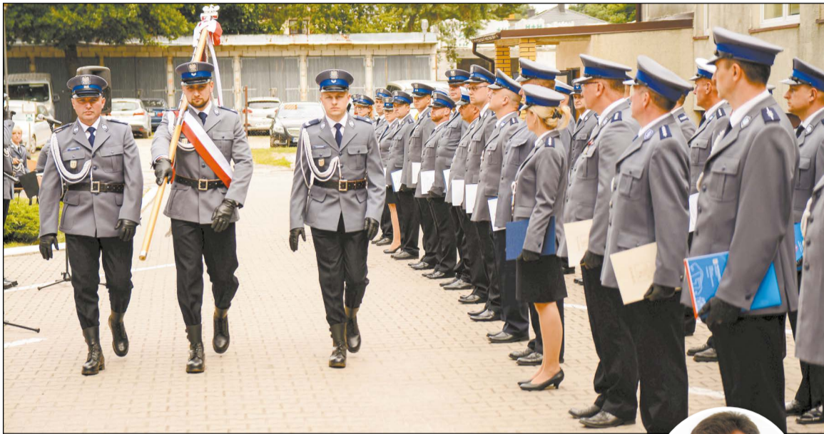
W trakcie obchodów Święta Policji wyróżniono najbardziej zasłużonych funkcjonariuszy

Awanse na wyższe stopnie oraz nagrody za wzorową służbę wręczono funkcjonariuszom z terenu powiatu legionowskiego podczas uroczystych obchodów Święta Policji.