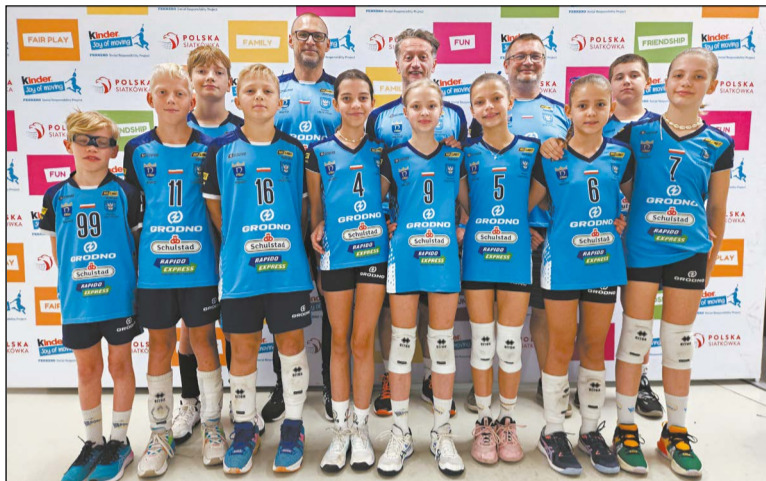
Cała reprezentacja Dębiny, razem ze sztabem szkoleniowym, na Mistrzostwach Polski

Wspierane przez Powiat Legionowski zawodniczki UKS Dębina Nieporęt przywiozły brązowe medale z ogólnopolskiego finału Mistrzostw Polski w Minisiatkówce. W kwalifikacjach do tego najważniejszego turnieju dziewczęta w kategorii „trójki” zdobyły tytuł Mistrzyń Mazowsza.