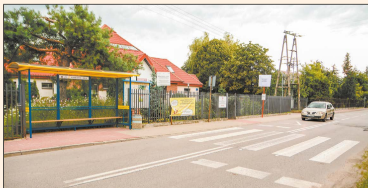
Realizacja inwestycji bez wątpienia przyczyni się do poprawy bezpieczeństwa pieszych uczestników ruchu

W postępowaniu przetargowym Powiat Legionowski wyłonił wykonawcę przebudowy i rozbudowy przejścia dla pieszych w ciągu drogi powiatowej nr 1810W – ul. Wolska w Stanisławowie Drugim. Wartość zadania to 186 960,00 zł.