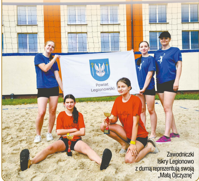
Zawodniczki Iskry Legionowo z dumą reprezentują swoją „Małą Ojczyznę”