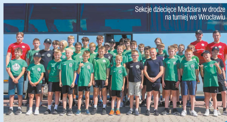
Sekcje dziecięce Madziara w drodze na turniej we Wrocławiu

Na prestiżowym międzynarodowym turnieju Wrocław Summer Cup reprezentujący Powiat Legionowski Klub Sportowy Madziar Nieporęt wywalczył 3. miejsce.