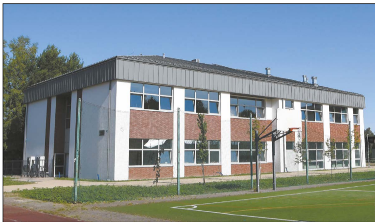
Nowa siedziba dla Liceum Ogólnokształcącego im. Stanisława Lema w Stanisławowie Pierwszym jest już niemal gotowa

Prace na budowie siedziby dla Liceum Ogólnokształcącego im. Stanisława Lema w Stanisławowie Pierwszym zmierzają ku końcowi. Oddanie do użytkowania, rozpoczętej w kwietniu ubiegłego roku inwestycji, zaplanowano na wrzesień.