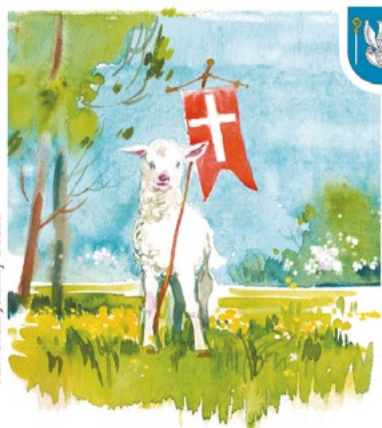
Akwarela Jolanty Drozd

Zamierzam wziąć udział w referendum. Uważam, że jest to prawo przysługujące każdemu obywatelowi. Temat dotyczy rzeczy dla nas bardzo istotnej. Uważam, że konieczne jest rzetelne podanie informacji, jakie są plusy i minusy, jakie są korzyści i jakie zagrożenia dla nas. To powinien mieć w świadomości każdy mieszkaniec idący do referendum.