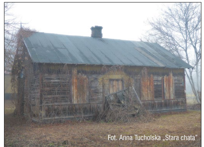
„Stara chata”

Znany już kolejnego laureata konkursu fotograficznego „Architektura powiatu legionowskiego w obiektywie”. „Stara chata” autorstwa Anny Tucholskiej została zdjęciem miesiąca w marcu.