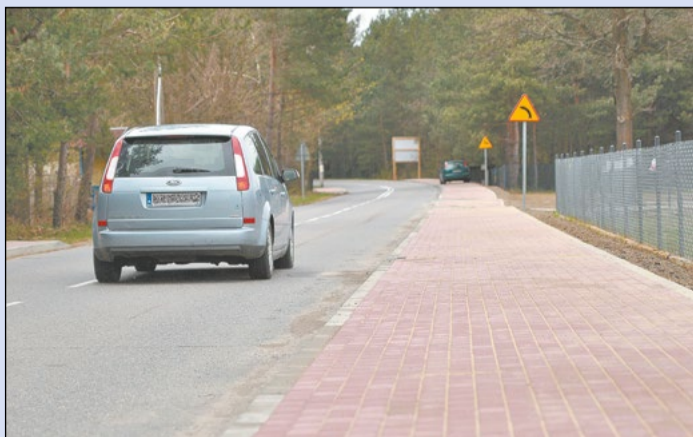
Chodnik w Komornicy został oddany do użytku kilka dni wcześniej, niż planowano