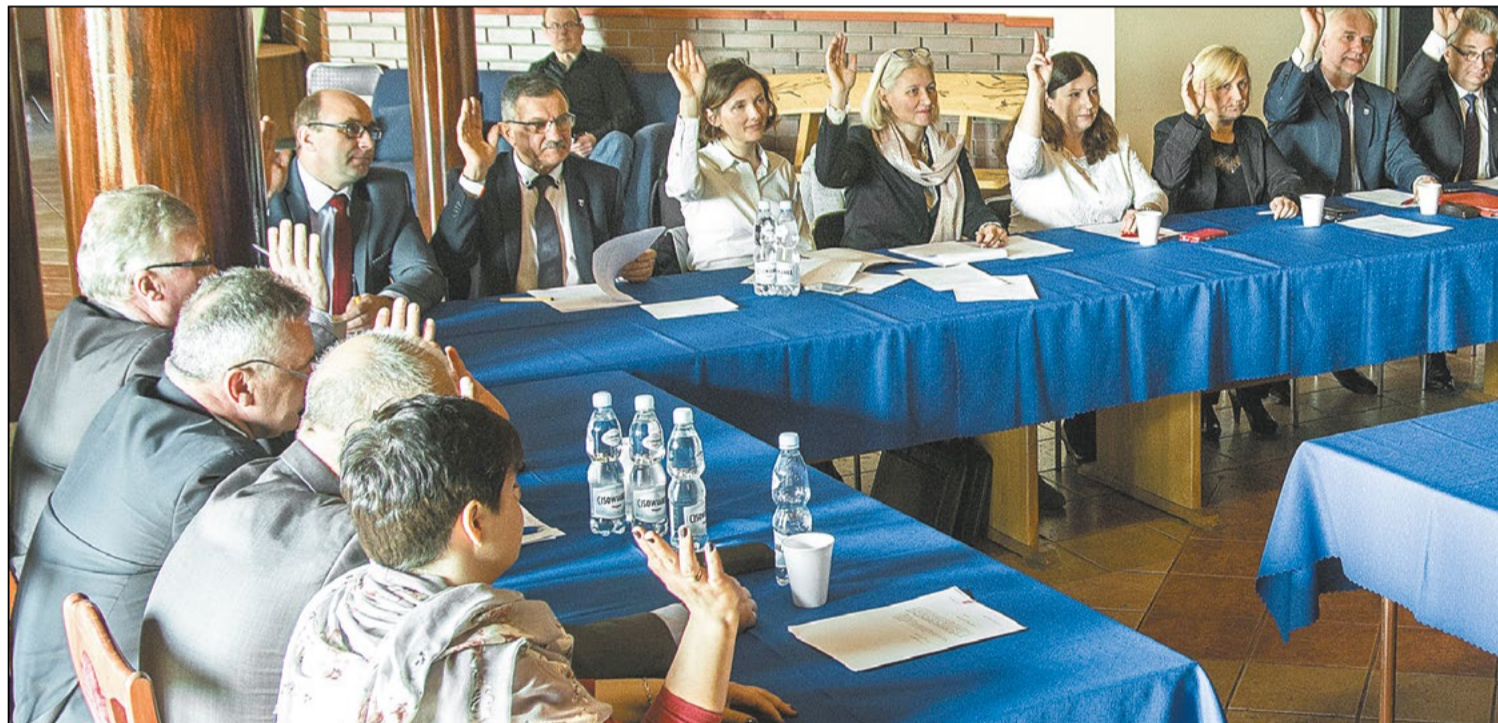
Radni gminy Nieporęt jednogłośnie zdecydowali o referendum, które odbędzie się 14 maja 2017 roku

Nieporęt to już drugi samorząd w powiecie legionowskim, w którym mieszkańcy będą mogli w referendum wyrazić swoje zdanie na temat pomysłu włączenia ich gminy w granice jednostki administracyjnej pod nazwą „miasto stołeczne Warszawa”. Wcześniej referendum odbyło się w Legionowie, przy spektakularnej frekwencji blisko 50% uprawnionych do głosowania mieszkańców.