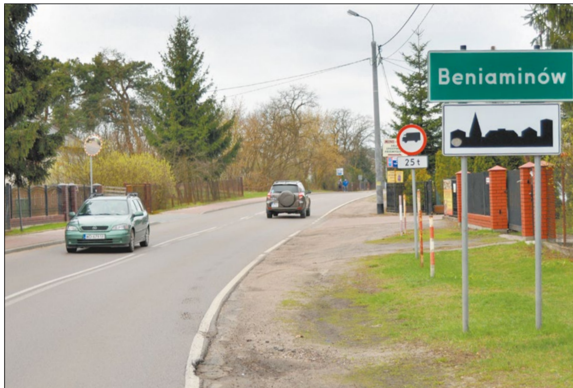
Beniaminów jest położony na granicy powiatu legionowskiego. Prowadząca do tej miejscowości droga z Białobrzegów po przebudowie będzie spełniała najwyższe standardy bezpieczeństwa

Przebudowa powiatowej drogi z Białobrzegów do Benjaminowa w gminie Nieporęt ruszy zaraz po świętach wielkanocnych. Inwestycja obejmie 4,5-kilometrowy odcinek i ma zakończyć się we wrześniu br.