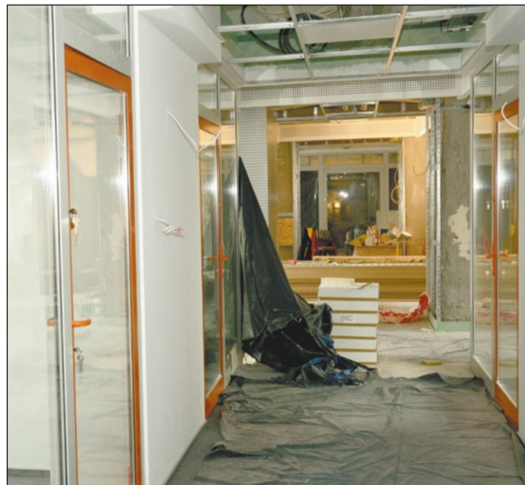
Przebudowa parteru Starostwa Powiatowego w Legionowie całkowicie zmieni jego oblicze. Będzie estetyczniej, ale przy okazji również bardziej funkcjonalnie