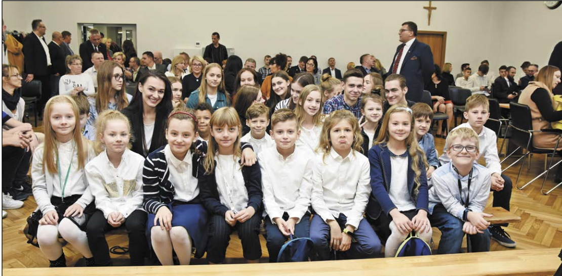
W podsumowaniu MIMS nagrody i wyróżnienia otrzymało ponad 200 zawodników i trenerów

Powiat Legionowski uhonorował uczniów, którzy z poświęceniem i powodzeniem reprezentowali nas w ubiegłym roku na Mazowieckich Igrzyskach Młodzieży Szkolnej. Wyróżnienia otrzymali uczniowie mający na koncie wysokie lokaty uzyskane na szczeblu wojewódzkim i ogólnopolskim. Uroczystość wręczenia nagród odbyła się podczas sesji rady powiatu w Legionowie.