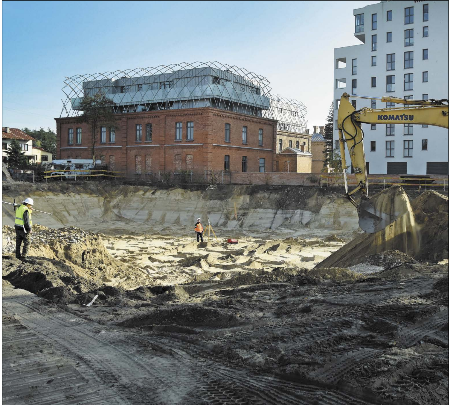
AMZ Nowo wybudowany obiekt o powierzchni całkowitej brutto 14,5 tys. m 2 i kubaturze 57,5 tys. m 3 zostanie połączony łącznikiem z istniejącą przychodnią

Na łamach „Kuriera” będziemy na bieżąco informować o postępach tej inwestycji.