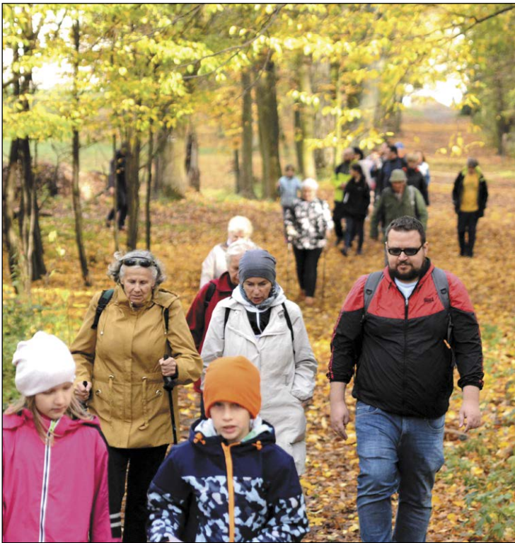
Polska złota jesień była jednym z uczestników powiatowej wycieczki Szlakiem Polski Walczącej

Takie wycieczki do miejsc związanych z historią warto organizować; szczególnie w dzisiejszych czasach. Ludzie w moim wieku jeszcze coś pamiętają, poza tym rodzice nam opowiadali. Młodzi natomiast już takiej wiedzy nie mają. Tylko ogólną. Na takiej wycieczce można wiedzę doprecyzować. Mi najbardziej utkwił w pamięci punkt umocniony z II wojny światowej, na którym niemieccy żołnierze w betonie pozostawili na pamiątkę wyryte napisy. Ja też, gdy coś budowałem w domu, na betonie pisałem datę.