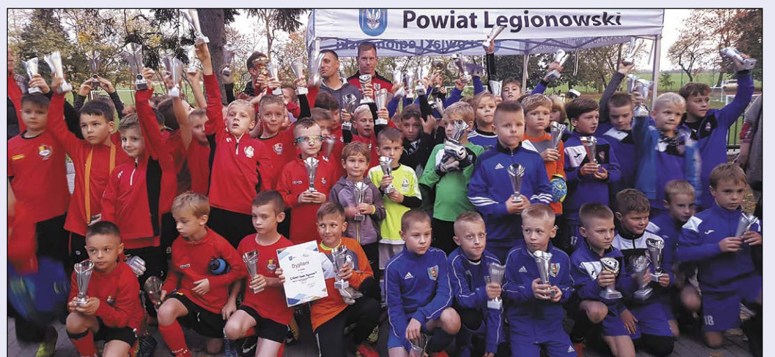
Piłkarska Liga Powiatu Legionowskiego rokrocznie gromadzi coraz większą liczbę drużyn, a co za tym idzie – coraz większą liczbę młodych piłkarzy