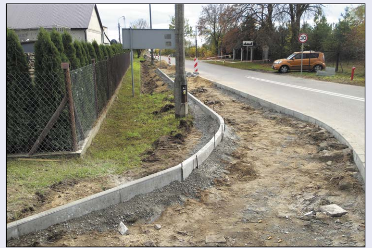
Już nie długo piesi będą mogli korzystać bez przeszkód z nowego, wygodnego chodnika