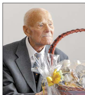
Jubilat otrzymał od Powiatu Legionowskiego prezent w postaci kosza smakołyków i okazałego tortu. Spotkanie było okazją do wspomnień i snucia planów na przyszłość

Starostwo powiatowe w Legionowie po raz kolejny gościło w swoich progach generała Stanisława Mandykowskiego. Tym razem okazją był jubileusz 100. urodzin tego niezłomnego żołnierza, weterana, działacza społecznego. Na uroczystości obecni byli przedstawiciele rodziny, samorządu i organizacji kombatanckich.