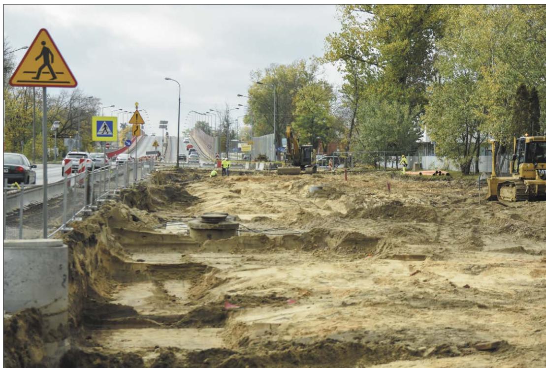
Trwają intensywne prace przy przebudowie DK 61 na odcinku od wiaduktu do granic Legionowa