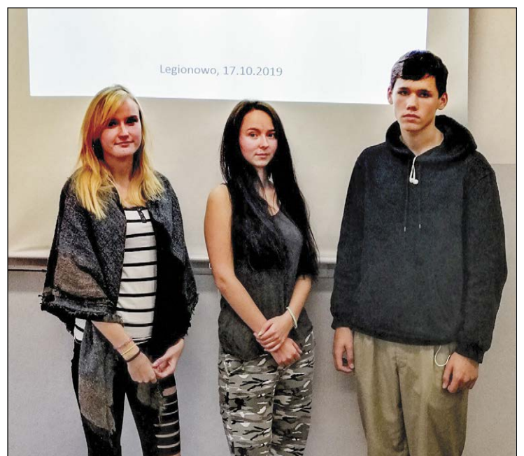
Laureaci i finaliści olimpiady mogą być zwolnieni w części lub w całości z egzaminów wstępnych do szkół wyższych na kierunek zgodny z profilem Olimpiady. Gratulujemy i życzymy powodzenia na kolejnych etapach zmagania. Na zdjęciu uczniowie z PZSP w Legionowie