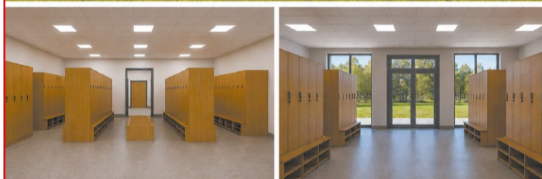
Wizualizacja rozbudowy LO im. Stanisława Lema w Stanisławowie Pierwszym

Z myślą o wygodzie społeczności Liceum Ogólnokształcącego im. Marii Konopnickiej planowany jest montaż klimatyzacji w części szkoły z salami gimnastycznymi. Prace, które potrwać około dwóch miesięcy, rozpoczną się z początkiem okresu wakacyjnego. Za realizację tego zadania odpowiada Przedsiębiorstwo Wielobranżowe COOL-KLIMAT Grzegorz Szymkiewicz, a koszt zadania to 400 000,00 zł. To już trzeci etap inwestycji rozpoczętej w 2025 r., kiedy to zrealizowano prace w część budynku od strony ul. Dietricha oraz w tzw. łączniku, czyli przestrzeni łączącej skrzydła szkoły. Nowoczesny system klimatyzacji pozwoli skutecznie obniżyć temperaturę w najbardziej nasłonecznionych pomieszczeniach, a wkrótce również w częściach sportowych liceum.