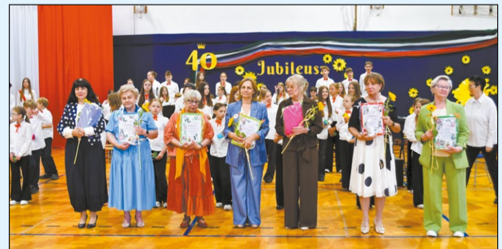
Obchody 40-lecia SP nr 8 w Legionowie zgromadziły społeczność szkolną i zaproszonych gości wokół wspólnej historii, tradycji i osiągnięć placówki

29 maja obchodzono jubileusz 40-lecia istnienia Szkoły Podstawowej nr 8 im. 1 Warszawskiej Dywizji Piechoty w Legionowie. Wydarzenie było okazją do wspólnego świętowania, wspomnień oraz podkreślenia ważnej roli, jaką szkoła od czterech dekad odgrywa w życiu mieszkańców powiatu legionowskiego.