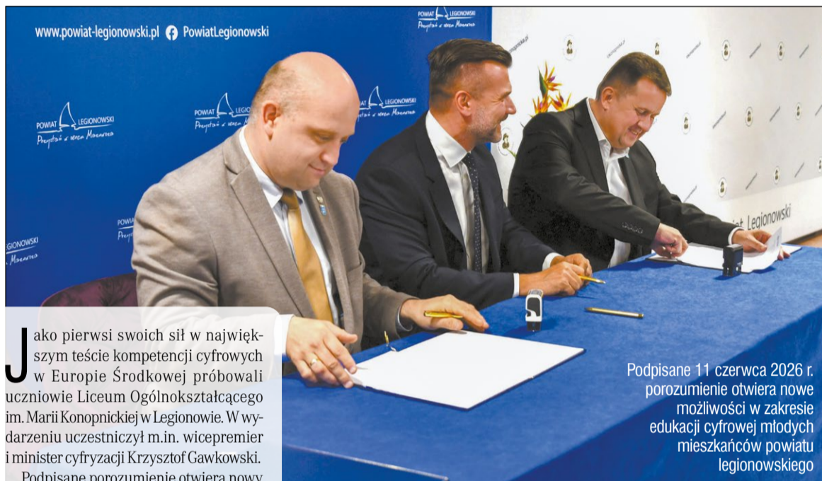
Podpisane 11 czerwca 2026 r. porozumienie otwiera nowe możliwości w zakresie edukacji cyfrowej młodych mieszkańców powiatu legionowskiego

11 czerwca Powiat Legionowski zawarł ze Związkiem Cyfrowa Polska porozumienie w sprawie realizacji we wszystkich szkołach prowadzonych przez Powiat Legionowski IT Fitness Test – testu online sprawdzającego poziom kompetencji cyfrowych i umiejętności korzystania z technologii informacyjno-komunikacyjnych.