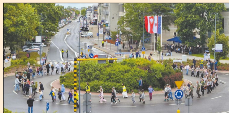
Tradycyjnie na rondzie im. marsz. Józefa Piłsudskiego w Legionowie uczestnicy Festiwalu zatańczyli belgijkę

W dniach 12–14 czerwca w Legionowie odbył się XVII Ogólnopolski Harcerski Festiwal Piosenki „Wiosenne Czarowanie”. Przez trzy dni ratusz miejski był miejscem spotkania harcerzy, instruktorów i miłośników piosenki harcerskiej z całej Polski. Powiat Legionowski ufundował część nagród dla laureatów przeglądu.