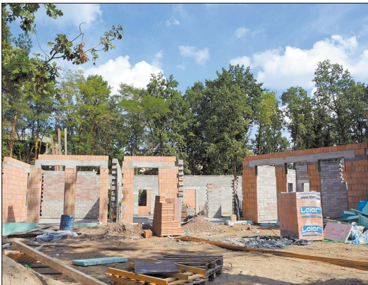
Powiat Legionowski jest właśnie w trakcie realizacji inwestycji związanej z budową Centrum Poradnictwa i Wczesnego Wspomagania Rozwoju Dziecka

W ciągu ostatnich czterech lat Powiat Legionowski zrealizował inwestycje na łączną kwotę ponad 37 mln zł. Te najbardziej znaczące dotyczyły przebudowy dróg, modernizacji placówek edukacyjnych i przychodni oraz poprawy jakości usług świadczonych na rzecz obsługi mieszkańców. Jest się czym chwalić.