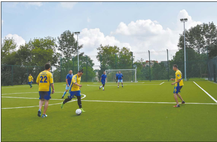
Boisko sportowe przy PZSP w Serocku

odwodnienie, chodniki i zjazdy do posesji. Wzdłuż jezdni, w jej środkowej części, wybudowano podwyższenie z kostki oddzielające oba pasy. Przejścia dla pieszych otoczono wysepkami. Wyremontowano nawierzchnię pętli autobusowej w Białobrzegach. Koszt inwestycji, w całości finansowanej przez Powiat Legionowski, to 3.171.138,84 zł.