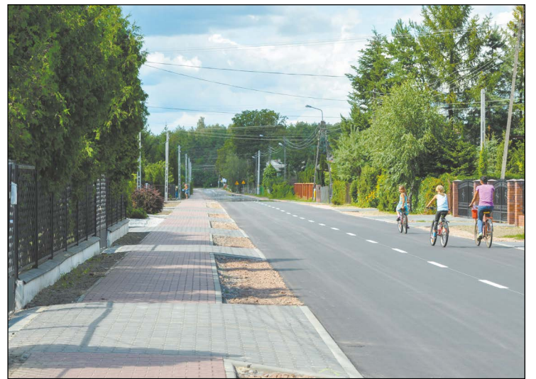
Powiat przebudował ulicę Szkolną w Wólce Radzywińskiej (gm. Nieporęt)

Na bieżąco monitorujemy potrzeby w zakresie inwestycji i staramy się na nie odpowiadać. Realizacja tych przedsięwzięć zawsze podyktowana jest bezpieczeństwem i wygodą naszych mieszkańców. Dzięki dobrej współpracy z gminami powiatu oraz aktywnemu pozyskiwaniu środków zewnętrznych możemy zrobić znacznie więcej przyczyniając się do pozytywnych zmian na naszym terenie. Zadowolenie mieszkańców jest naszym priorytetem.