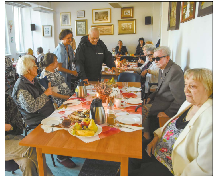
Wspólne świętowanie wpływa na poprawę nastroju oraz kondycję fizyczną pensjonariuszy DPS „Kombatant”

Wspólne celebrowanie urodzin i imienin to dla podopiecznych Domu Pomocy Społecznej „Kombatant” w Legionowie nic niezwykłego. Teraz jednak świętowanie zyskało nową oprawę.