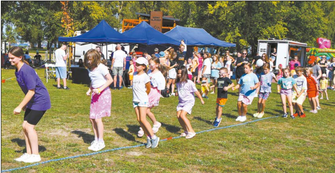
Spotkanie zorganizowano po raz szesnasty. Zabawie sprzyjała nie tylko piękna, iście letnia aura, ale i niezwykła atmosfera

7 września na terenie Kompleksu Rekreacyjno-Wypoczynkowego Nieporęt-Pilawa odbył się doroczny piknik pieczy zastępczej z terenu powiatu legionowskiego, który zorganizowało Powiatowe Centrum Pomocy Rodzinie w Legionowie.