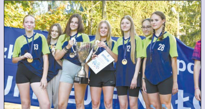
Sztafeta dziewcząt z LO im. Konopnickiej w Legionowie sięgnęła po złoto

Na terenie Zespołu Szkół w Komornicy odbyły się biegi przełajowe, w których wystartowały dzieci i młodzież z terenu powiatu legionowskiego. Zawody odbyły się w ramach Mazowieckich Igrzysk Młodzieży Szkolnej.