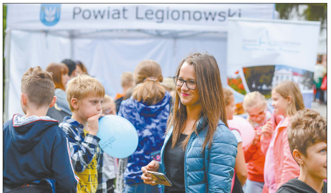
Do stoiska Powiatu Legionowskiego tradycyjnie ustawiała się długa kolejka chętnych do wzięcia udziału w konkursie wiedzy o regionie

Tegoroczny festiwal to blisko 50 stoisk wystawowych z ponad setką projektów tematycznych. Przybyli na wydarzenie dzieci, młodzież i dorośli mogli obejrzyć mnóstwo ciekawych prezentacji, wśród nich dotyczące zagadnień z zakresu chemii, agrofizyki, konserwacji zabytków, zdrowego żywienia, ekologii i biologii. Dzięki tak dużej różnorodności każdy miał szansę odnaleźć dziedzinę, która interesuje go najbardziej i poszerzyć wiedzę o nieznaną dotąd zagadnienie. Można było także poeksperymentować ze sztuką – do stoiska garncarza czy pracowni enakustyki ustawiała się długa kolejka chętnych. Nowością były sobotnie warsztaty telewizyjne prowadzone przez dziennikarza, pisarza i podróżnika