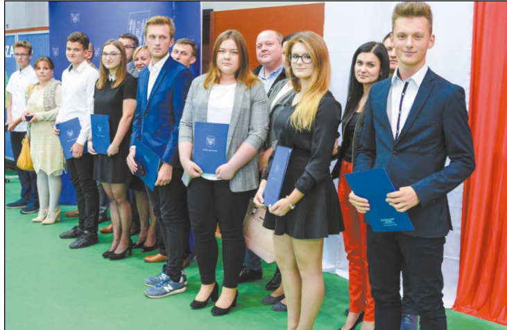
W tym roku nagrodę Starosty Legionowskiego za najlepsze wyniki w nauce otrzymało 111 uczniów

Już po raz 12. wręczono nagrody Starosty Legionowskiego dla najlepszych uczniów ze szkół prowadzonych przez Powiat. W tym roku wyróżniono 111 prymusów.