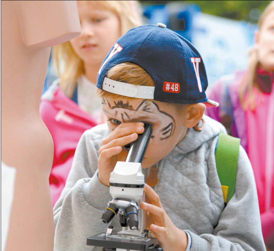
Festiwal Nauki w Jabłonce to wyjątkowa okazja do zdobycia wiedzy i poznania nowinek z różnych dziedzin nauki w jednym miejscu i czasie

„Miej odwagę być mądrym – Sapere Aude”. Pod tym hasłem już po raz 22. na terenie zabytkowego kompleksu pałacowo-parkowego w Jabłonce odbył się Festiwal Nauki. Przez cały weekend (22–23 września br.) na odwiedzających czekały atrakcje i nowinki ze świata wiedzy. Wydarzenie współorganizował Powiat Legionowski.