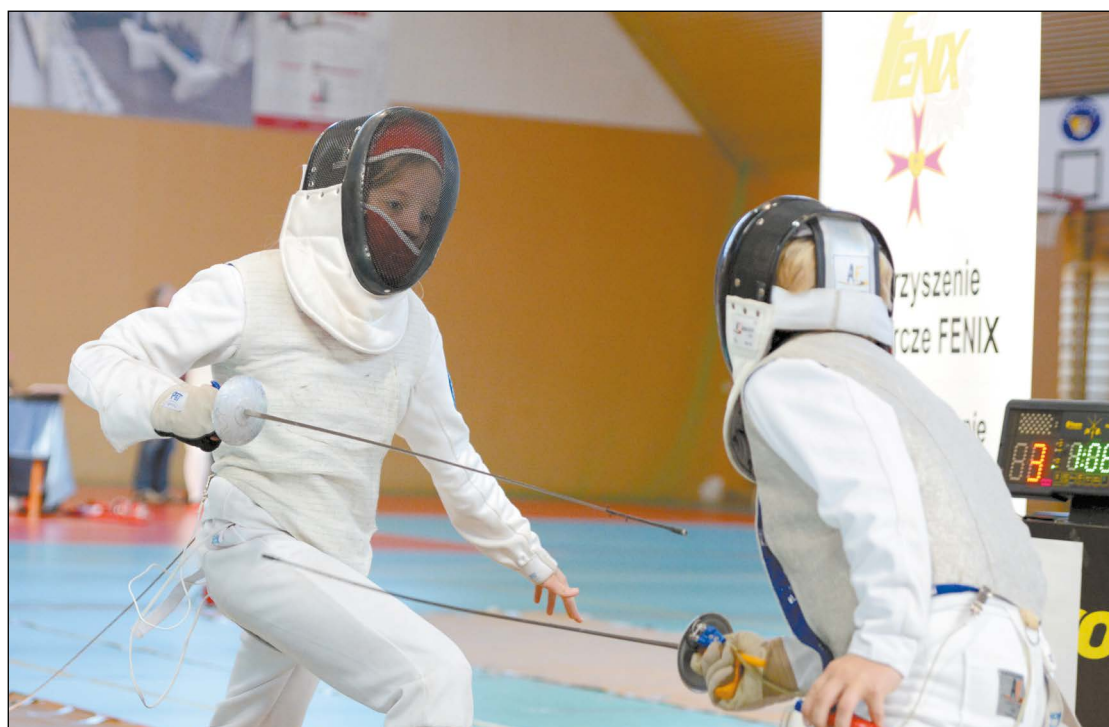
Szermierka jest widowiskową i emocjonującą dyscypliną sportu. UKS „Feniks” Wieliszew zaprasza dzieci i młodzież na treningi