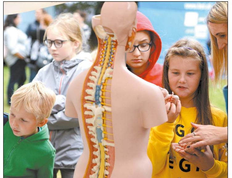
Impreza świetnie łączy walory naukowe z dobrą zabawą

Przyjechałem z dziadkami i bratem. Jestem tu pierwszy raz, to znaczy na festiwalu, bo w parku w Jabłonce bywam często. Uważam, że tu jest pięknie. Jest super i tyle stoisk, że nie wiem, które najlepsze. Robiłem już garnki z gliny, odciskałem liście w kolorowym wosku, odwiedziłem stoisko pszczelarza i robiłem doświadczenia chemiczne. A najlepsze jest to, że wygrałem masę gadżetów. Najlepszą zdobycz upolowałem w namiocie Powiatu Legionowskiego. Mam nadzieję, że będę mógł być tutaj za rok.