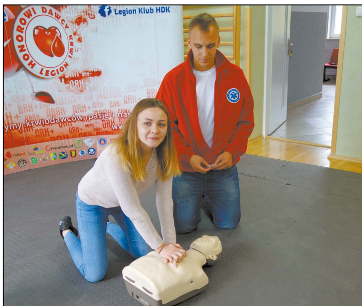
Uczestnicy szkolenia zdobywają praktyczną wiedzę z zakresu udzielania pierwszej pomocy i obsługi defibrylatora. Być może kiedyś uratują czyjeś życie

W tym roku Powiat Legionowski zakupił przenośne defibrylatory dla prowadzonych przez siebie szkół. Właśnie ruszyły szkolenia dla uczniów i nauczycieli z zakresu obsługi tych urządzeń.