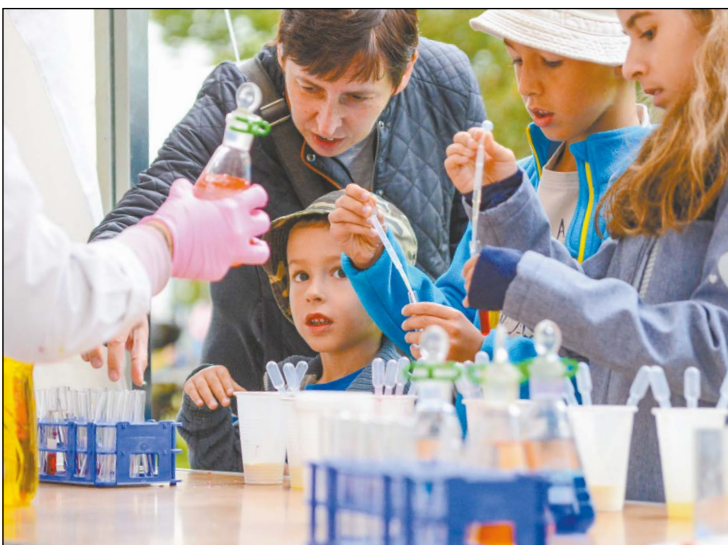
Możliwość przeprowadzenia eksperymentów na żywo jest jedną z największych atrakcji podczas Festiwalu Nauki

Tegoroczny festiwal to blisko 50 stoisk wystawowych z ponad setką projektów tematycznych. Przybyli na wydarzenie dzieci, młodzież i dorośli mogli obejrzyć mnóstwo ciekawych prezentacji, wśród nich dotyczące zagadnień z zakresu chemii, agrofizyki, konserwacji zabytków, zdrowego żywienia, ekologii i biologii. Dzięki tak dużej różnorodności każdy miał szansę odnaleźć dziedzinę, która interesuje go najbardziej i poszerzyć wiedzę o nieznaną dotąd zagadnienie. Można było także poeksperymentować ze sztuką – do stoiska garncarza czy pracowni enakustyki ustawiała się długa kolejka chętnych. Nowością były sobotnie warsztaty telewizyjne prowadzone przez dziennikarza, pisarza i podróżnika