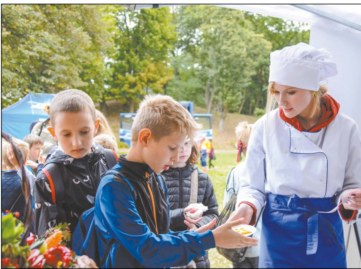
Wiedzą z zakresu gastronomii z uczestnikami festiwalu dzielili się uczniowie Powiatowego Zespołu Szkół Ponadgimnazjalnych w Legionowie, który na imprezie miał swoje stoisko