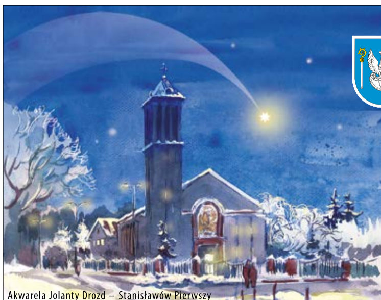
Akwarela Jolanty Drozd - Stanisław Pierwszy

Priorytetem władz powiatu jest zapewnienie mieszkańcom odpowiedniej jakości życia. To oznacza konieczność ciągłego inwestowania w dziedzinę, które są im w codziennej egzystencji najbliższe: zdrowie, oświata, bezpieczeństwo i infrastruktura drogowa. Jeśli weźmiemy pod uwagę, że liczba mieszkańców powiatu sukcesywnie rośnie, śmiało możemy uznać, że zarówno powiat, jak i gminy czynią to z powodzeniem. A liczby mówią same za siebie: na koniec 2015 roku wg danych GUS było nas już ponad 113 tysięcy - o tysiąc osób więcej niż na koniec 2014 i o 2 tysiące więcej niż w 2013.