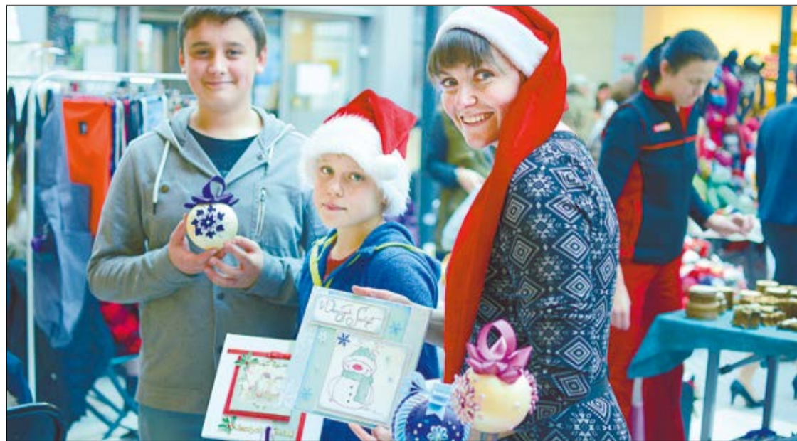
Bożonarodzeniowe cuderińki cieszyły się największą popularnością wśród odwiedzających. Ręcznie wykonane ozdoby i bibeloty to doskonały przepis na stworzenie w domu świątecznego klimatu