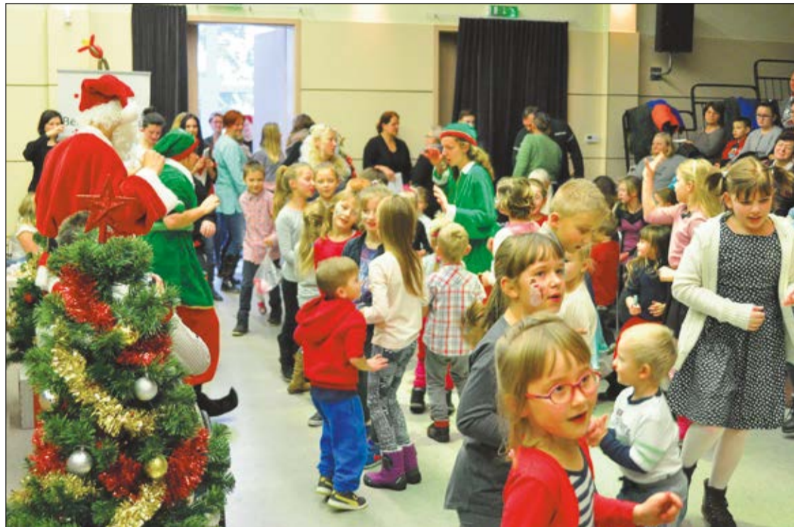
Mikołajkowe spotkania środowiska rodzin zastępczych to już tradycja w powiecie legionowskim. Tegoroczne odbyło się w gościnnych progach wieliszewskiej sali widowiskowej im. K. Klenczona

Powiatowe Centrum Pomocy Rodzinie w Legionowie zaprosiło osoby niepełnosprawne oraz środowisko rodzin zastępczych i chotomowskiego Domu Dziecka na spotkanie mikołajkowe. Rozdano ponad 300 zawierających słodkie prezenty paczek.