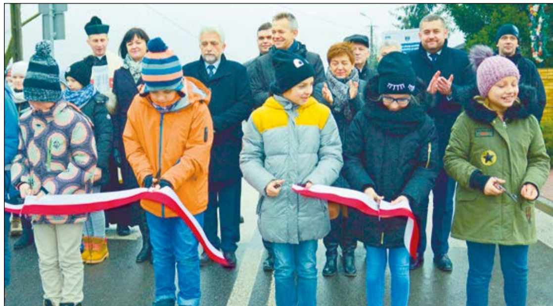
Zakończona właśnie przebudowa ul. Szkolnej w Izabelinie poprawi bezpieczeństwo uczestników ruchu, a przede wszystkim uczniów znajdującej się przy niej szkoły podstawowej

Przedstawiciele samorządów, społeczności Szkoły Podstawowej im. I Batalionu Saperów Kościuszkowskich, parafii oraz sołectwa Izabelin uroczystie otworzyli przebudowaną ul. Szkolną.