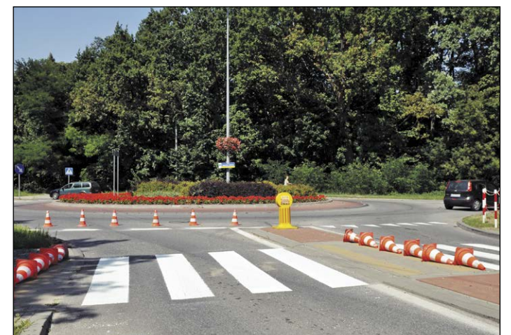
Odnawianie pasów na jezdniach wpływa na bezpieczeństwo uczestników ruchu. Powiat regularnie konserwuje powierzchnie zarządzanych przez siebie dróg, również w zakresie odmalowywania zużytych elementów oznakowania poziomego. Na zdjęciu okolice ronda w Beniaminowie (gm. Nieporęt)