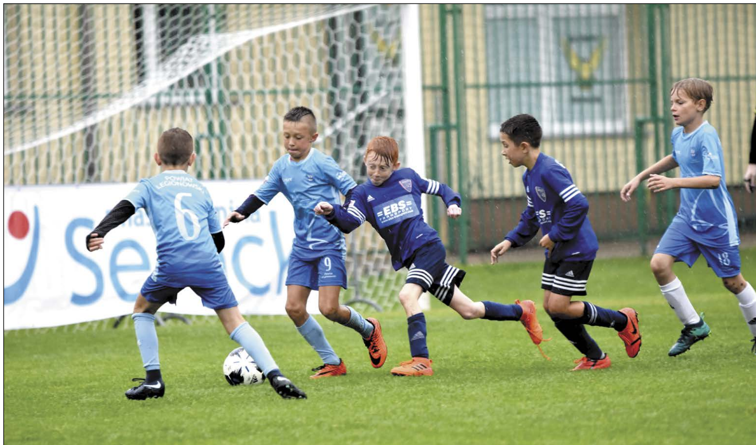
Reprezentacja Powiatu Legionowskiego (w błękitnych koszulkach), dzięki regularnym treningom, gra na coraz wyższym poziomie

Jeden z największych w regionie tegorocznych międzynarodowych turniejów piłkarskich dla młodzieży – Twin Cities Serock Cup 2019 – zgromadził ponad 700 zawodników z roczników 2009 i 2010, grających w 48 klubach. Rywalizację wygrały zespoły poznańskiej Akademii Piłkarskiej Reissa (2009) oraz Znicza Pruszków (2010).