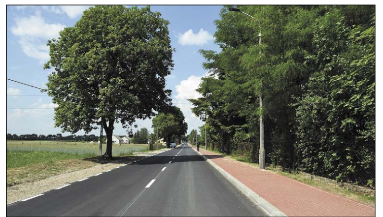
Dofinansowanie za inwestycje drogowe pokryje aż 74% ich wartości. Na zdjęciu przebudowana droga w Karolinie