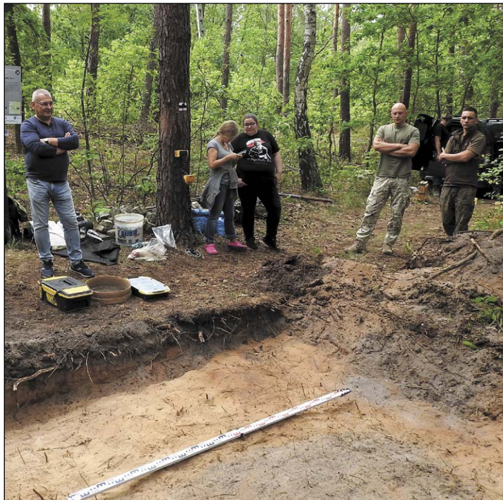
W pracach archeologicznych uczestniczyli specjaliści z Instytutu Pamięci Narodowej i wolontariusze. Wśród nich znaleźli się członkowie Nieporęckiego Stowarzyszenia Historycznego