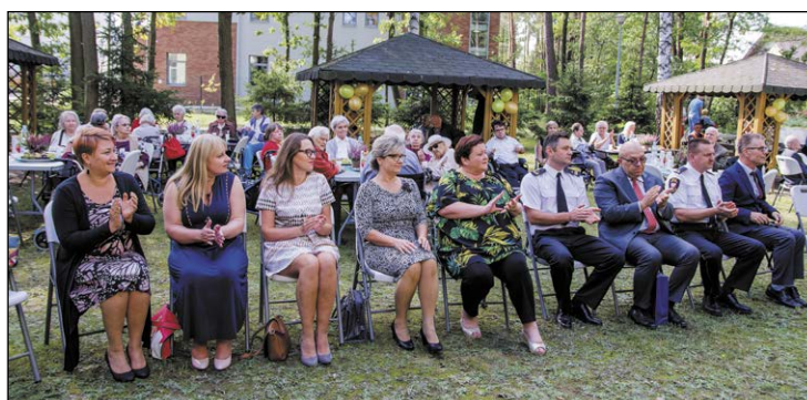
Impreza zgromadziła znakomitych gości – przedstawicieli władz samorządowych, instytucji i służb z terenu powiatu

i Powiatu Legionowskiego. Powodów tej radości jest kilka. Pracuję od lat w Powiatowym Zespole Szkół i Placówek Specjalnych w Legionowie, a DPS „Kombatant” jest naszym najbliższym sąsiadem. Często odwiedzamy mieszkańców „Kombatanta” z różnego rodzaju okolicznościowymi przedstawieniami. Współpracujemy od momentu powstania tego domu i jest to współpraca na wielu płaszczyznach. Od kilku lat mieszkańcy DPS wspierają