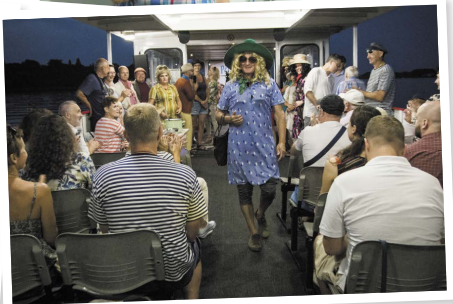
„Proszę pana, ja też chodzę na pokazy mody, ale nie mówię, że robię to z miłości do mojej mamy.”