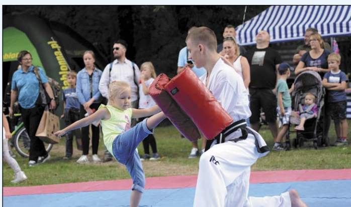
Jedną z atrakcji imprezy był pokaz karate. Była też możliwość spróbowania swoich sił w sztukach walki, z której chętnie korzystali najmłodszy