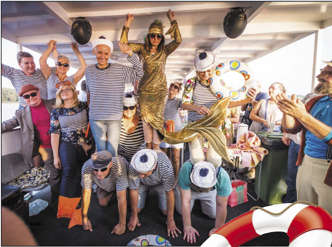
Sekcja gimnastyczna w dobrej formie

Powiatowa Instytucja Kultury w Legionowie tym razem zafundowała mieszkańcom niezwykłą podróż w czasie. Wakacyjną odsłonę „Kina Otwartego” zadeedykowano kultowemu filmowi „Rejs”, do którego zdjęcia na wodach Jeziora Zegrzyńskiego kręcono dokładnie pół wieku temu.