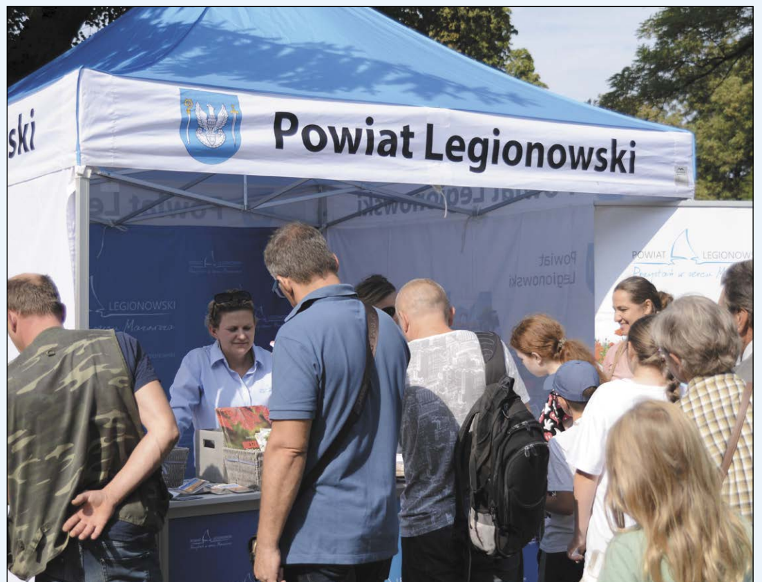
Stoisko Powiatu Legionowskiego przeżyło prawdziwe oblężenie. Konkurs wiedzy z atrakcyjnymi nagrodami jak zwykle cieszył się ogromnym powodzeniem wśród mieszkańców

Doroczne Święto Gminy Jabłonna jest nie tylko okazją do wspaniałej zabawy, ale także daje mieszkańcom szansę spotkać się i zintegrować. Wspólne spędzanie czasu jest ważnym elementem w budowaniu i podtrzymywaniu tożsamości społecznej, tak ważnej w wymiarze lokalnym.