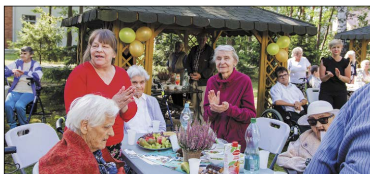
Urodzinowe spotkanie w DPS „Kombatant” zorganizowano pod chmurką

Dom Pomocy Społecznej „Kombatant” w Legionowie świętuje w tym roku 18-lecie istnienia. Razem z mieszkańcami i zaproszonymi gośćmi w jubileuszowym spotkaniu uczestniczyły osoby z niepełnosprawnościami, które odwiedziły placówkę w ramach obchodów VIII Dni Osób Niepełnosprawnych Miasta Legionowo i Powiatu Legionowskiego.