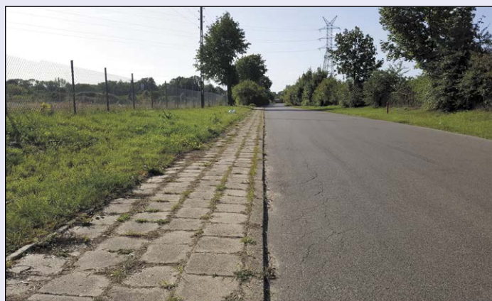
Jedną z zaplanowanych przez Powiat w najbliższym czasie inwestycji jest remont chodnika w miejscowości Dębe (gmina Serock)