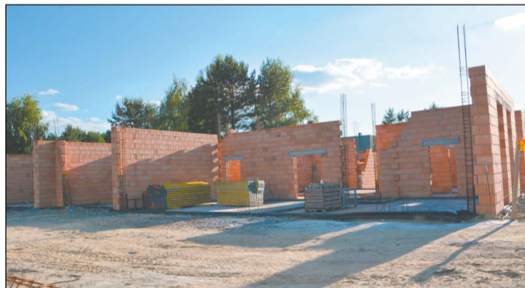
Budowa liceum w Stanisławowie Pierwszym przebiega zgodnie z harmonogramem. Trwają prace naziemne

Trwają prace na budowie siedziby Liceum Ogólnokształcącego im. Stanisława Lema w Stanisławowie Pierwszym, jednej z największych inwestycji Powiatu Legionowskiego. Według harmonogramu gmach liceum powstanie do jesieni 2023 roku.