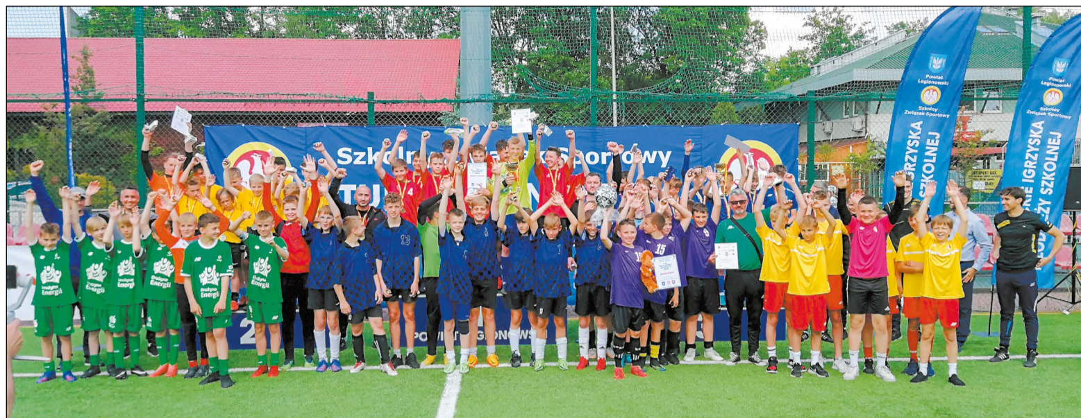
MK Organizatorzy Mazowieckich Igrzysk Młodzieży Szkolnej postanowili wykorzystać profesjonalną legionowską bazę treningową do organizowania u nas turniejów na wysokim poziomie

Zawody odbyły się w ramach Mazowieckich Igrzysk Młodzieży Szkolnej. Wszystkie mecze turnieju finałowego rozgrywano na sztucznej murawie bocznych boisk przy legionowskim Stadionie Miejskim.