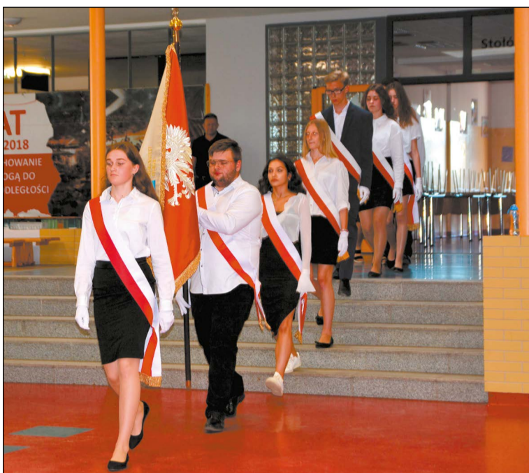
Uczniowie i nauczyciele rozpoczęli zasłużone wakacje

Wszystkim uczniom, nauczycielom i pracownikom życzę udanego i bezpiecznego wypoczynku. Za Wami rok wyjątkowy i trudniejszy niż zwykle, bo upływający w pandemicznej rzeczywistości. Niech nadchodzące wakacje będą okazją do poznania nowych miejsc, nawiązania ciekawych znajomości i zgromadzenia energii na kolejny rok szkolny.