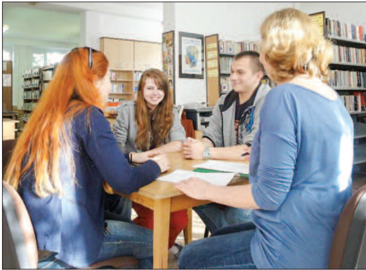
Licealiści przygotowują prezentację multimedialną, którą pokażą podczas finału projektu

W Liceum Ogólnokształcącym im. Marii Konopnickiej w Legionowie pod patronatem Starosty Legionowskiego realizowany jest projekt animacyjno-edukacyjny, zatytułowany „Tuwim Re-Aktywacja”. Jego organizatorem jest Dyskusyjny Klub Książki „Ścieżki”, a celem przypomnienie i upowszechnienie wiedzy o tej nietuzinkowej postaci.