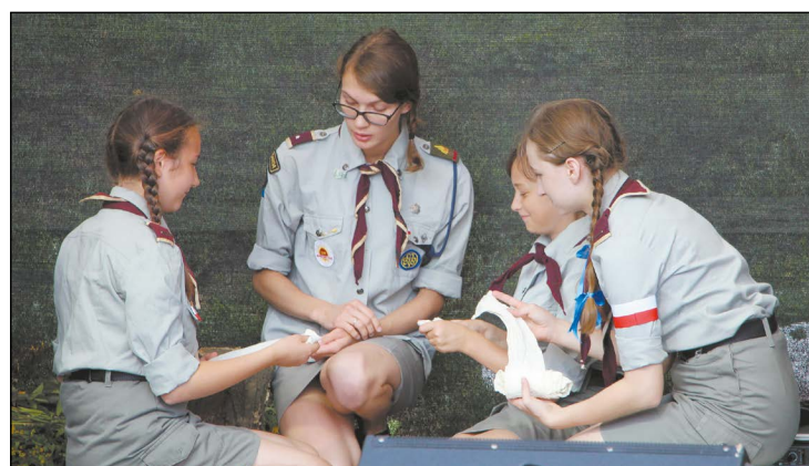
Inszenizacja elegii była okazją do poznania lokalnej historii oraz upamiętnienia jej bohaterów