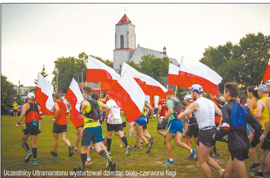
Uczestnicy Ultramaratonu wystartowali dzierżąc biało-czerwone flagi