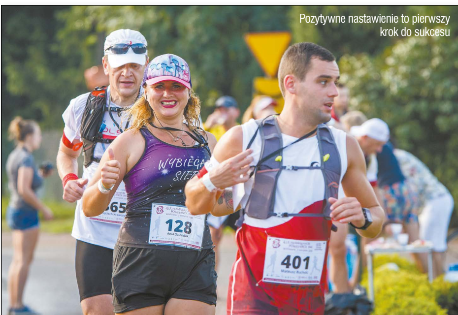
Pozytywne nastawienie to pierwszy krok do sukcesu