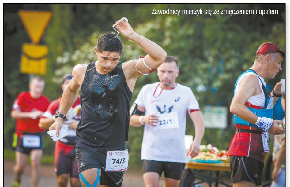
Zawodnicy mierzyli się ze zmęczeniem i upałem