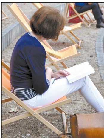
Leżak i ulubiona lektura to przepis na udane popołudnie

„Czytanie w Plenerze” to już stała pozycja w kalendarzu miejskich imprez, którą Powiatowa Instytucja Kultury w Legionowie organizuje na koniec wakacji.