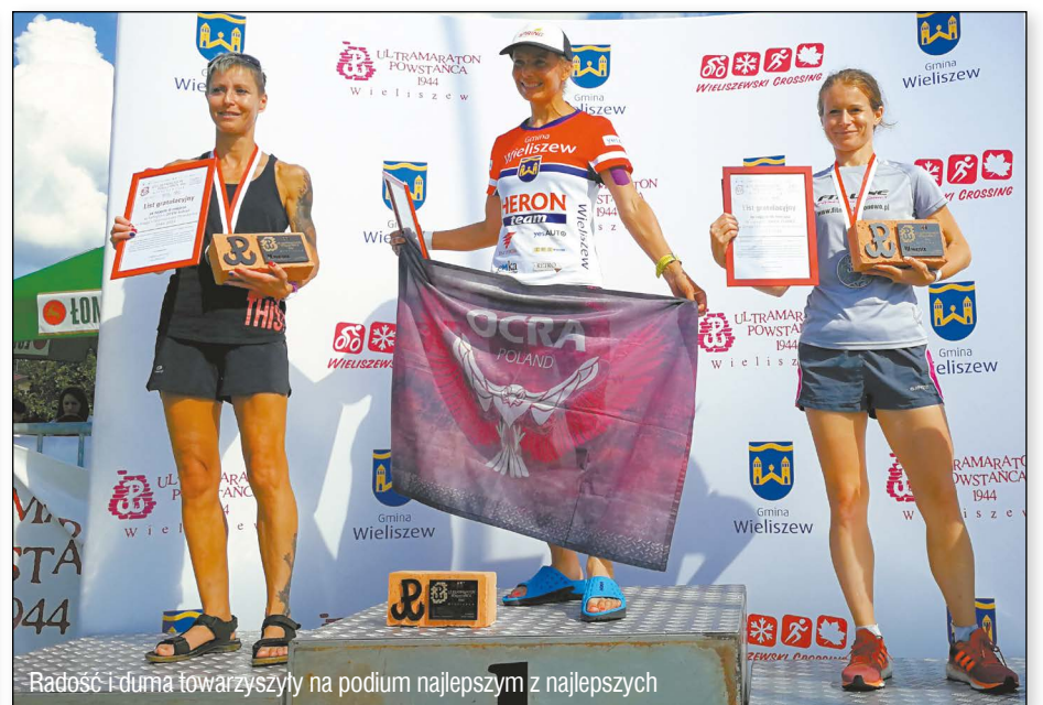
Radosć i dumna towarzyszyły na podium najlepszym z najlepszych