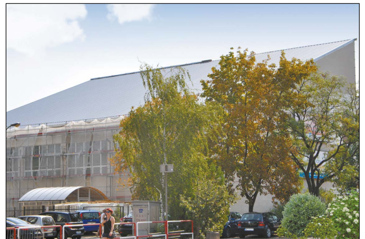
Prace przy wymianie dachu hali sportowej Powiatowego Zespołu Szkół Ogólnokształcących w Legionowie przebiegają zgodnie z planem. Inwestycja jest już prawie zakończona

W tej chwili trwają prace wykończeniowe. Montowane są m.in. nowe obróbki blacharskie dachu, bariery przeciwśnieżne w strefie okapowej, orynnowanie oraz instalacja odgromowa. Nowe poszycie zagwarantuje wieloletnią, bezproblemową eksploatację sali gimnastycznej. AMZ