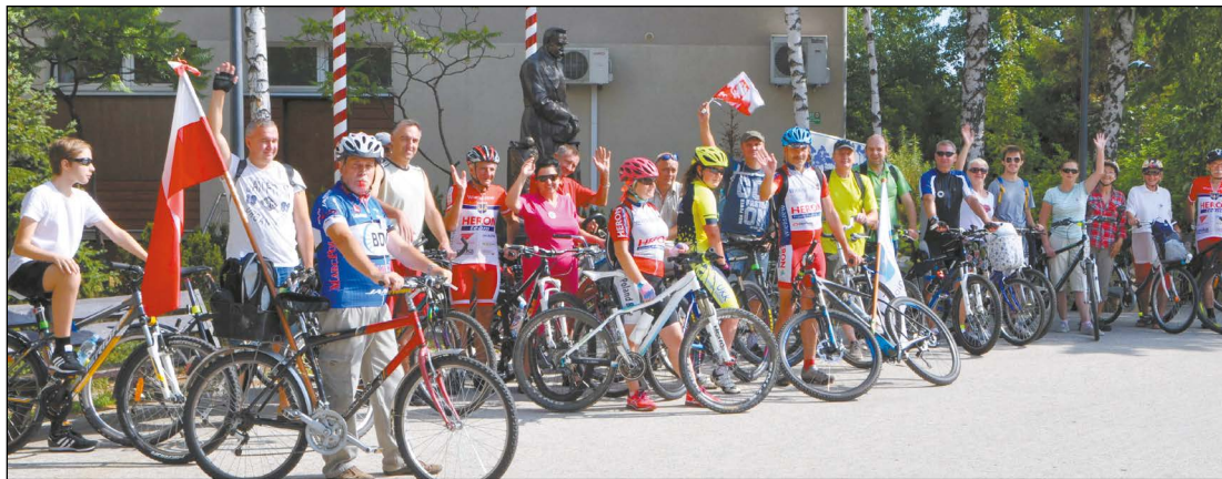
Coroczny Patriotyczny Rajd Rowerowy TPL cieszy się niesłabnącą popularnością. W tym roku wystartował spod pomnika marsz. Józefa Piłsudskiego w Legionowie

Towarzystwo Przyjaciół Legionowa (TPL) we współpracy z Powiatem Legionowskim zorganizowało 15 sierpnia br. Patriotyczny Rajd Rowerowy z Legionowa do Wólki Radzyńskiej, który był hołdem złożonym bohaterom Bitwy Warszawskiej 1920 r. Wzięły w nim udział 22 osoby z terenu powiatu i Warszawy.