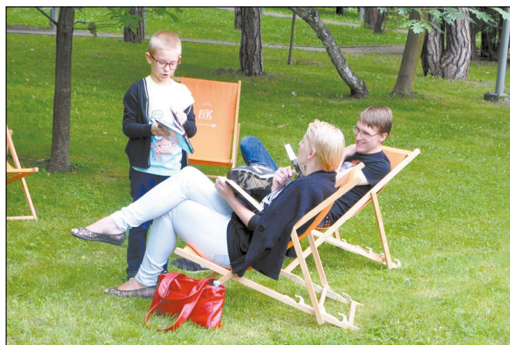
Z możliwości poczytania ulubionej książki w plenerze skorzystali zarówno mali, jak i duzi mieszkańcy

Przyszliśmy razem z żoną, bo uznaliśmy, że to ciekawa inicjatywa. Książki towarzyszą nam na co dzień i chętnie skorzystaliśmy z możliwości wspólnego czytania z innymi osobami, w dodatku w miłym otoczeniu zieleni.